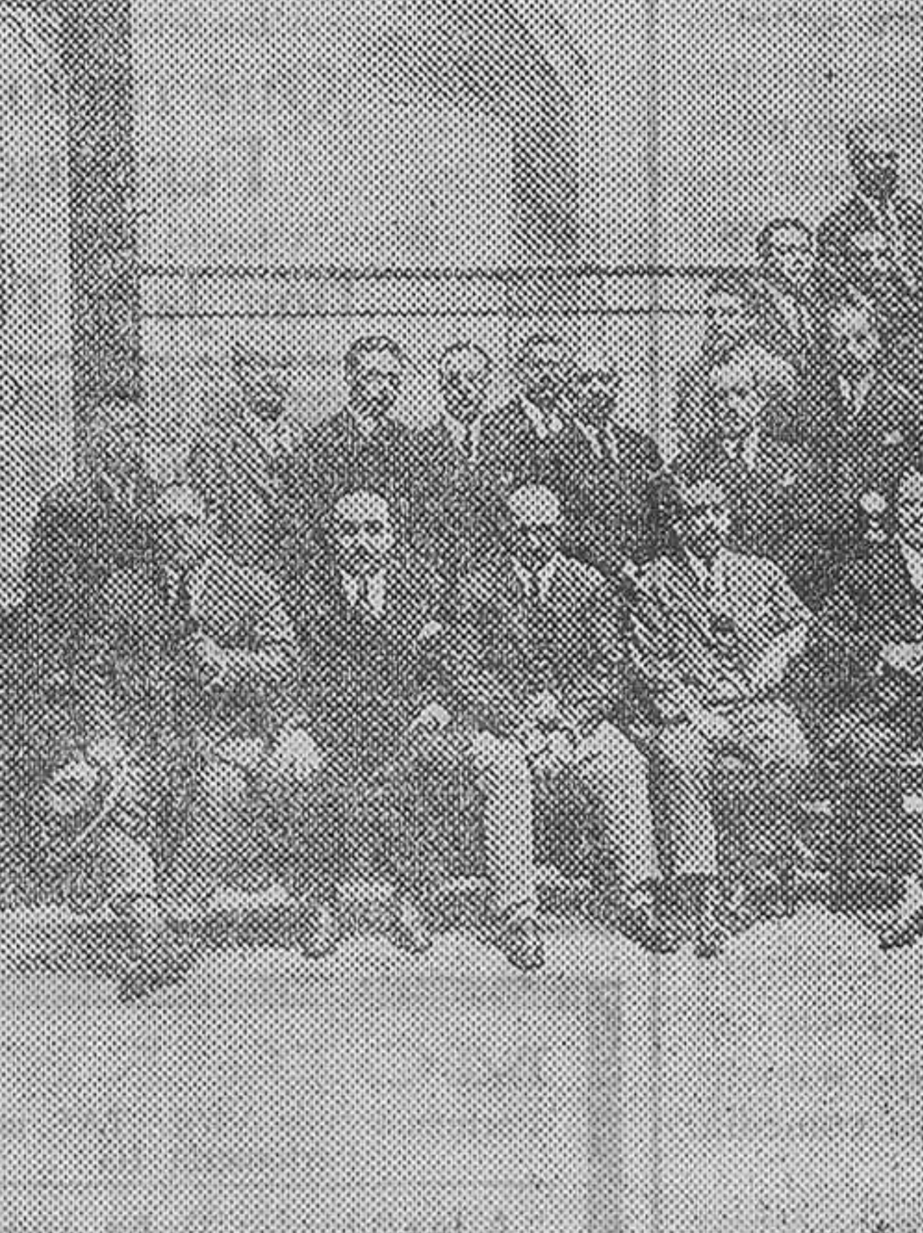
El director-gerente, jefes y personal empleado en la oficina central

Esto, que todo hace referencia a la clientela del Monte de Piedad, no quiere decir que se olvidara de los imponentes, pues en 1919 contruyó con un donativo de quinientas libretas, con una imposición inicial cada una de 150 pesetas a la obra de los Homenajes a la Vejez; en 1921, y con motivo de la implantación en Valencia del Retiro obrero obligatorio, contribuyó con 10.000 pesetas para la fundación de la Caja Regional, colaboradora de dicho