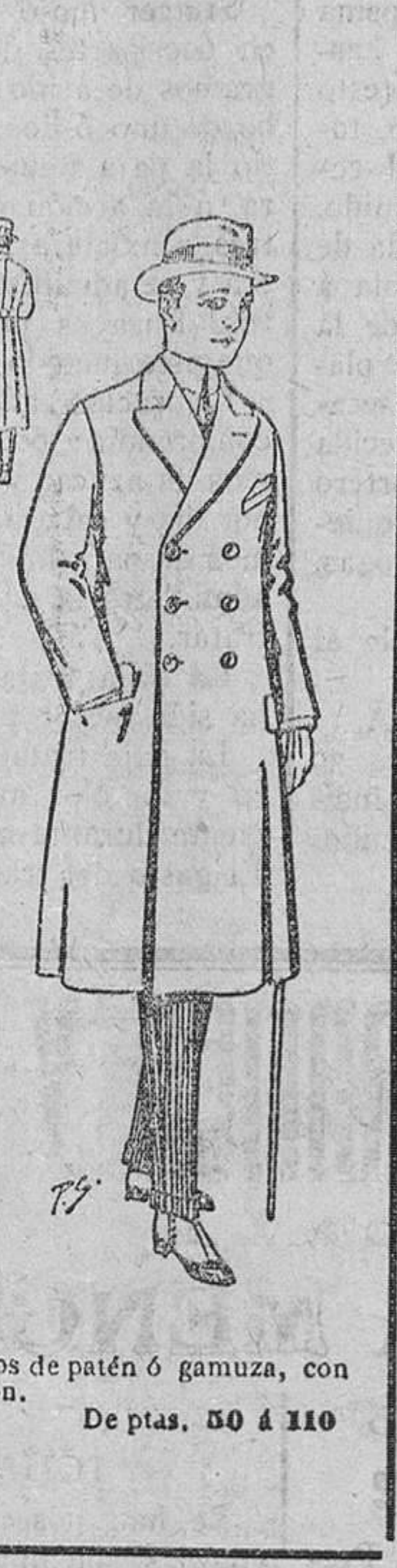
Abrigos de patén ó gamuza, con cinturón. De ptas. 50 á 110.

Ropas confeccionadas para caballero, señora, niño y niña.