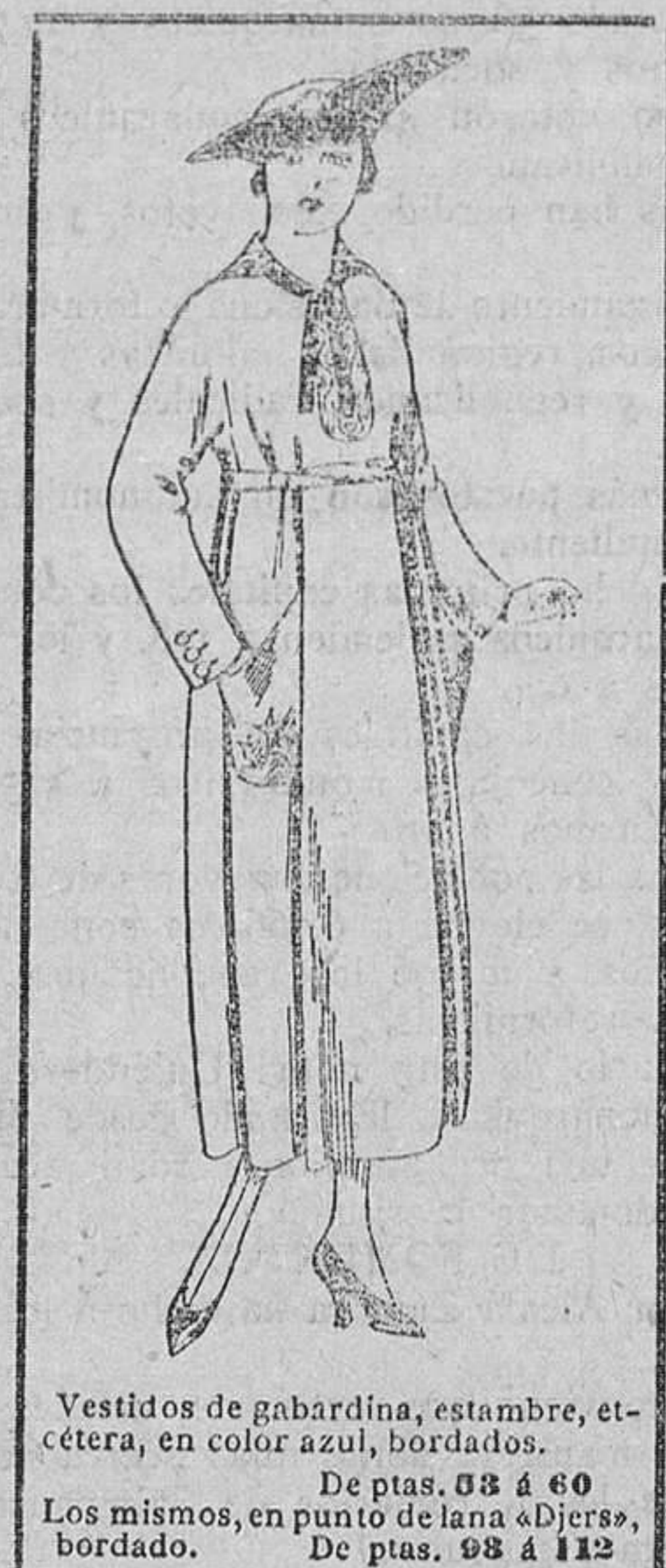
Vestidos de gabardina, estambre, etcétera, en color azul, bordados. De ptas. 68 á 60. Los mismos, en punto de lana abierta, bordado. De ptas. 98 á 112.

SUCURSALES: Madrid — Barcelona — Alicante — Almería — Bilbao — Cádiz — Cartagena — Gijón — Granada — Málaga — Palma de Mallorca — Santander — Sevilla — Valladolid — Zaragoza.