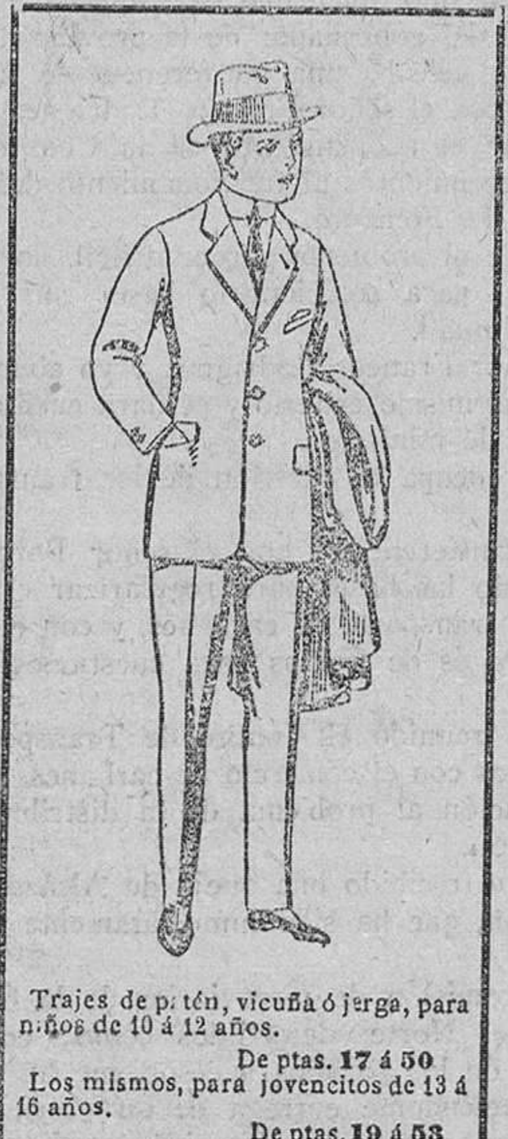
Trajes de p. tén, vicuña ó jirga, para niños de 10 á 12 años. De ptas. 17 á 50. Los mismos, para jovencitos de 14 á 16 años. De ptas. 19 á 58.