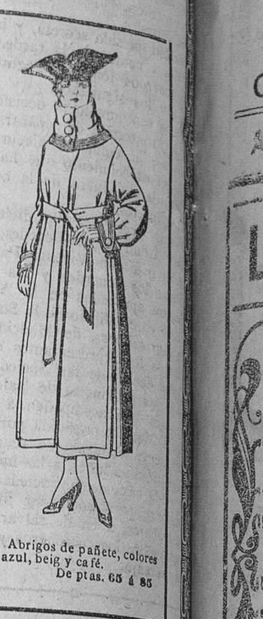
Abrigos de pañete, colores azul, beige y café. De ptas. 65 á 85.