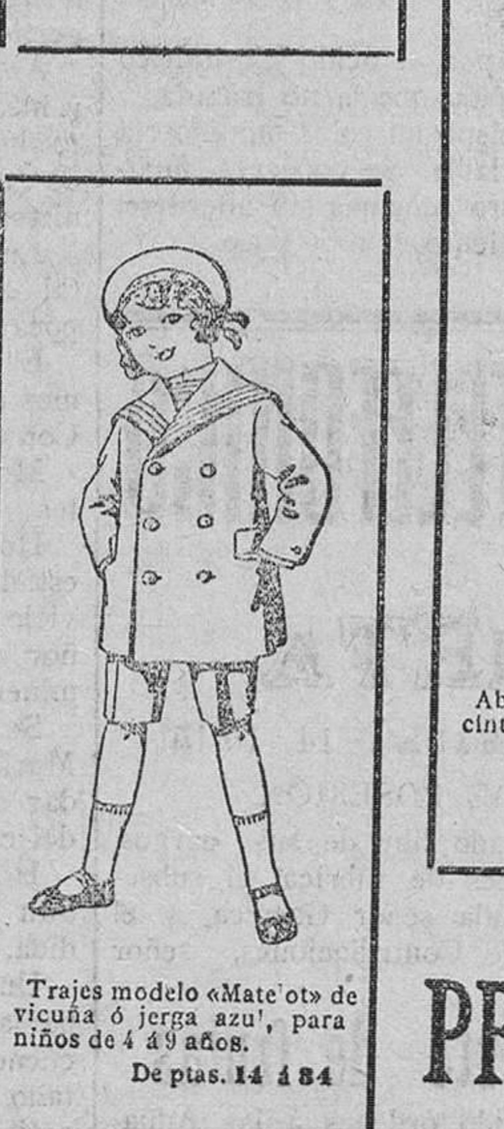
Trajes modelo «Mate» ó de vicuña ó jirga azul, para niños de 4 á 9 años. De ptas. 14 á 84.