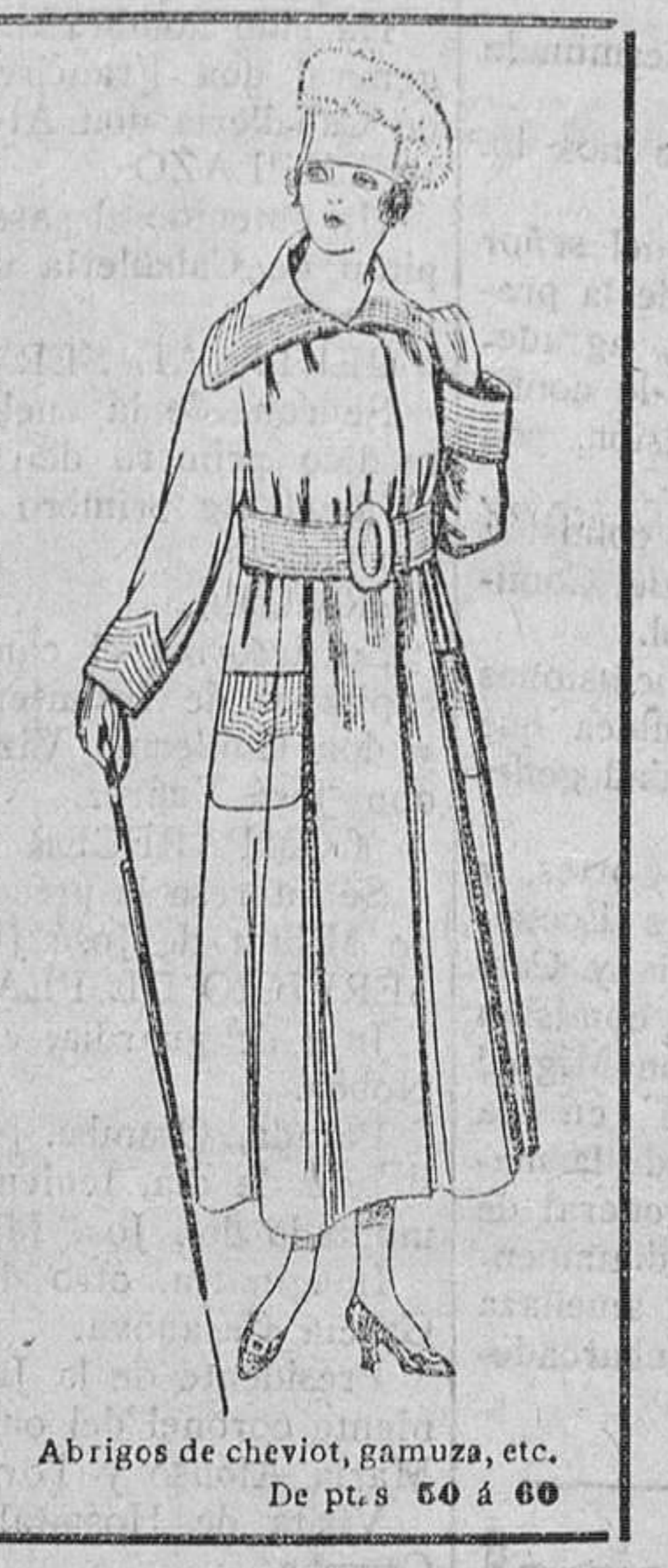
Abrigos de cheviot, gamuza, etc. De ptas. 60 á 60.