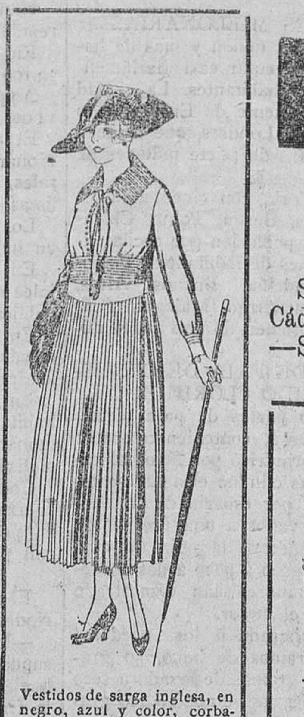
Vestidos de sarga inglesa, en negro, azul y color, corbata de punto. De ptas. 78 á 85.