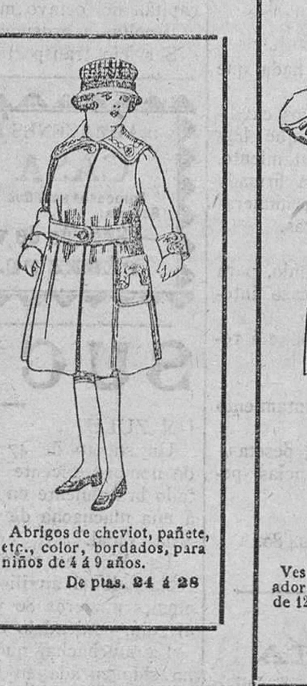
Abrigos de cheviot, pañete, etc., color, bordados, para niños de 4 á 9 años. De ptas. 84 á 28.