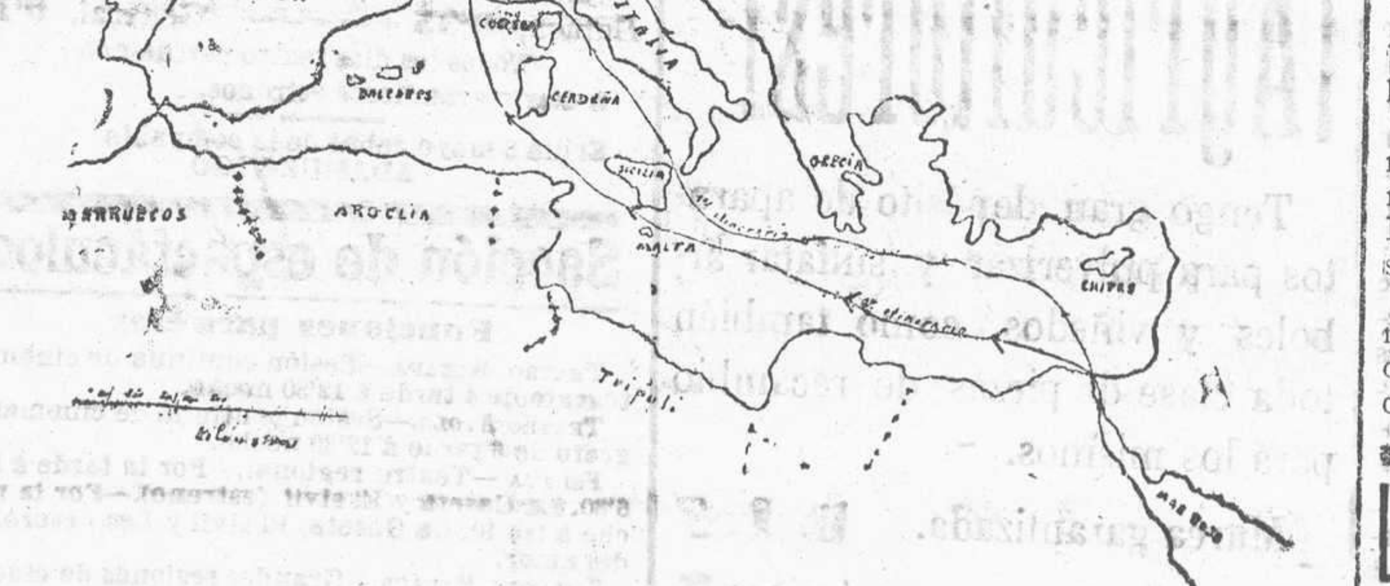
CROQUIS NÚMERO 2

Pese a los fantásticos relatos de una travesía de dos meses, detallada hasta lo inverosímil por algunos periódicos, travesía que suponen por el Cabo de las Tormentas, yo creí, y sigo en mi testarudez creyendo, que la ruta seguida por los transportes fue la del Canal de Suez. ¿Razones? Allá van. Estoy convencido de que los aliados han ido a la atrevida empresa directamente, sin rodear por el Cabo, que llevaría aparejada una confesión de impotencia marítima por parte de Francia, Inglaterra e Italia. Sigo en mi trece con la idea de que, a favor de la costa de Egipto y por el Estrecho de Mesina, ha podido llegar la expedición a su destino, siguiendo la ruta de la tercera Cruzada de Felipe Augusto de Francia, ó que, calculando el itinerario del Rey San Luis en 1248, las quince añadas de 1916 pasaron al Sur de Cerdeña, bajo la protectora sombra de Bizerta, y en Marsella anclaron.