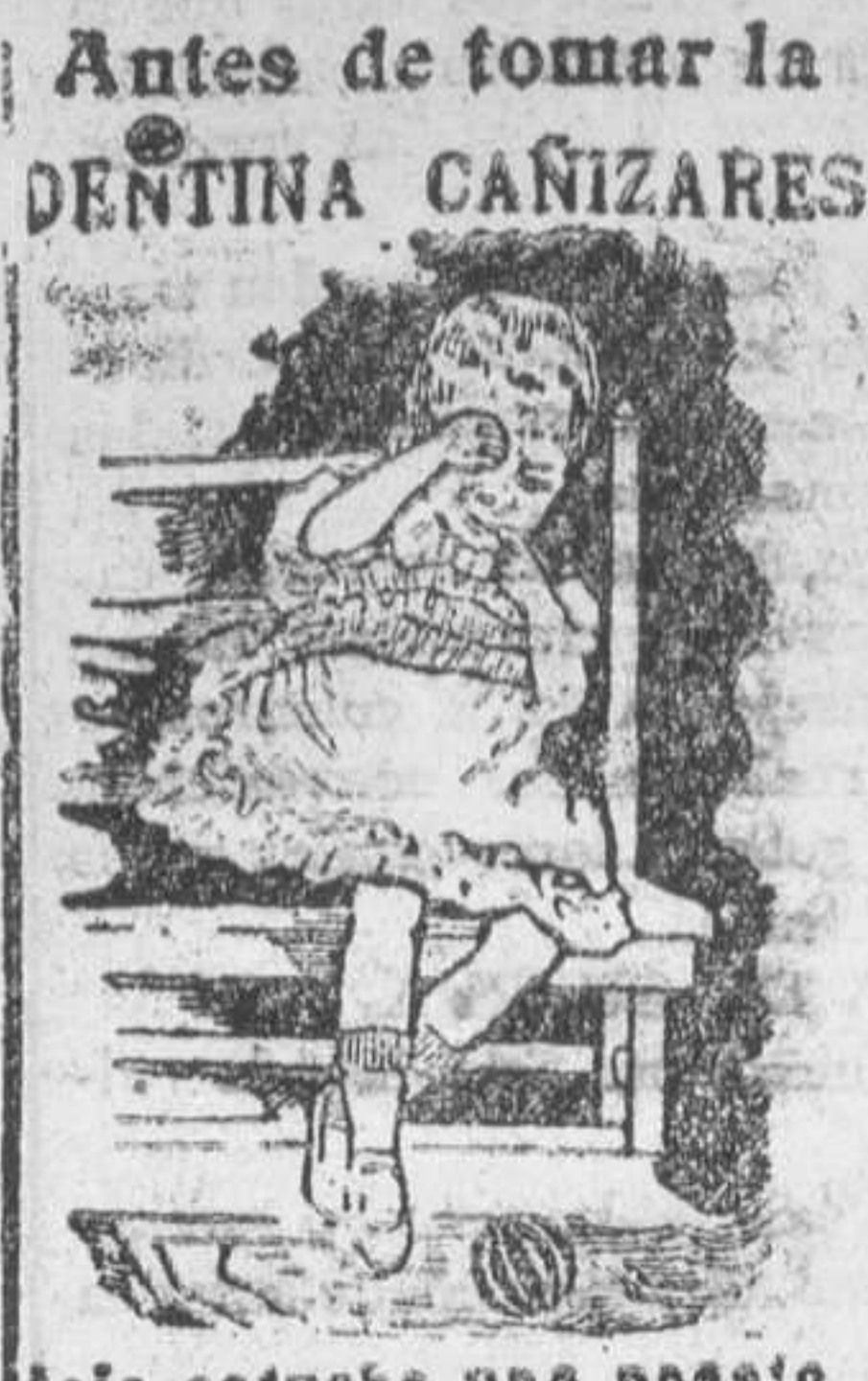
Caja-estuche una peseta

COACCIONES Los huelguistas han cometido coacciones en diferentes puntos de la ciudad. En la plaza de Cataluña fue desfilado un numeroso grupo que se dirigía con el propósito de que cesasen en el trabajo varias fábricas.