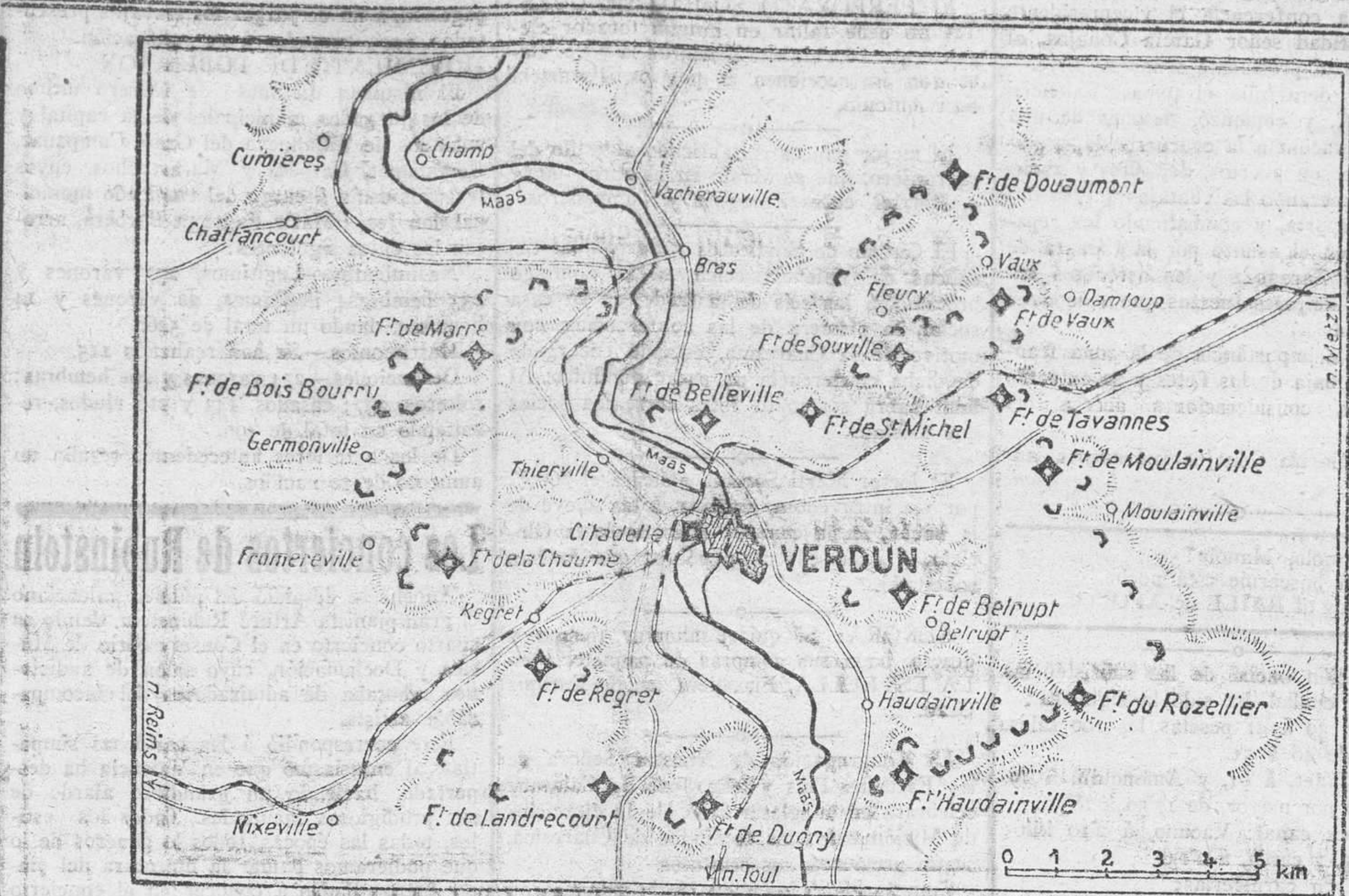
Campo atrincherado de Verdun

La vida del cristiano debe ser también laboriosa; es decir: el hombre debe trabajar, y por consiguiente con mayor razón el cristiano, a quien se supone convencido de la necesidad de cumplir los deberes del hombre.