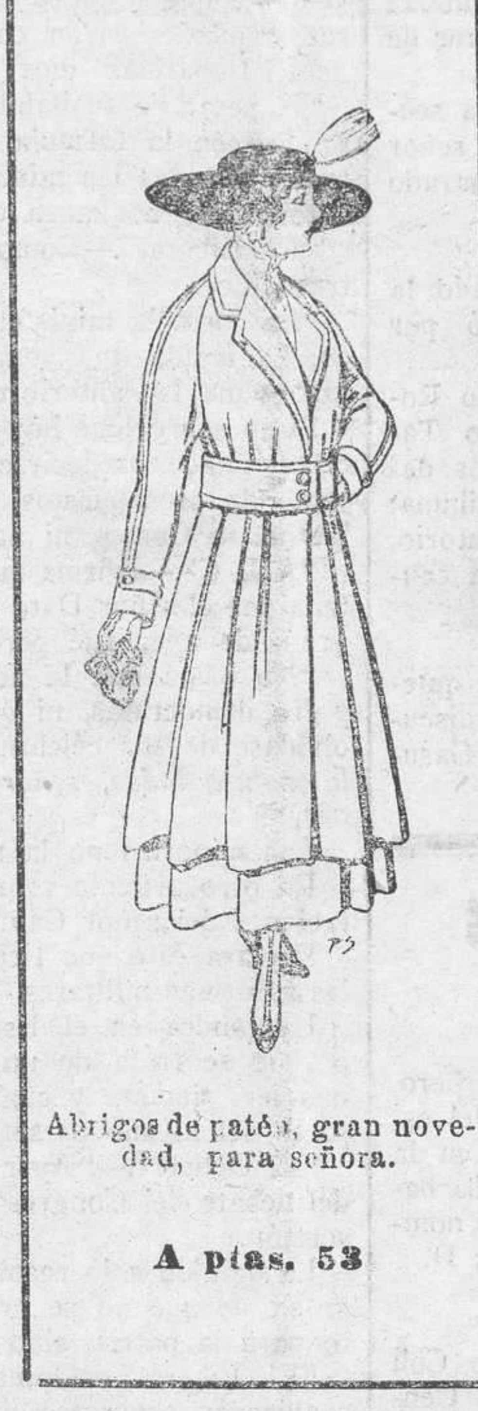
Abrigos de patén, gran novedad, para señora. A ptas. 53