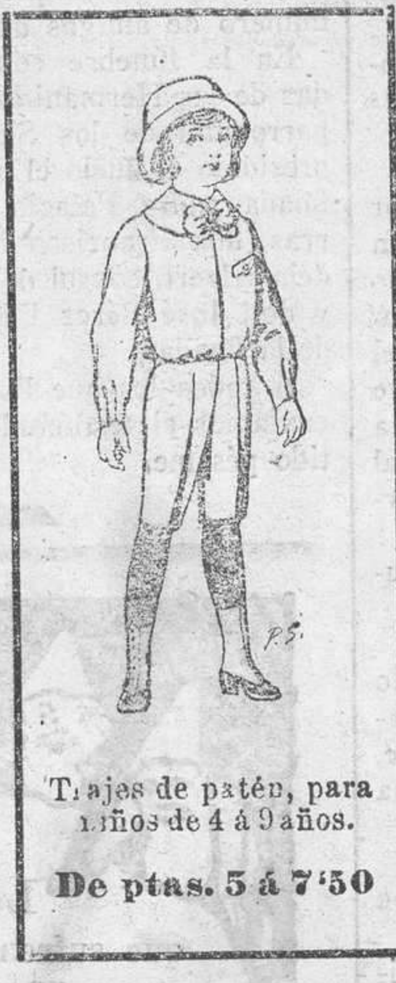
Trajes de patén, para niños de 4 a 9 años. De ptas. 5 a 7,50