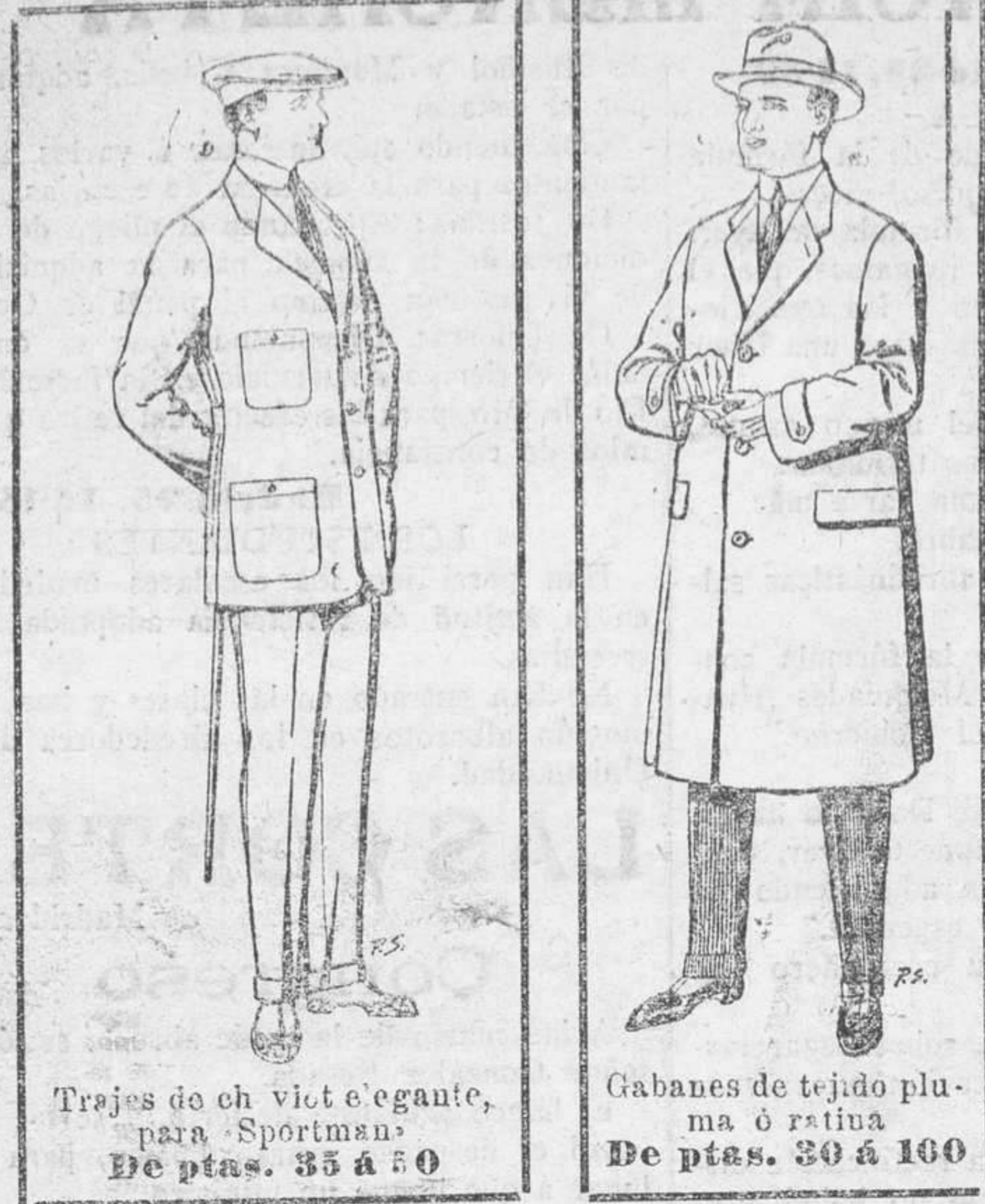
Trajes de ch. vict. elegante, para Sportmen. De ptas. 35 a 50