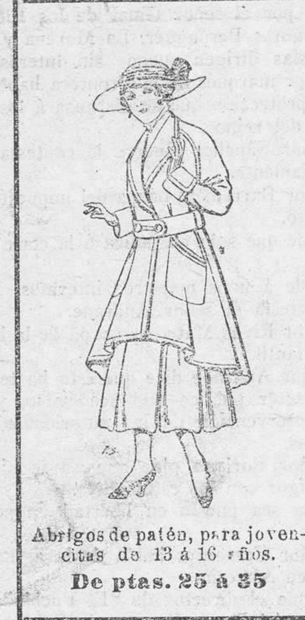
Abrigos de patén, para jovencitas de 13 a 16 años. De ptas. 25 a 35