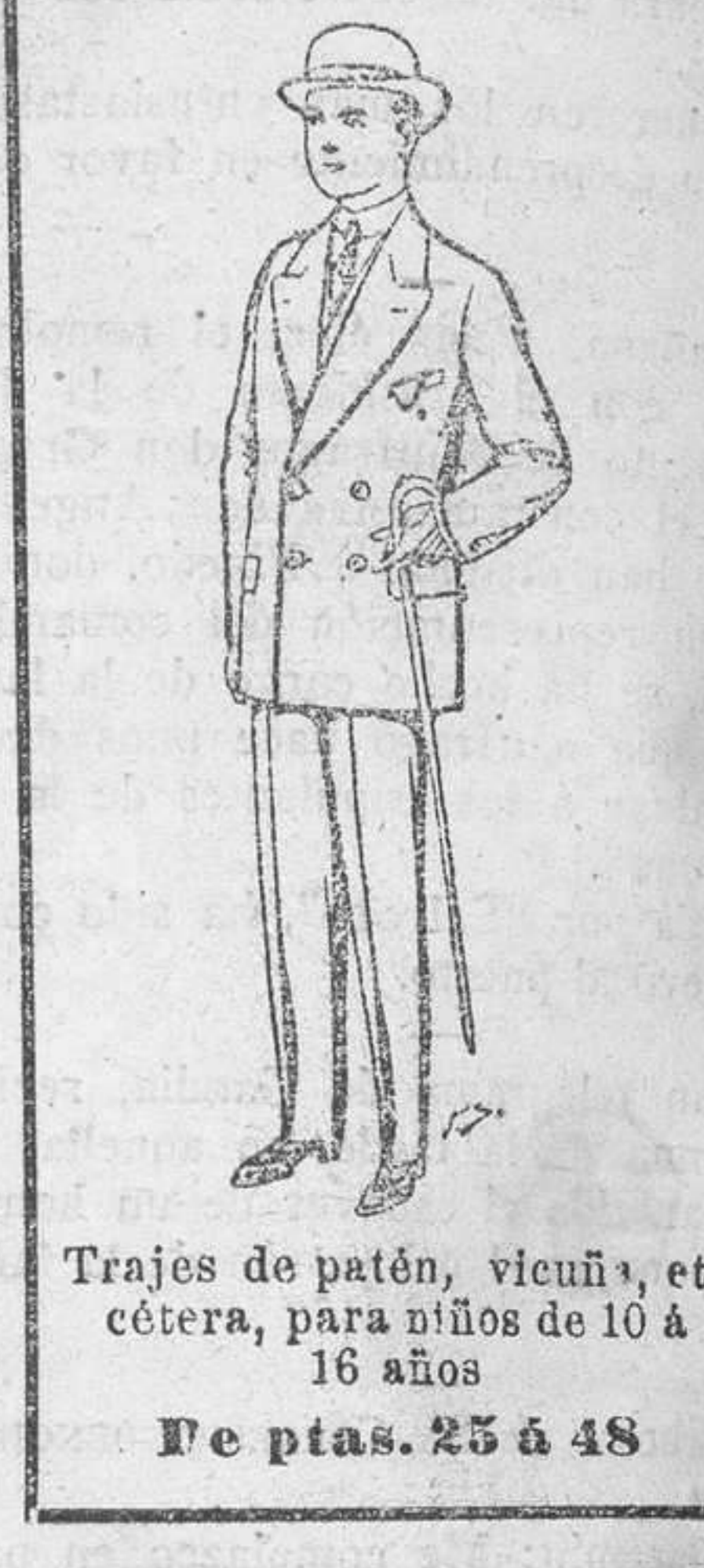
Trajes de patén, vicuña, etcótera, para niños de 10 a 16 años. De ptas. 25 a 48