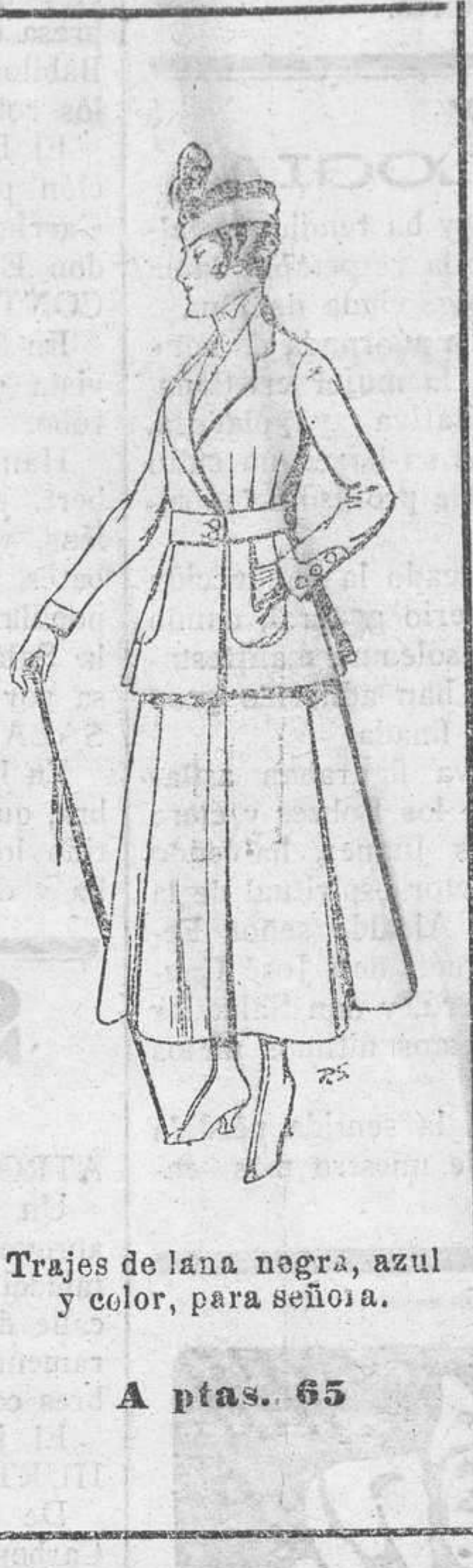
Trajes de lana negra, azul y color, para señora. A ptas. 65

Peletería, Camisería, Géneros de punto, Corbatería, Guantería, Sombrerería, Zapatería, Paraguas, Bastones y Artículos de viaje