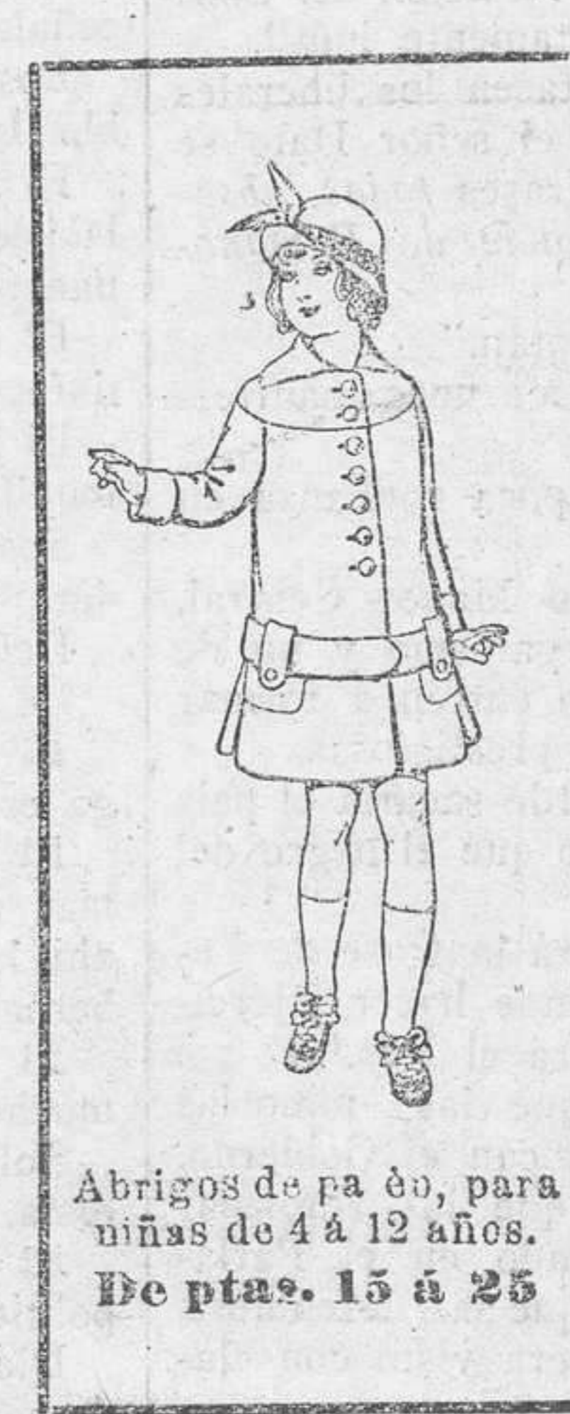
Abrigos de patén, para niñas de 4 a 12 años. De ptas. 15 a 25