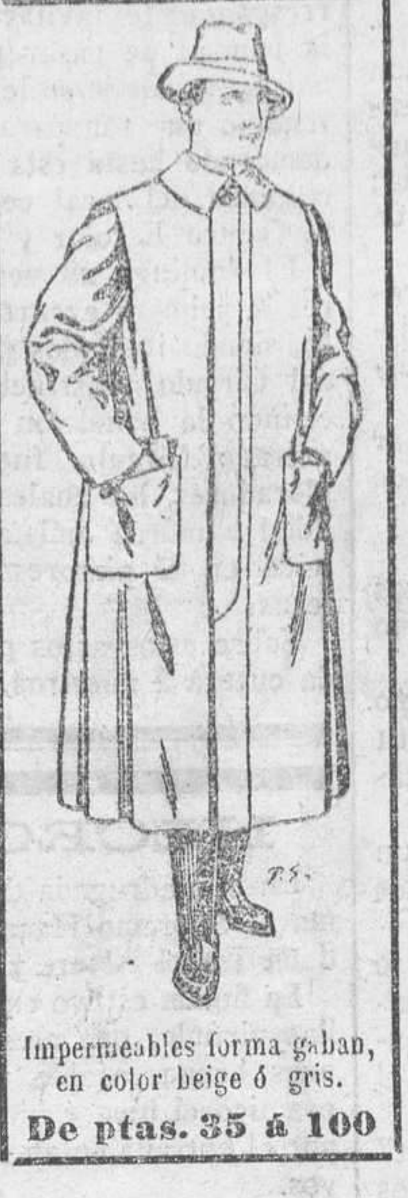
Impermeables forma gaban, en color beige ó gris. De ptas. 35 a 100