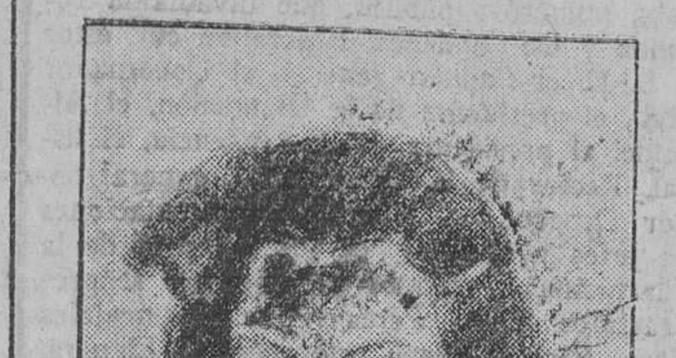
Estudio de retrato—Verde

—¡Voto á brios!—exclamó el jefe.—¿Está usted herido? A ver, que avisen al médico. —Esto no es nada, mi coronel; con agua fresca se cura en seguida. Al día siguiente, en el orden del regimiento, hizo el coronel cumplida justicia al teniente Cañizares, y le invitó á sentarse a su mesa la noche siguiente.