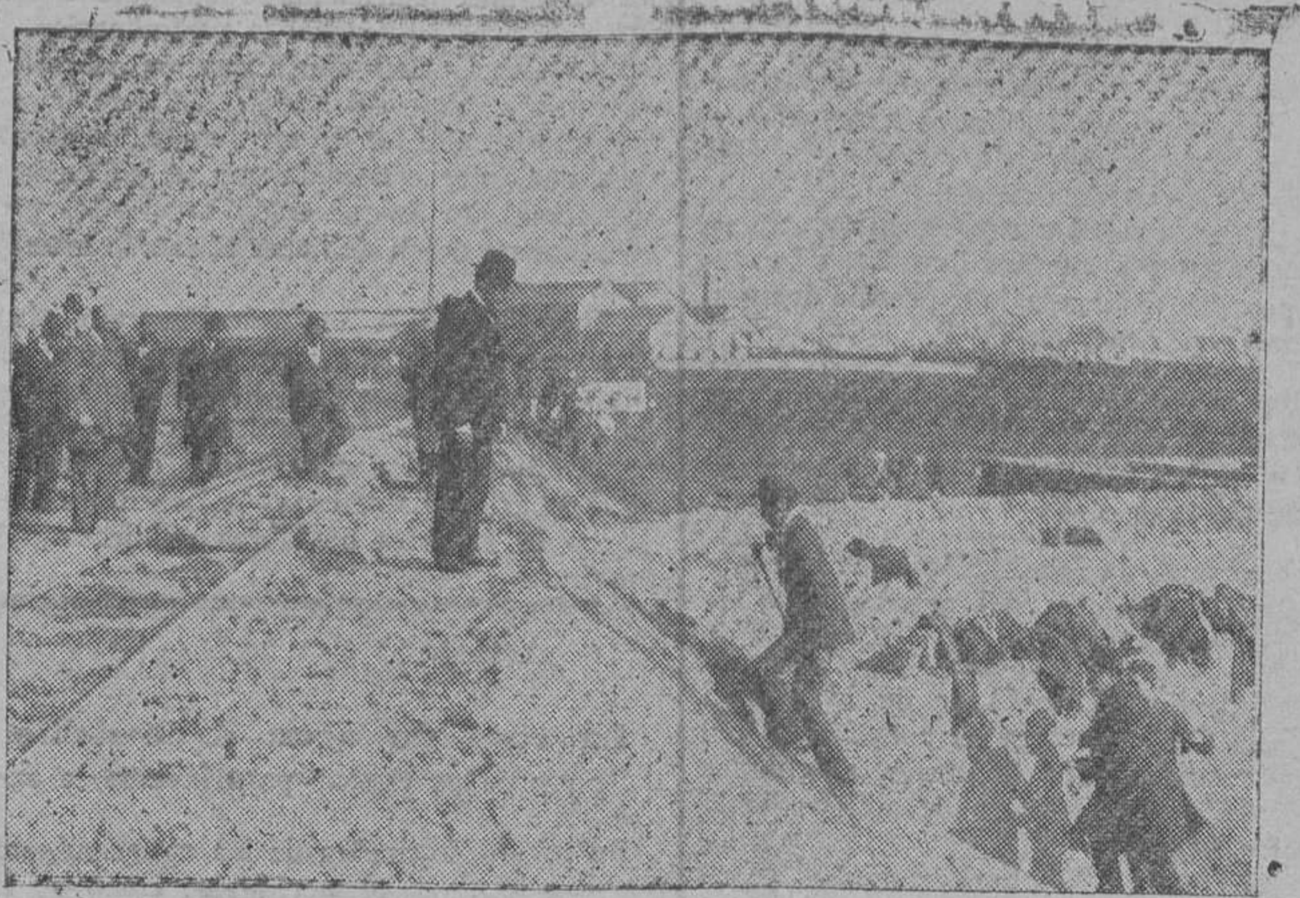
El Rey subiendo un terraplen