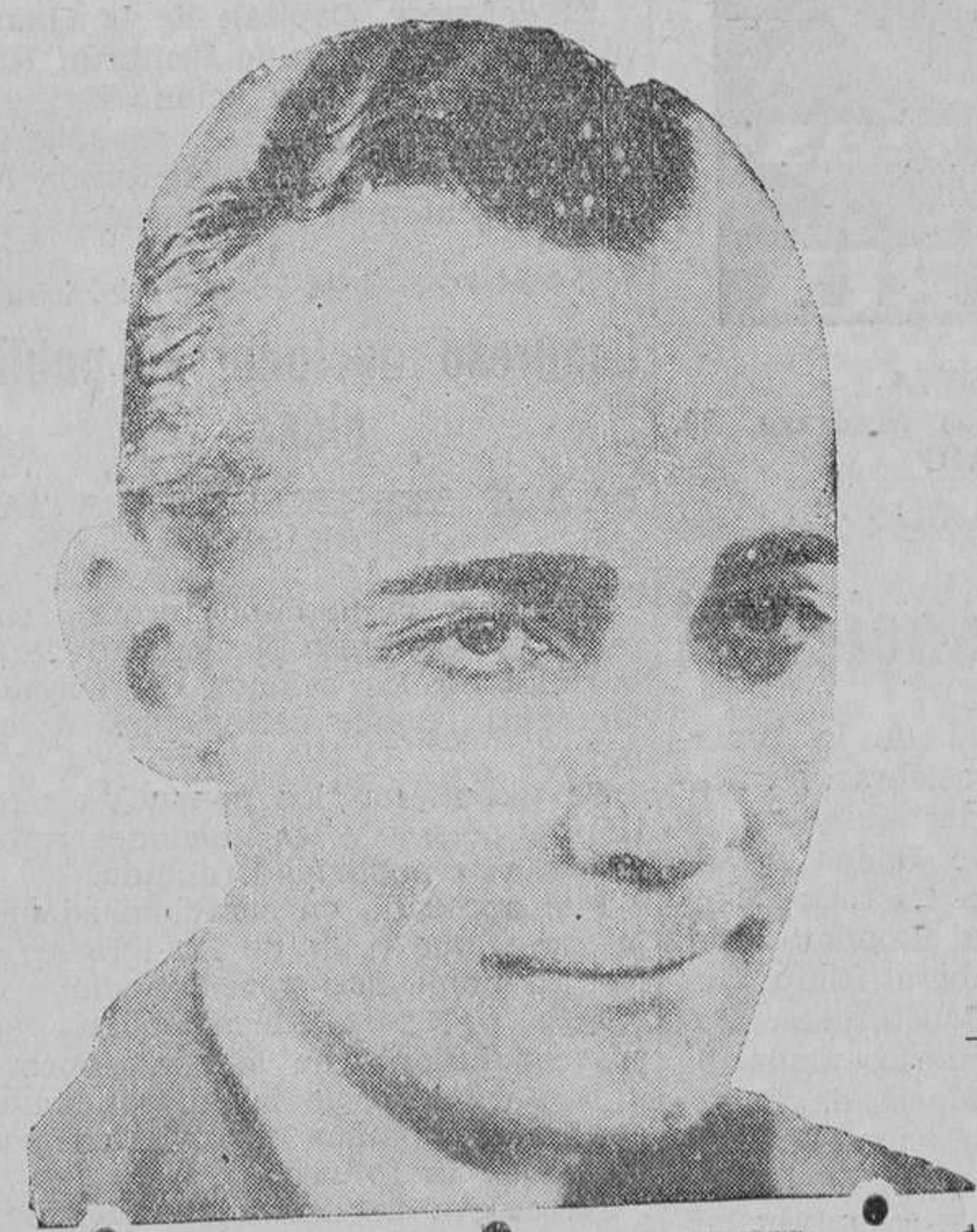
He aquí a Carlos Díaz de Mendoza, el nuevo "astro" español del cine.

Carmen Larrabeiti, en un formidable primer plano. (Fot. Paramount).