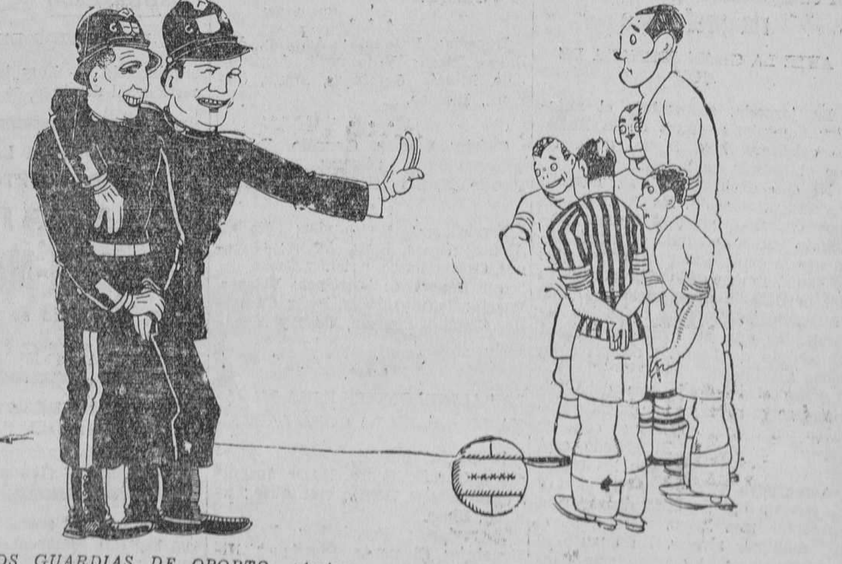
LOS GUARDIAS DE OPORTO.—[Amigos... por aquí no se puede pasar!]