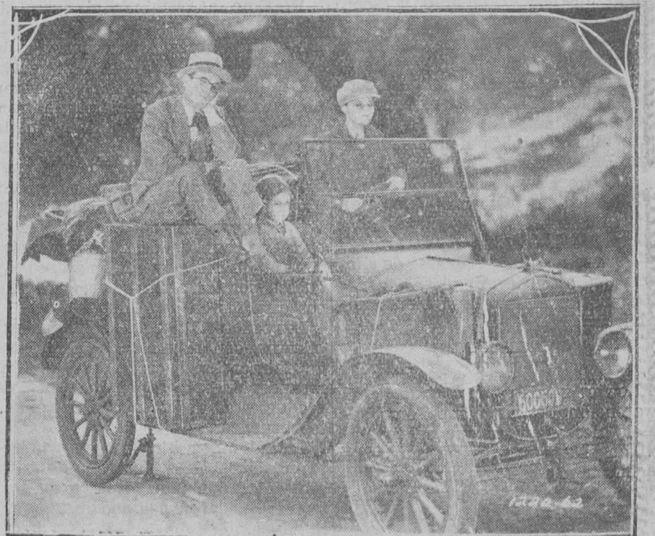
Un hilarante momento de "¿Qué fenómeno?" protagonizado por Harold Lloyd, que se estrenará próximamente en Rialto.