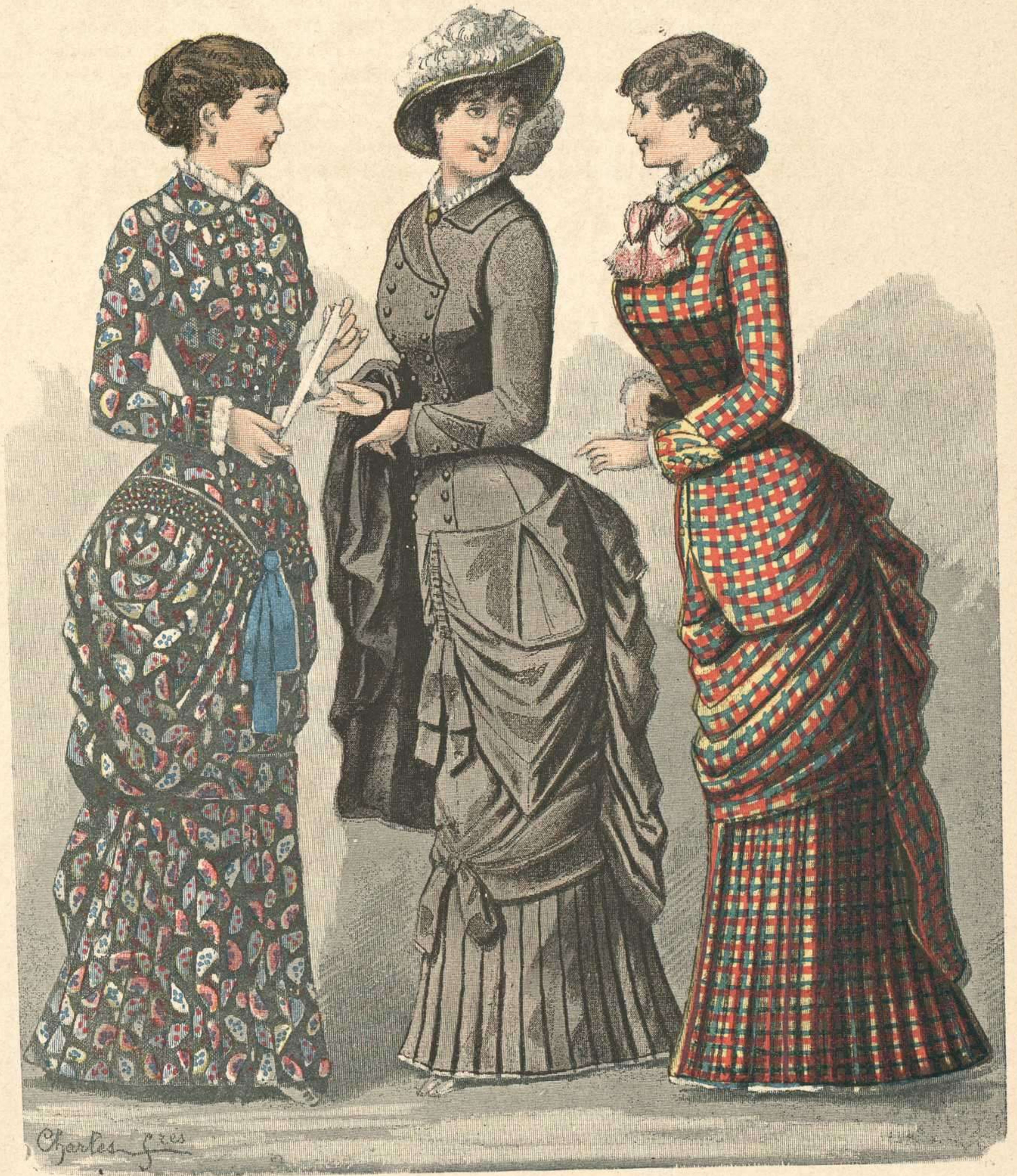
233. Vestido Pompadour. — 234. Vestido liso. — 235. Vestido á cuadros.