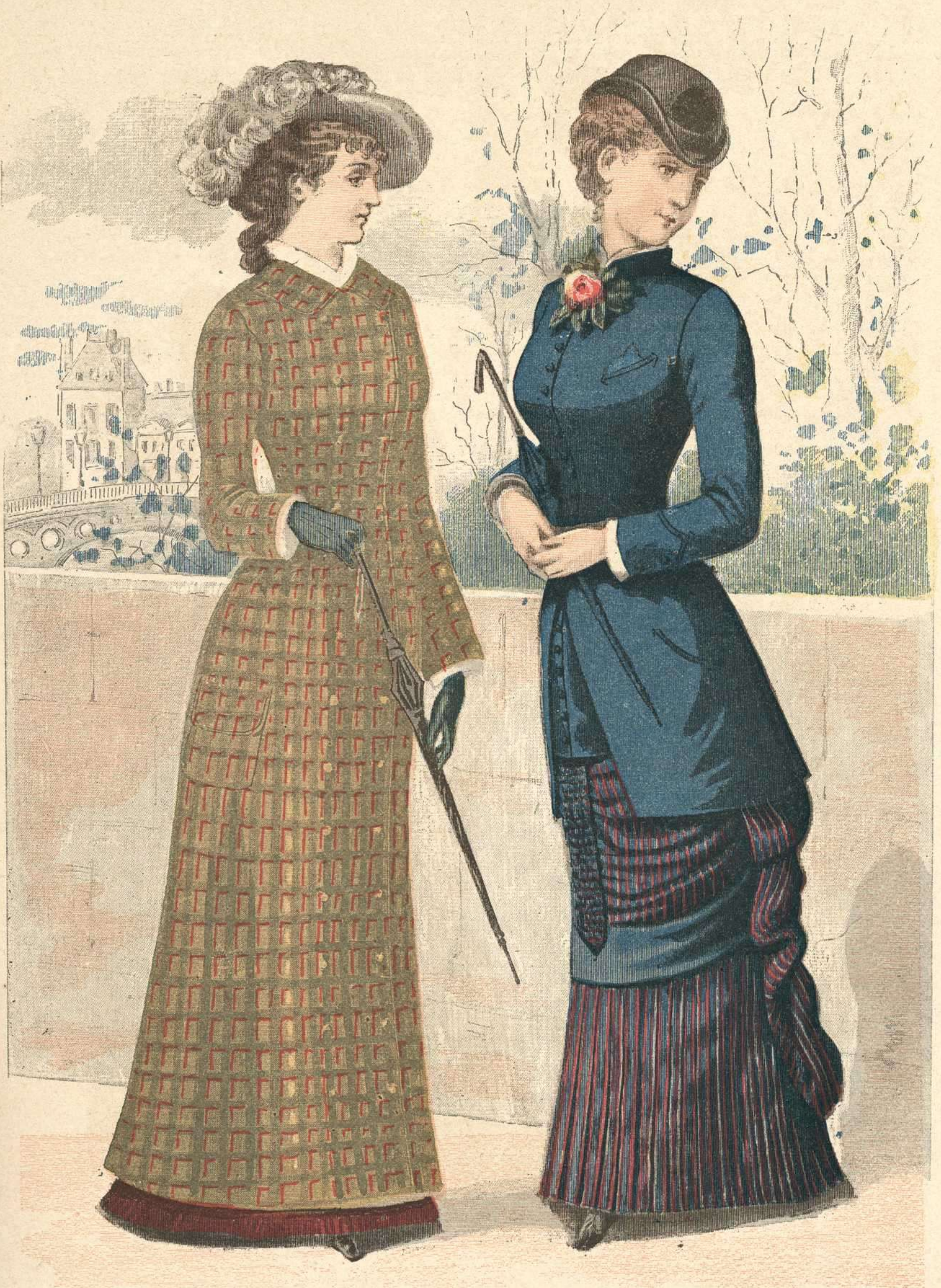
223. Ropon matinal. — 224. Chaquetilla para señorita.