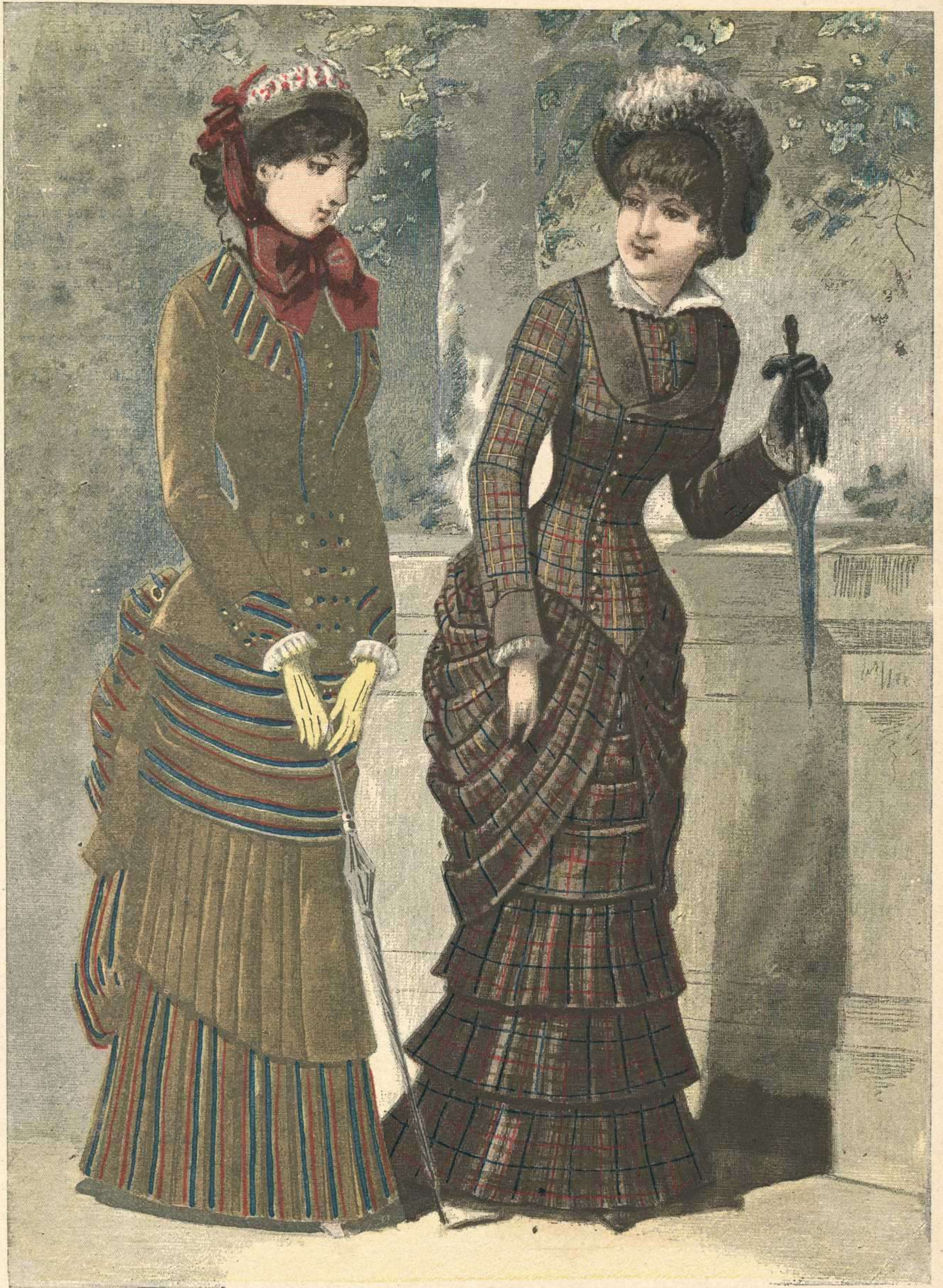
225. Vestido para pasco á listados. — 226. Vestido para pasco á cuadros.