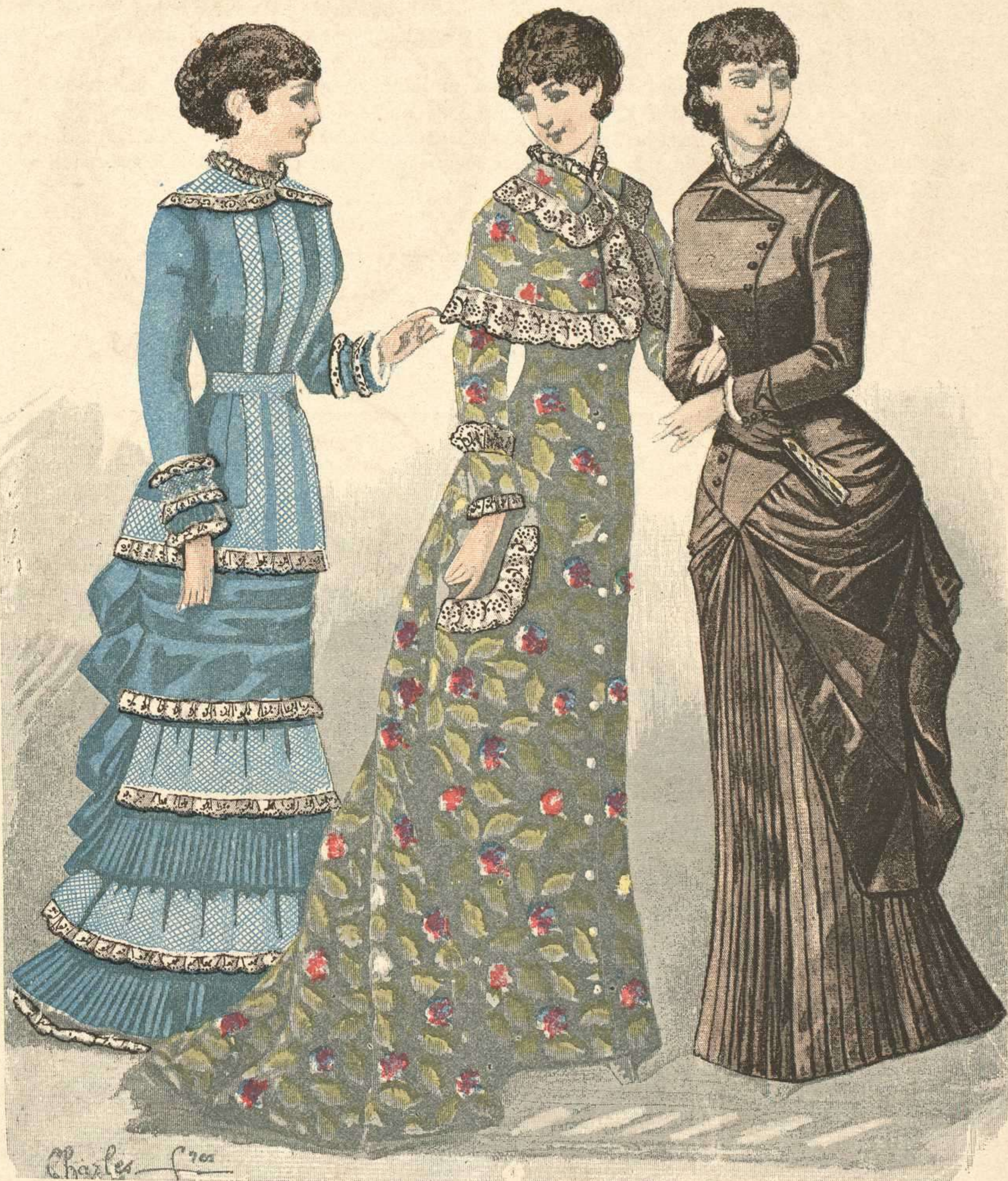
220. Vestido de céfiro. — 221. Peinador de porcal. — 222. Vestido de cachemira.