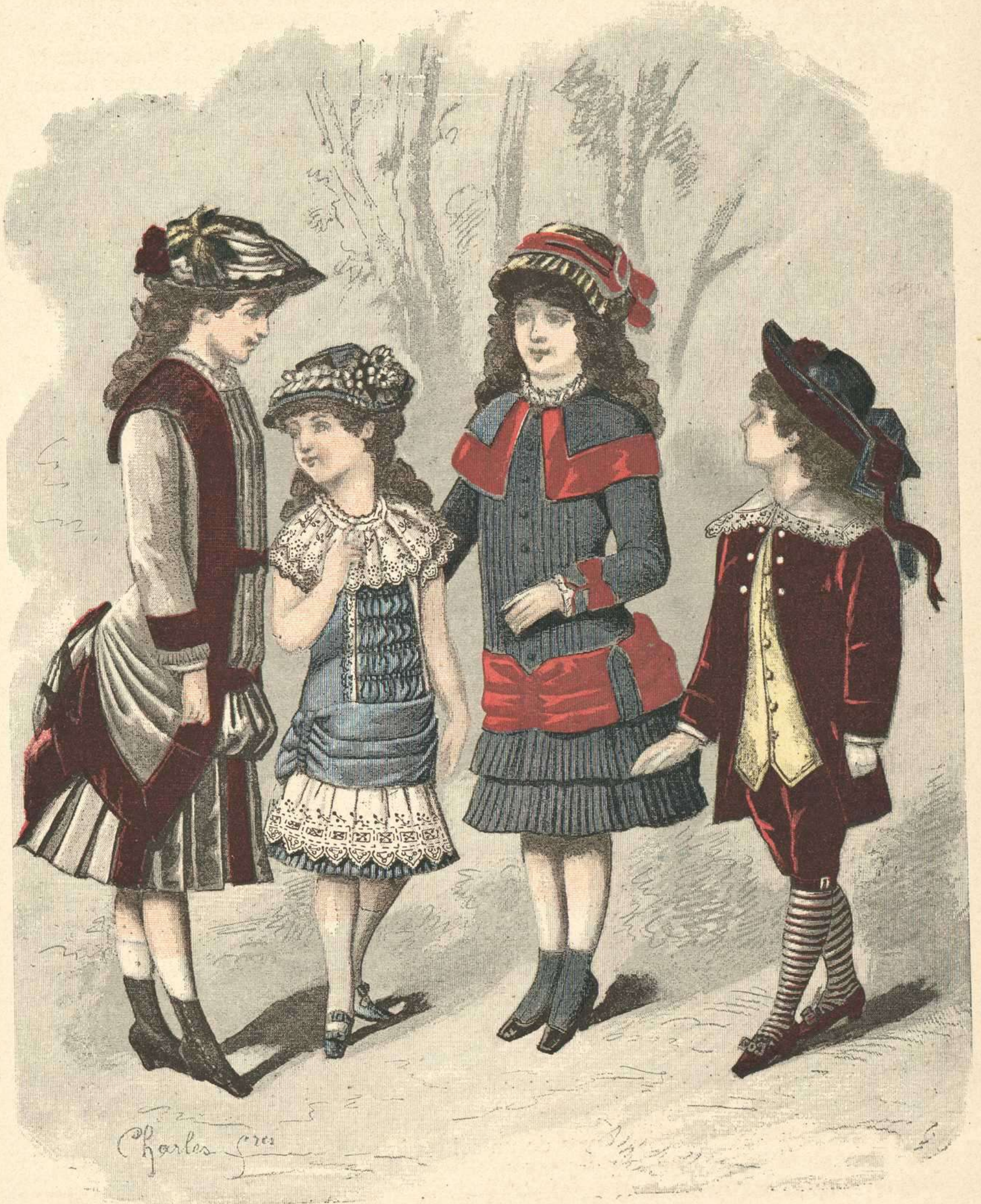
210, 211, 212. Viñita de 5 á 10 años. — 213. Jovencita.