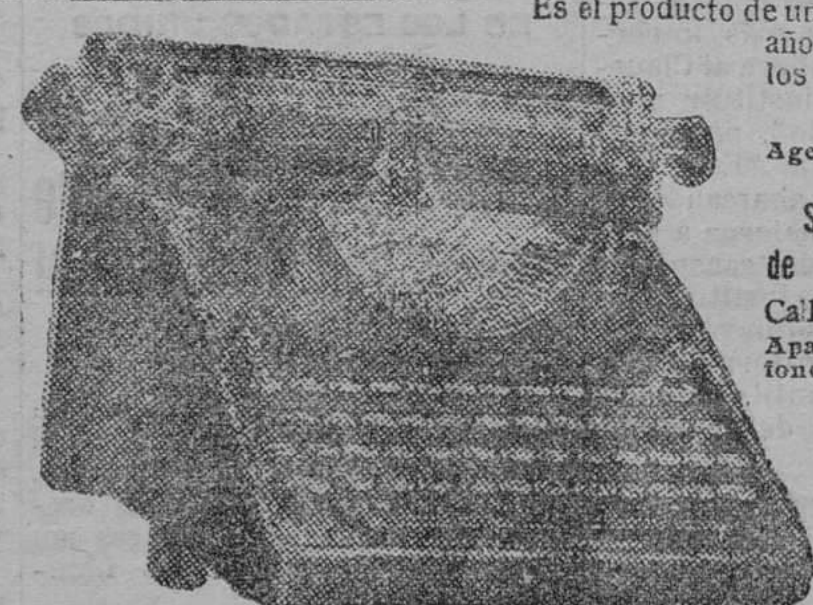
La máquina inglesa.