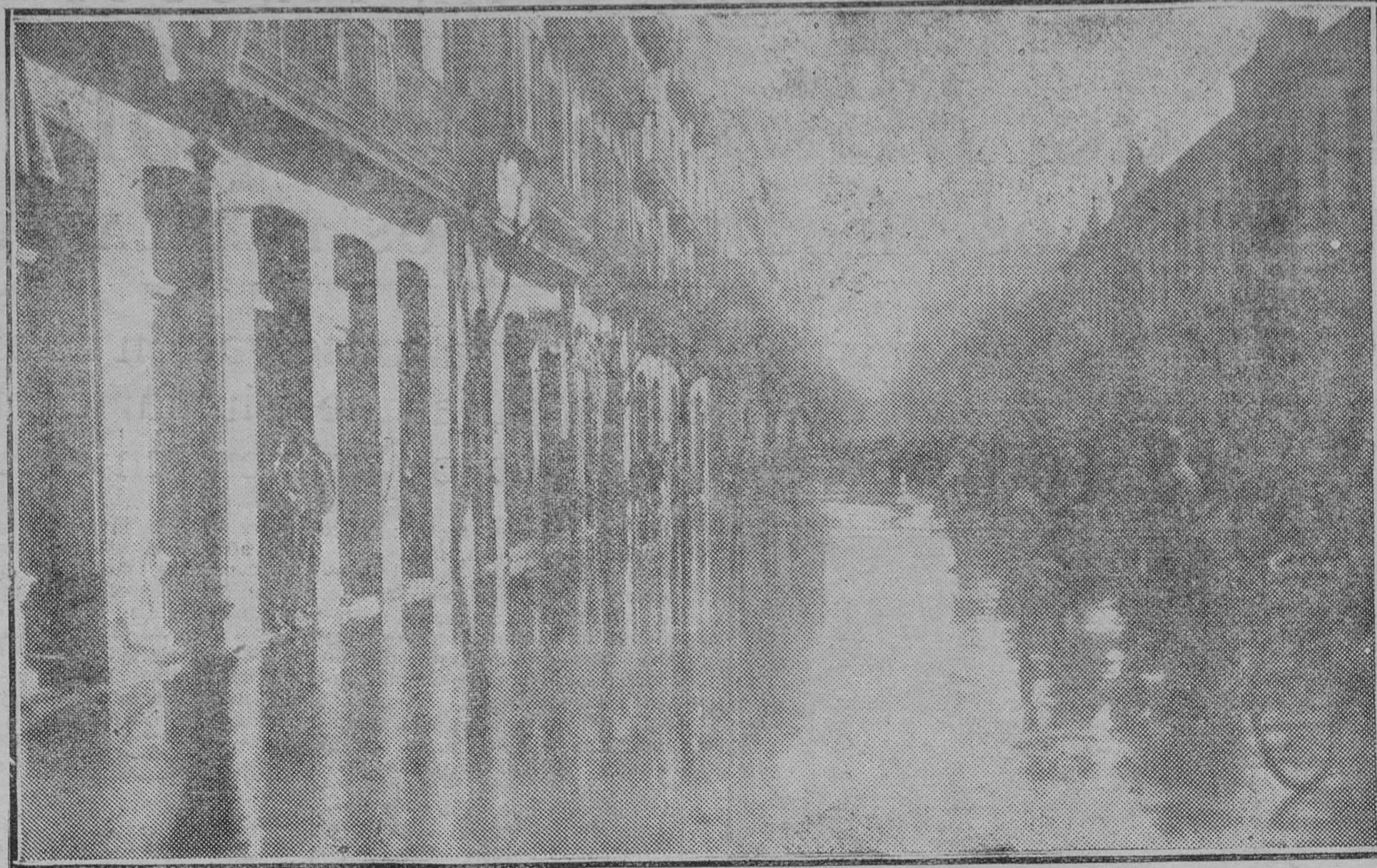
FURIOSO TEMPORAL EN SAN SEBASTIAN Aspecto de la calle Aldama a raíz de la inundación producida por el oleaje.

Que a otro cualquier equipo le sucediera este descenso, lo hallaríamos explicado; pero que sean los atléticos, que siempre tuvieron reservas abundantes y que además trajeron un entrenador llegado con la aureola de gran competencia, quienes tan bruscamente se les vea quedar al margen del campeonato, por pérdida de una técnica que ese mismo preparador debía haber acrecentado, lo hallamos incomprensible. Tal vez no sean definitivas estas situaciones que tan difícilmente colocan al Athletic; pero, o muy de prisa llega el mejoramiento, o verán esfumarse esperanzas de legítimas victorias. Confesemos a este respecto que sin títulos especiales, del grupo ex campeón del Centro de hace nada más que