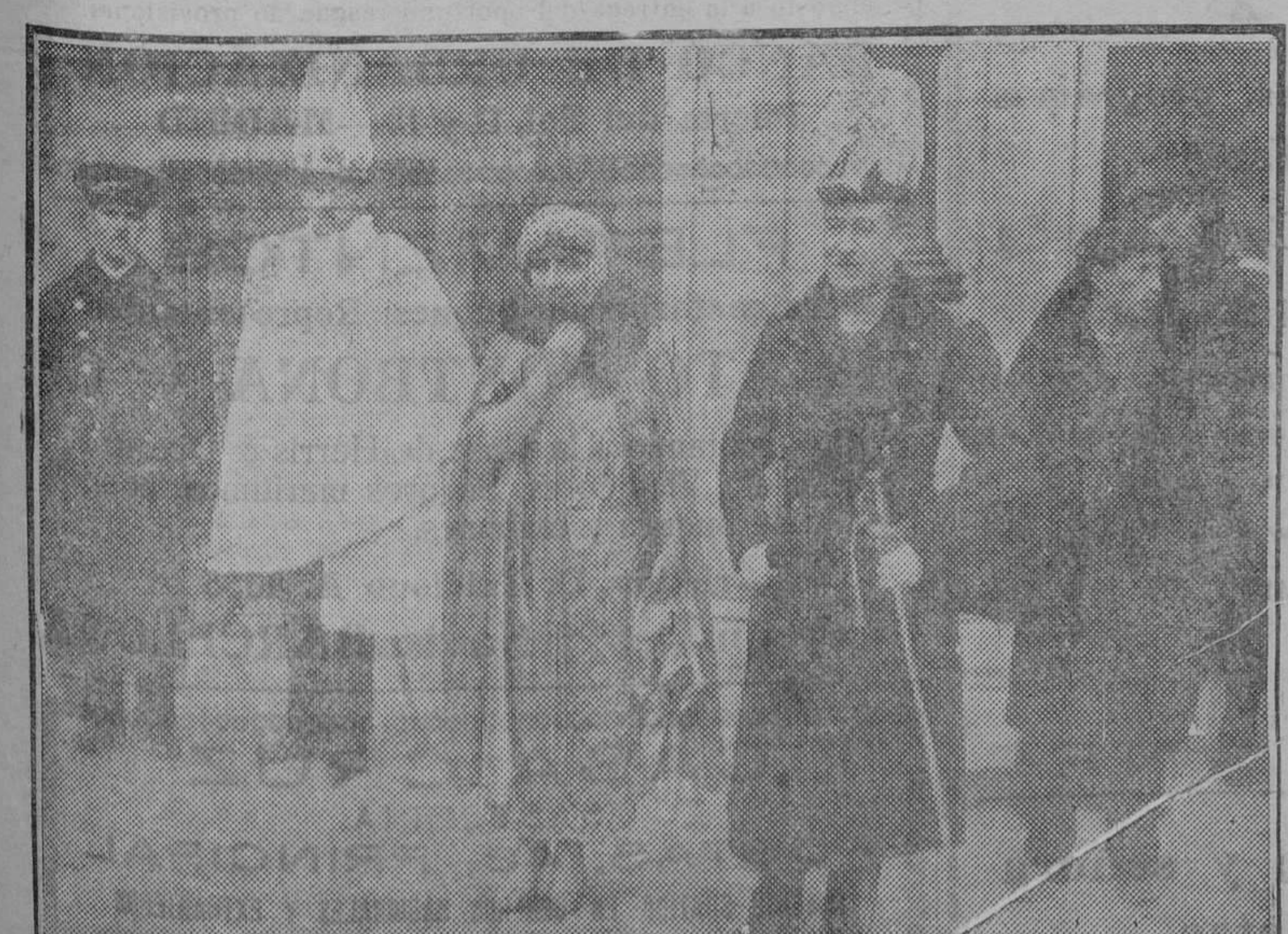
Grandes de España saliendo de la capilla pública de Palacio.

Los pagos se harán al contado contra entrega de documentos como se hacía antes de la guerra. Radio.