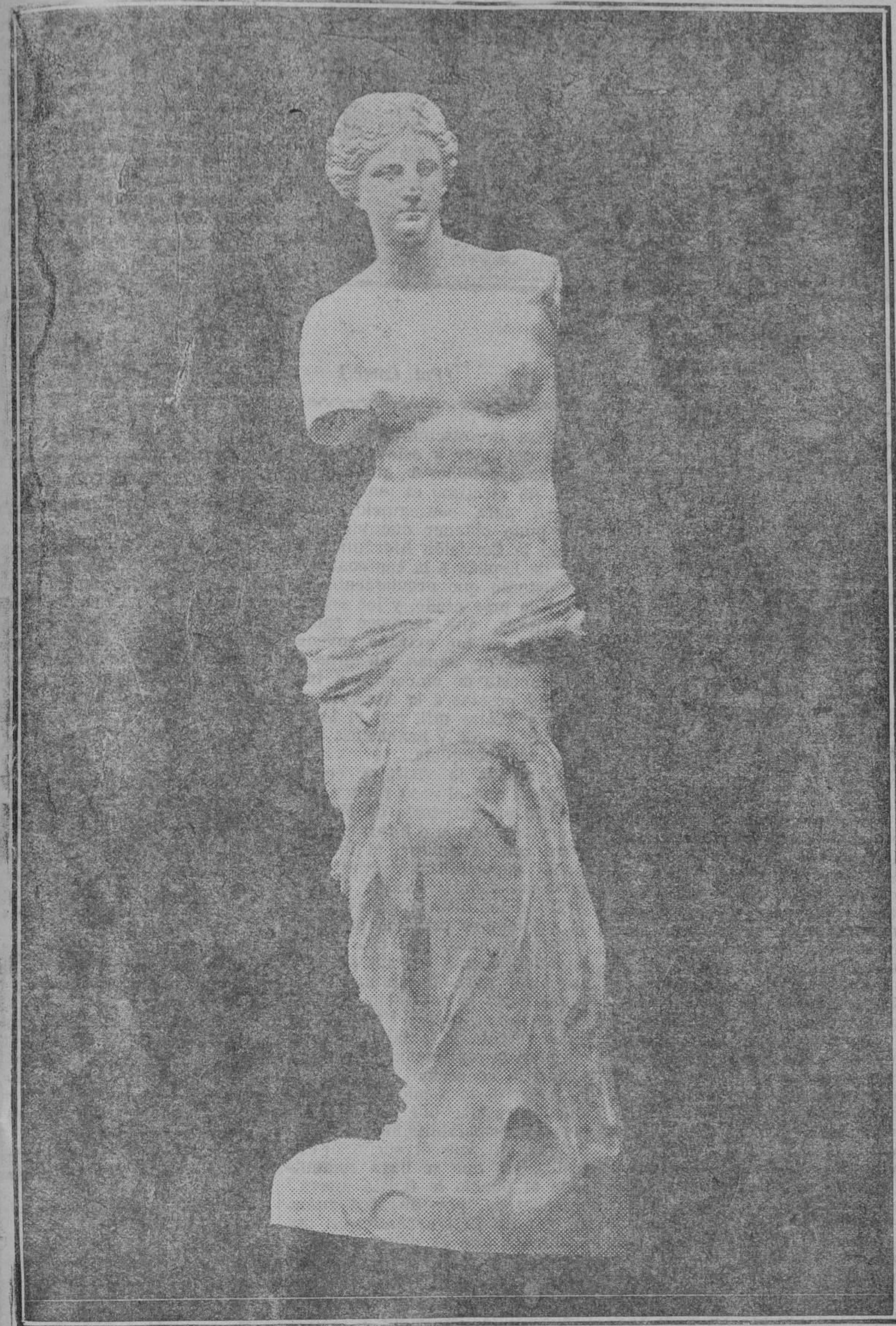
Venus de Milo, famosa escultura existente en el Museo del Louvre.

Algunas curiosidades sobre la historia, la vida y la conservación de ambas obras de arte.-Lo que se dice que han sido, lo que son y lo que serían de triunfar ciertas tendencias artísticas de nuestro tiempo.-El "Nuevo Régimen" en el Arte