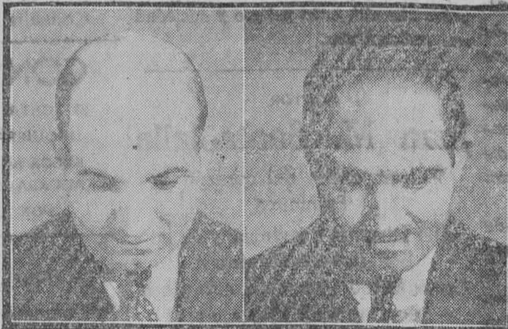
Calvo 17 años 8 meses curado

Pelicula sensacional científica, de 3.800 metros con el fin de demostrar prácticamente a los incrédulos sus maravillosas curas después de llevar treinta años de calvicie; esta película se proyectará próximamente en Alicante y toda la provincia. 2.700 enfermos de todas clases de calvicie dejados por incurables, curados gratuitamente y a mitad de su precio, para propaganda de esta maravillosa cura.