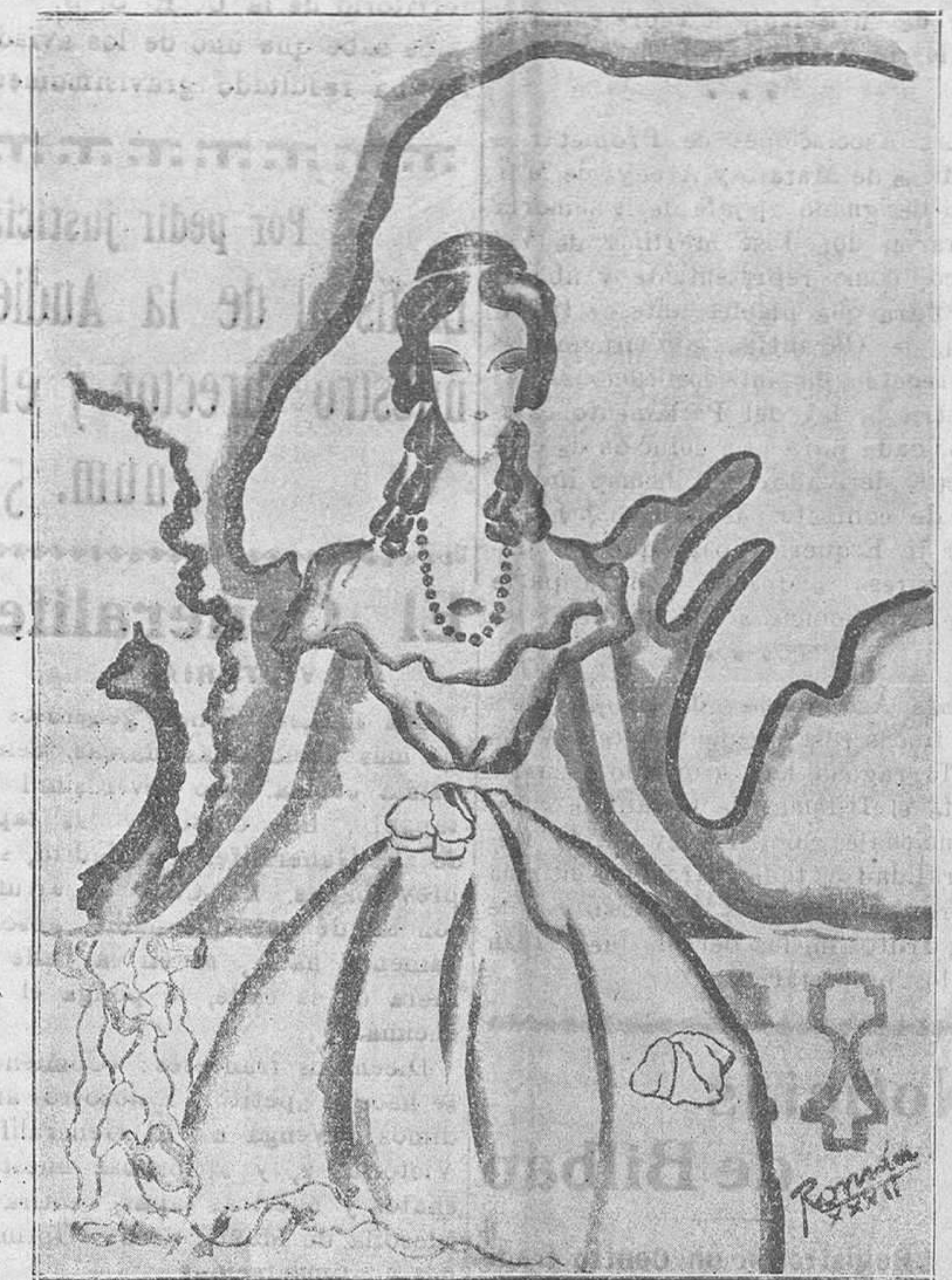
—¡Flor pálida de los jardines del romanticismo...! ¡Uf, los poetas...!

El embajador Mr. Welles y familia, con otros residentes norteamericanos, se han trasladado del Hotel Nacional a otro hotel de La Habana. Welles continuará de embajador. Como consecuencia de la paralización de los negocios en algunas regiones cubanas y de los desórdenes en otras, el embajador de los Estados Unidos en La Habana, nombrado recientemente secretario de Estado adjunto, continuará indefinidamente al frente de la Embajada norteamericana. El embajador Mr. Welles y familia, con otros residentes norteamericanos, se han trasladado del Hotel Nacional a otro hotel de La Habana. La situación sigue estacionaria. A pesar de la formación de un Gobierno integrado por personalidades, individualmente muy estimables, no se ha operado ninguna reacción favorable sensible entre las clases directoras del país. Temiendo ser acusados de anti-