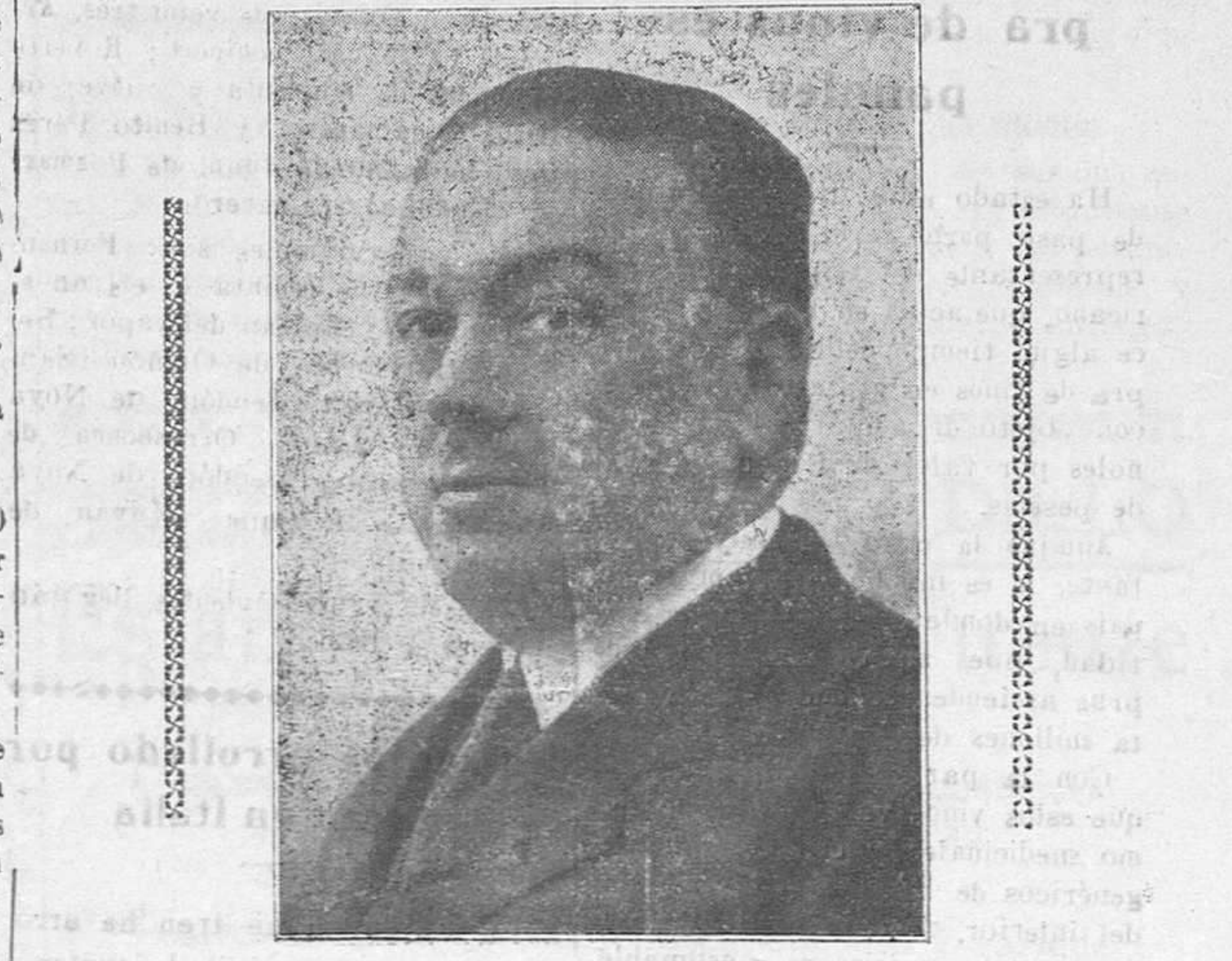
El excelentísimo señor don Diego Martínez Barrios, actual ministro de la Gobernación. IZQUIERDA, ha ya tiempo, y hallándose en la oposición este prohombre radical, hizo un elogio del señor Martínez Barrios. Hoy, con tanta satisfacción como antes, lo rubricamos de nuevo.