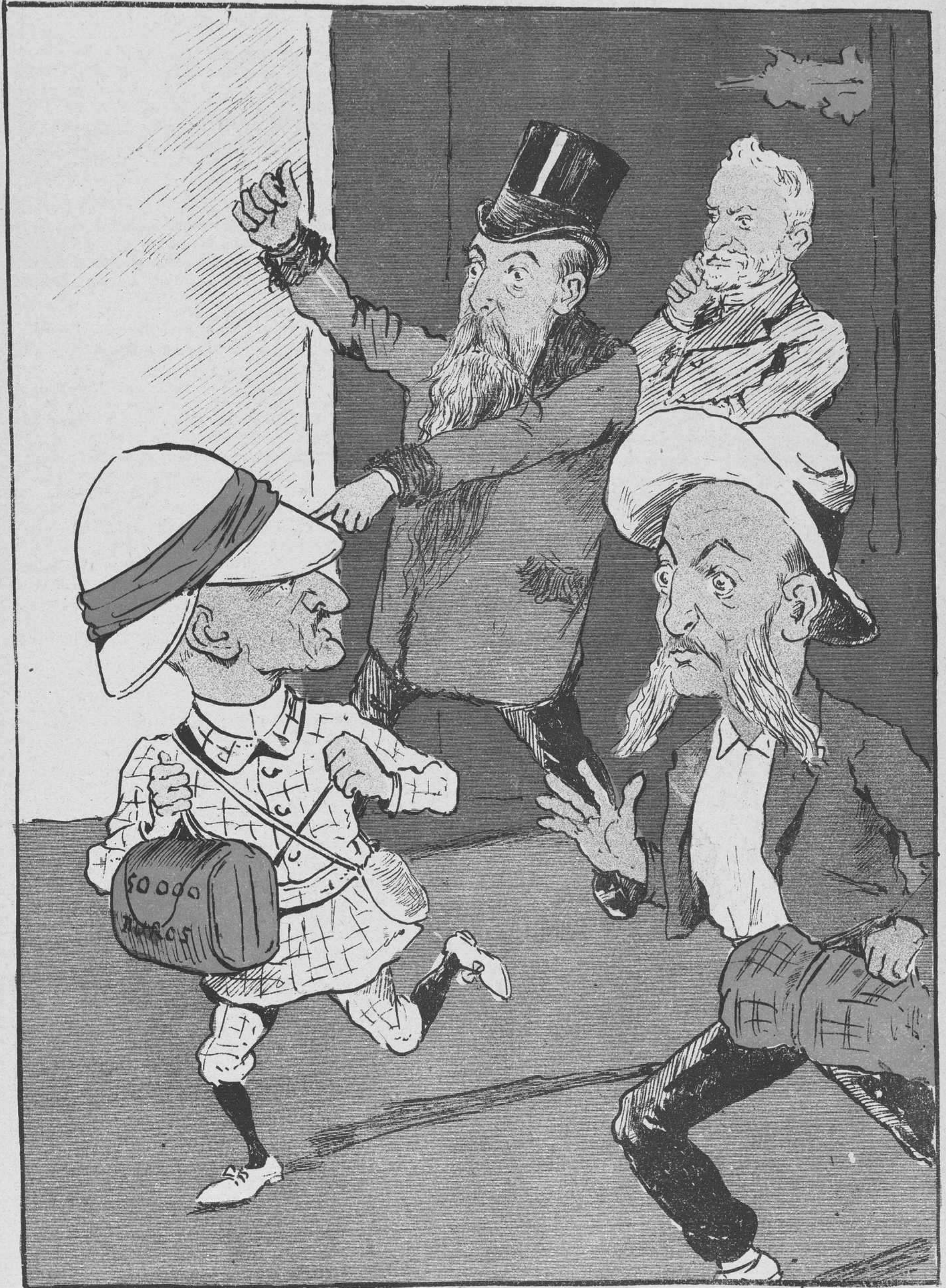
Llegué, vi.. y no vinei. ¡Paciencia para encomendarse á San Fernando, dueño del cotarro