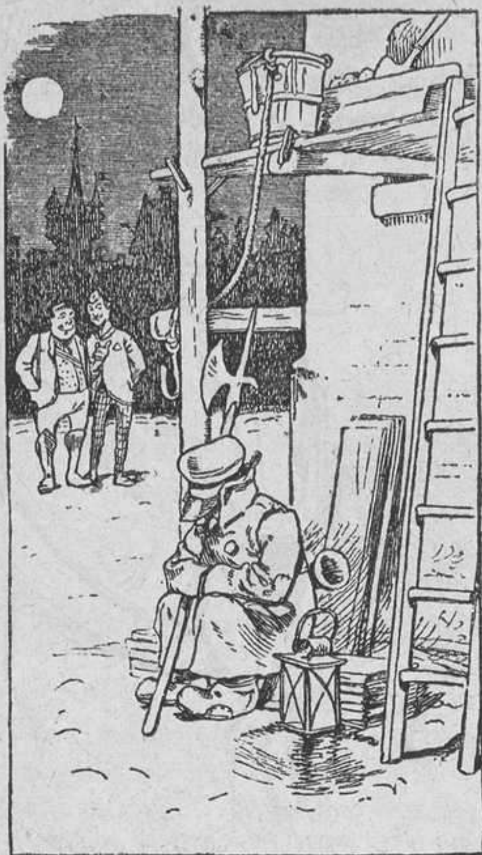
El vigilante se aploma durmiendo muy confiado, y dos chuscos con cuidado le preparan una broma.