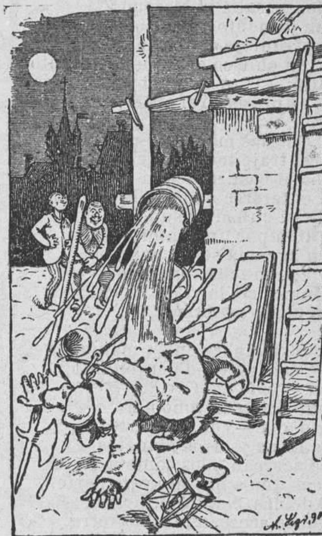
Y al punto que él decidido acerca su mano izquierda al farol, sigue la cuerda, el cubo y su contenido.