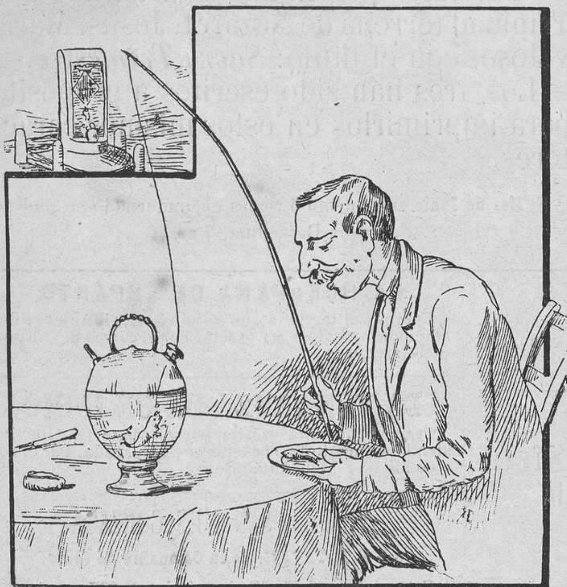
Loemos las invenciones que el siglo en su avance lleva: manera de pescar nueva sin tomar insolaciones.