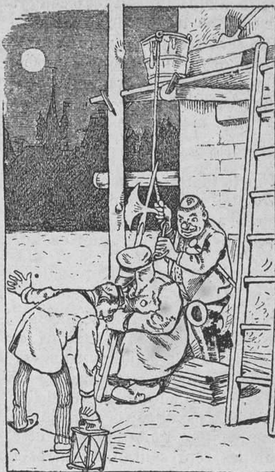
Uno, aguantando el resuello, separa el farol; el otro, para ponerle en un potro, le sujeta por el cuello.