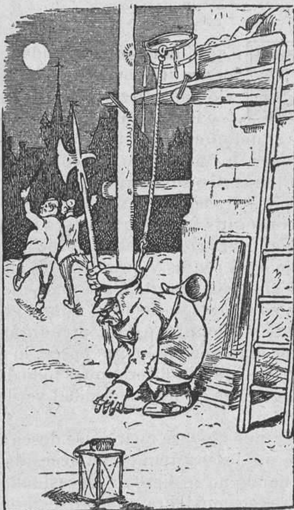
Satisfechos de su hazaña, del vigilante se alejan riendo, porque le dejan en situación tan extraña.