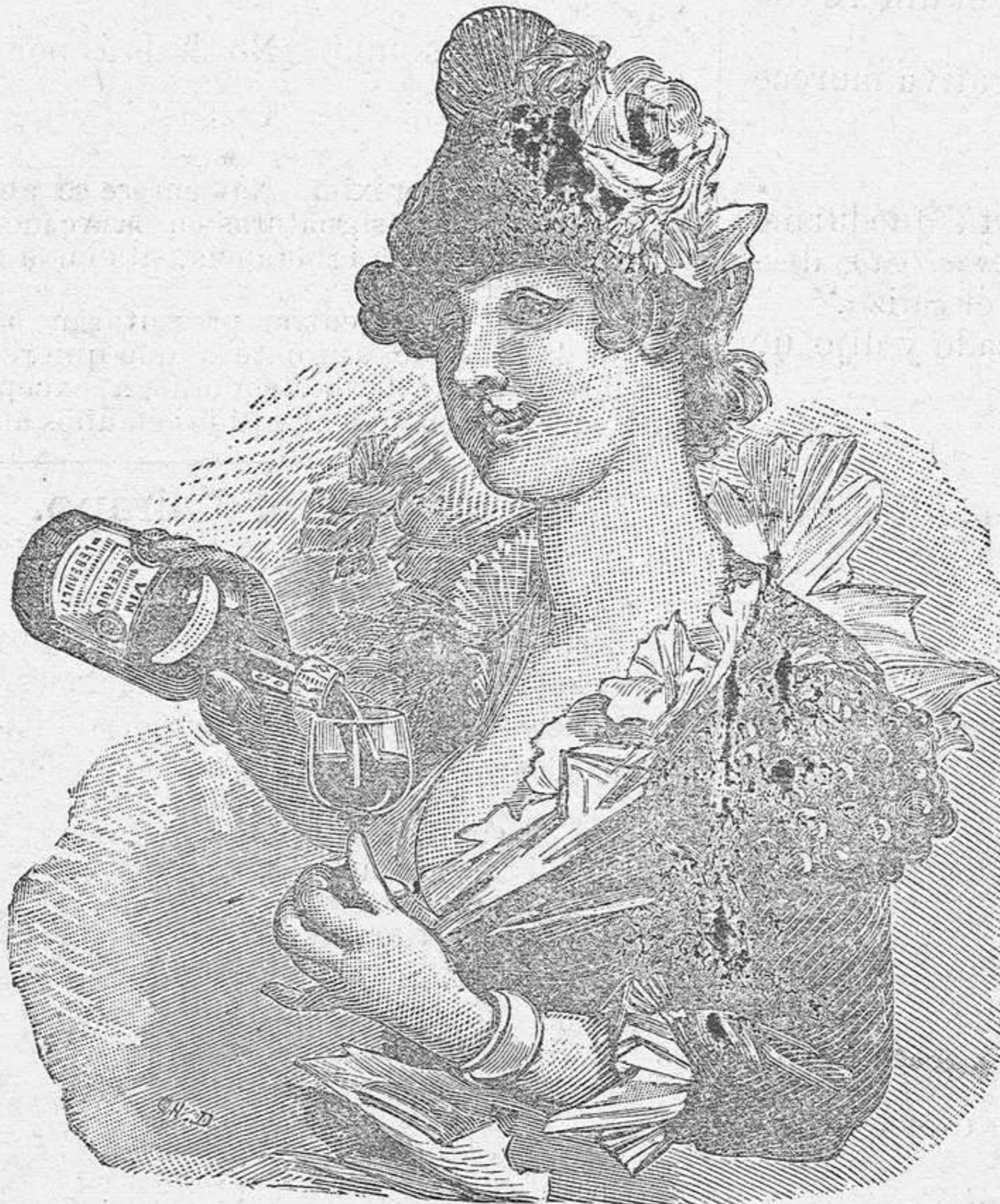
El VINO de BUGEAUD ha obtenido la recompensa más alta en la Exposición de Higiene de la Infancia de Paris (1887)

Venta al por Mayor: P. LEBEAULT & C ia , 5, Rue Bourg-l'Abbé, PARIS