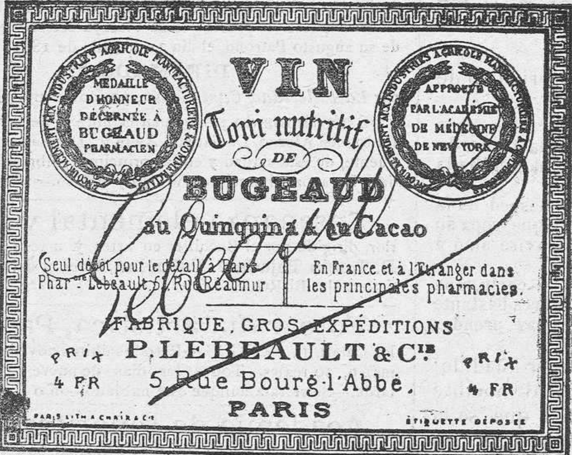
REPRODUCCIÓN DEL RÓTULO DEL VERDADERO VINO de BUGEAUD (impresión negra en fondo gamusa, firma encarnada).