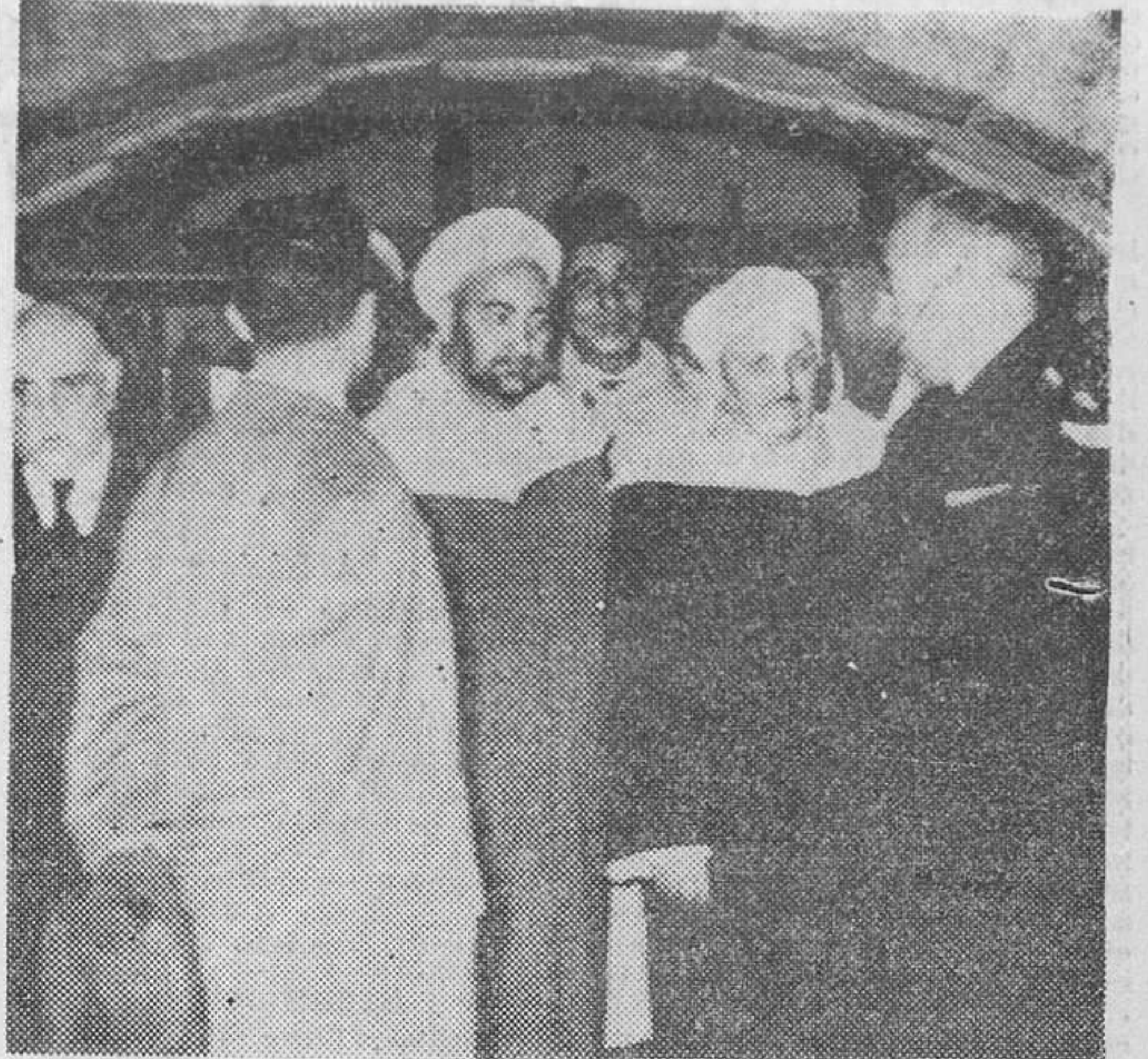
Los moros notables del Marruecos español, huéspedes, en estos días, de nuestra patria, durante su visita a las gloriosas ruinas del Alcazar de Toledo, acompañados de las autoridades de la capital.