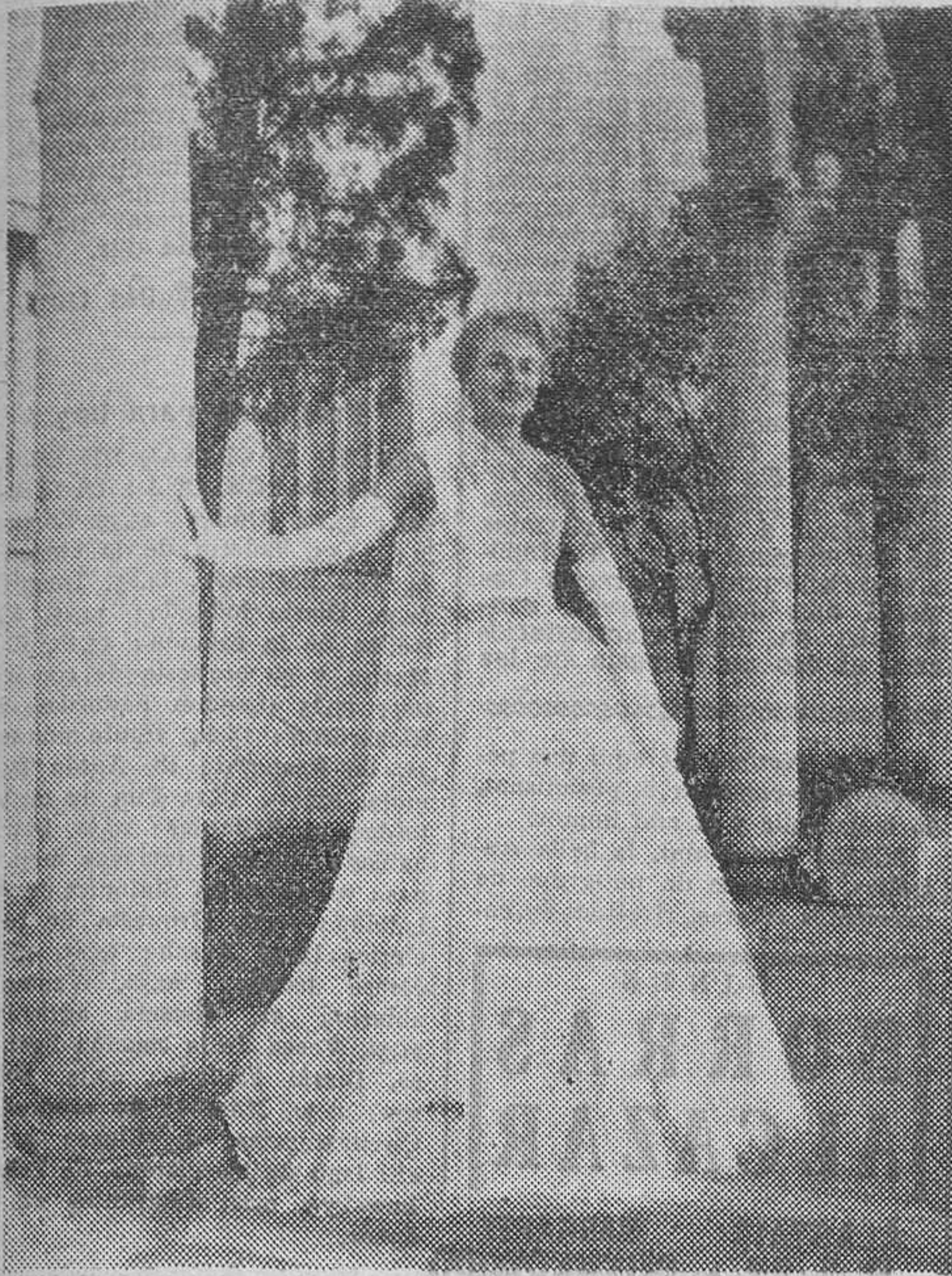
«Menfis», elegante modelo de la colección de trajes de noche creados por Asunción Bastida.

montones de piezas en desorden. Y las mujeres, todas, en plena actividad de compras. «Era del algodón» puede llamarse la época que atravesamos. Del algodón — vichys, popelines, ordelín — se hacen trajes monísimos que se ven a todas horas por nuestras calles, y por la tarde y por la noche en los jardines frescos, donde se baila suavemente entre sorbos de bebidas heladas. Algodones mates y algodones