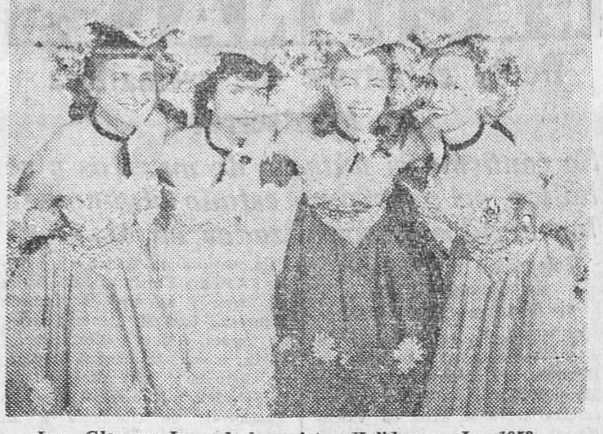
Las «Glamour Ices» de la revista «Holiday on Ice 1953».