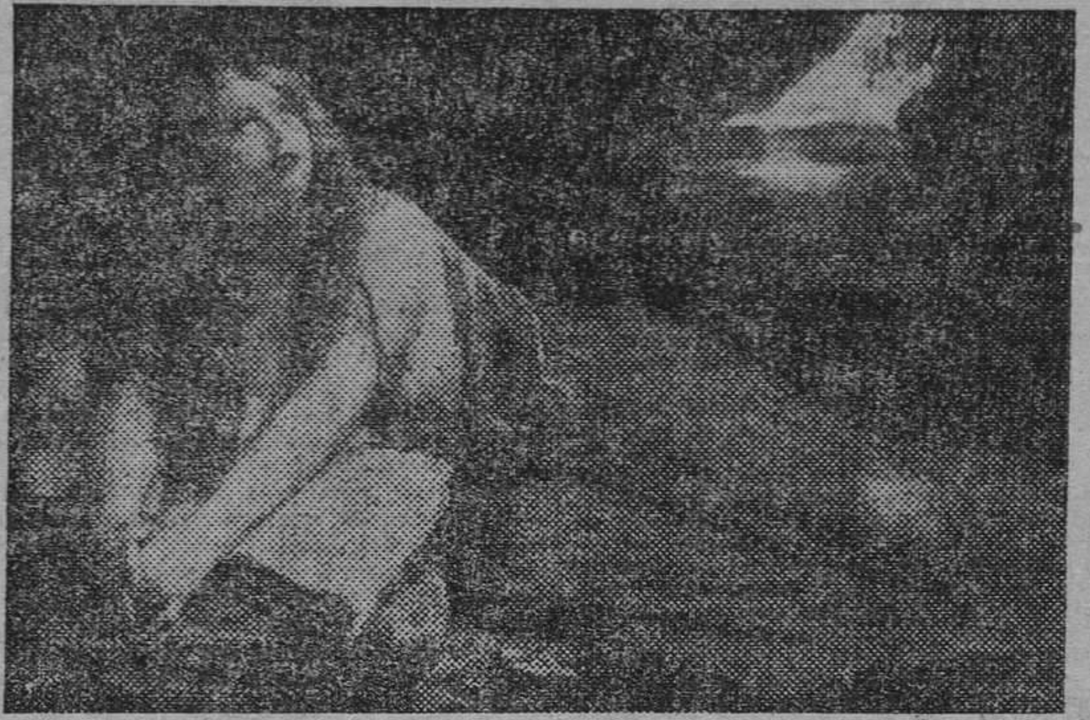
«Magdalena penitente», uno de los notables lienzos de Julio Borrell, que figuró en su exposición recientemente celebrada en Madrid

Que José Morell es un pintor completo, lo demuestra su actual exposición en la Sala Gaspar. Retratos, temas de figura, paisaje, marinas, bodegones e, incluso, un tema religioso, de grandes proporciones y elogiable ambición, integran el importante conjunto reunido por el artista. Y éste triunfa especialmente en las siguientes obras: Sus dos retratos, llenos de señoril empaque y pléticos de calidades en su maestra ejecución; los bodegones de caza «Pelo y plumas» — pieza de gran empuje y valentía, felizmente resuelta — y «Plumas», obra fuerte y construida: una de las mejores de esta exposición. Anotemos también sus visiones de Mallorca, «Rocas grises», «Coralinos» y «Desde Nazarets»; José, deliciosa cabeza infantil, y sus temas anecdóticos «La pelca» y «La Leona», compuestos con notable logro del movimiento y pintados con suelta y espontánea factura. Esta exposición ha de proporcionar a Morell uno de los mayores éxitos de su carrera artística.