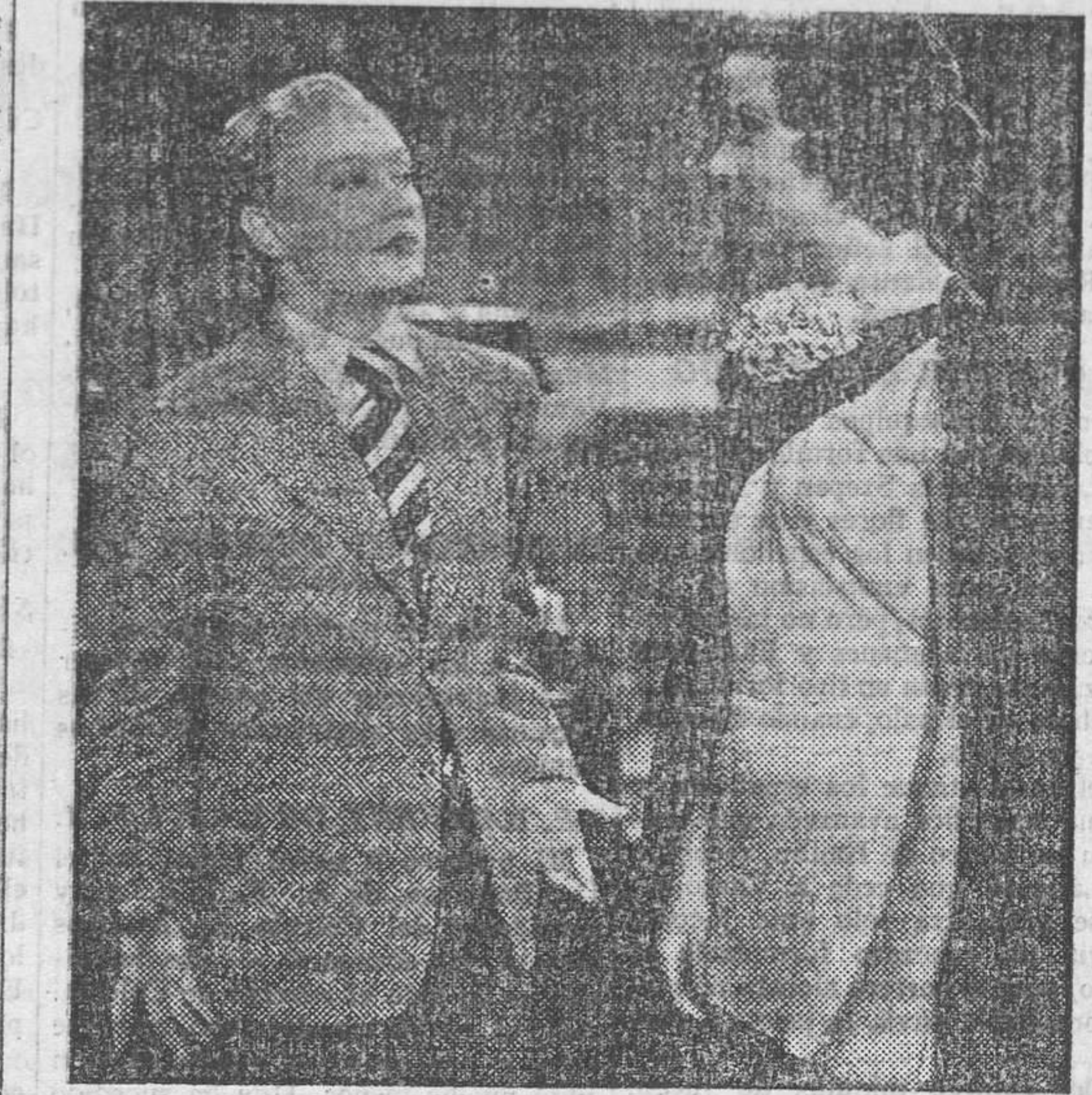
¿Una escena de amor? ¡Todo al contrario! Una discusión violenta y regocijante entre dos estrellas: Miriam Hopkins con traje masculino y Kitty Carlisle protagonistas del film Paramount, «Fuga apasionada» que hoy, lunes, se estrena en COLISEUM

Completará el programa: La carga del diablo film de acción, Columbia, por Marian Marsh y Wallace Ford