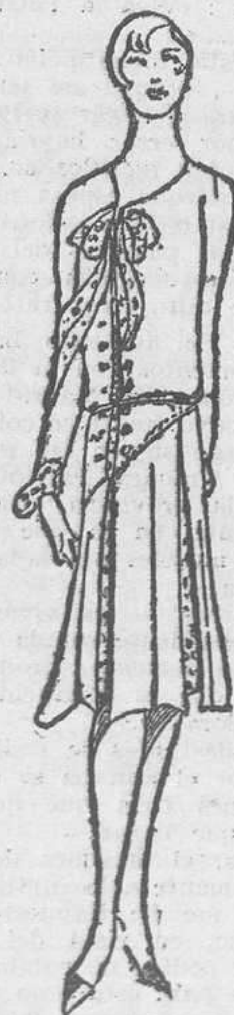
Elegante modelo de crepé de China