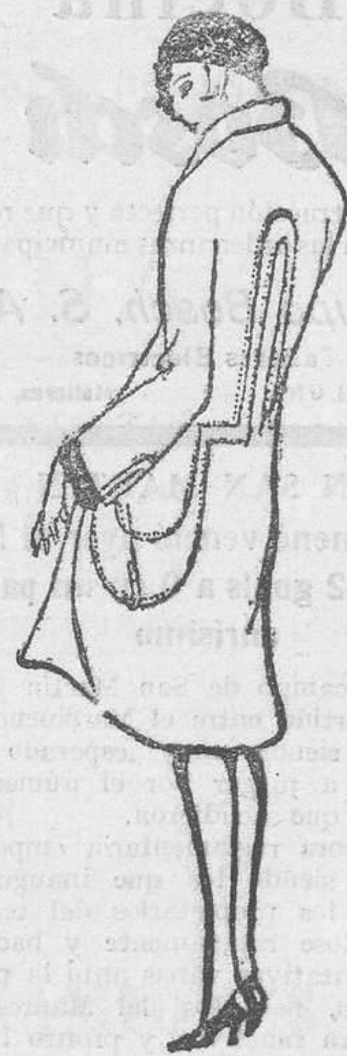
Abrigo de lana beige, con adornos de piel de nutria.