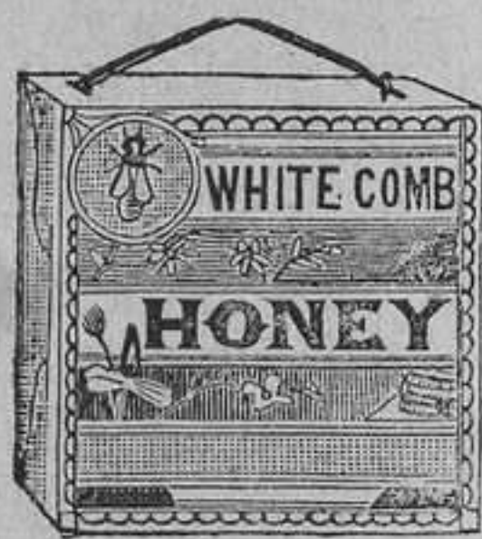
CAJA DE CARTÓN DE Á UN PANAL

Estos envases tienen cada uno su correspondiente cinta para llevarlo cómodamente de la mano, son de buen cartón y de aspecto elegante. Al llegar á su destino solo hay que desdoblarlos para tener una bonita cajita como el grabado que publicamos.