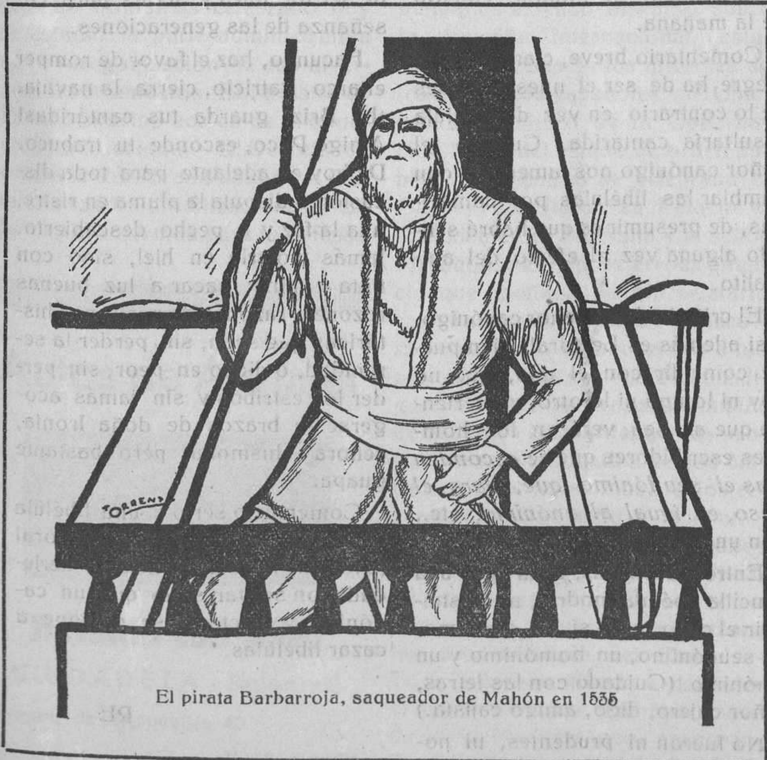
El pirata Barbarroja, saqueador de Mahón en 1535