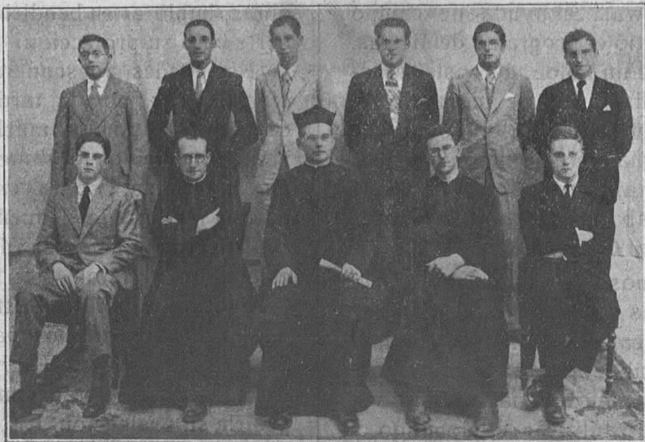
Alumnos de este Colegio que han terminado sus estudios de Bachillerato