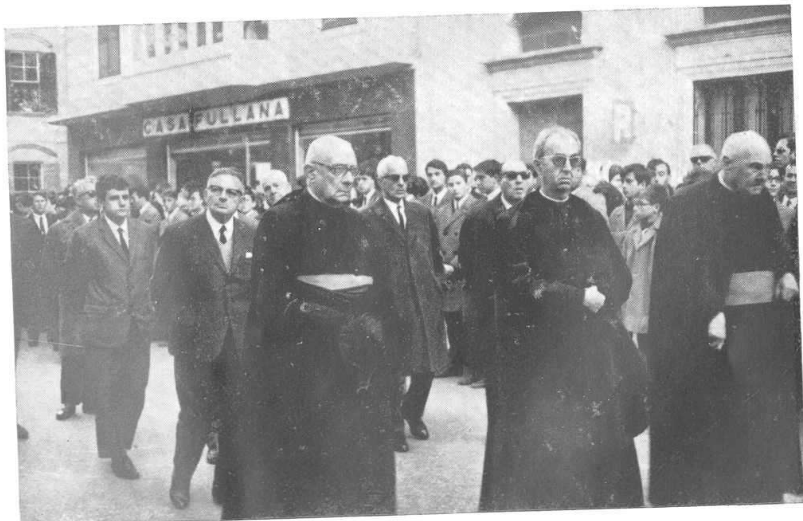
SEGUNDA PRESIDENCIA DEL DUELO