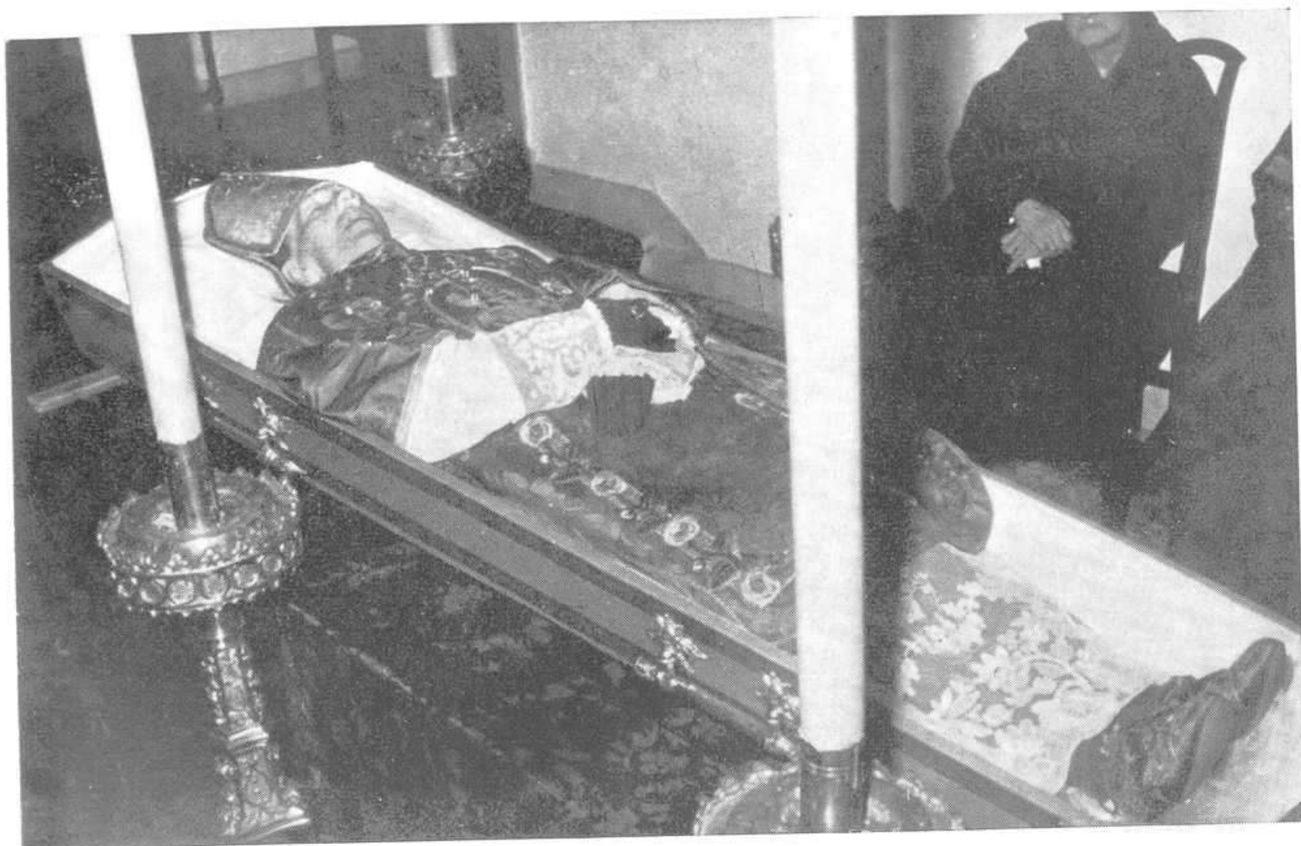
EL CADÁVER EN LA CAPILLA ARDIENTE DEL PALACIO EPISCOPAL