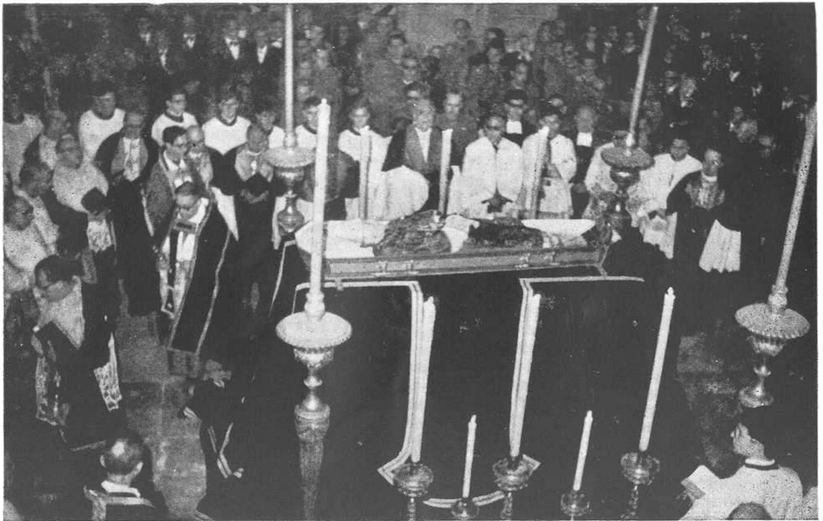
EL TÚMULO EN LA CATEDRAL BASÍLICA