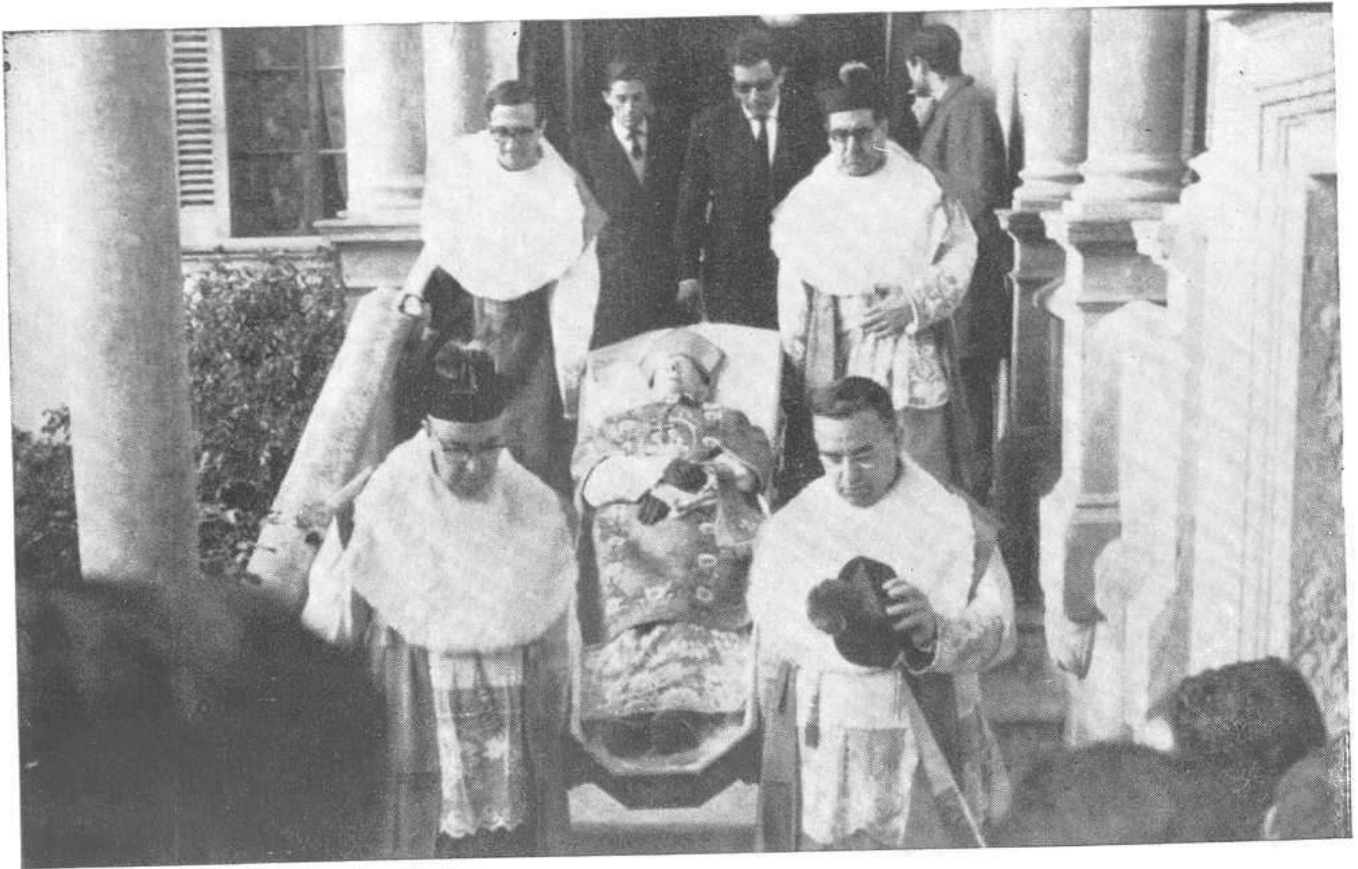
LOS RESTOS MORTALES SON BAJADOS DEL PALACIO EPISCOPAL