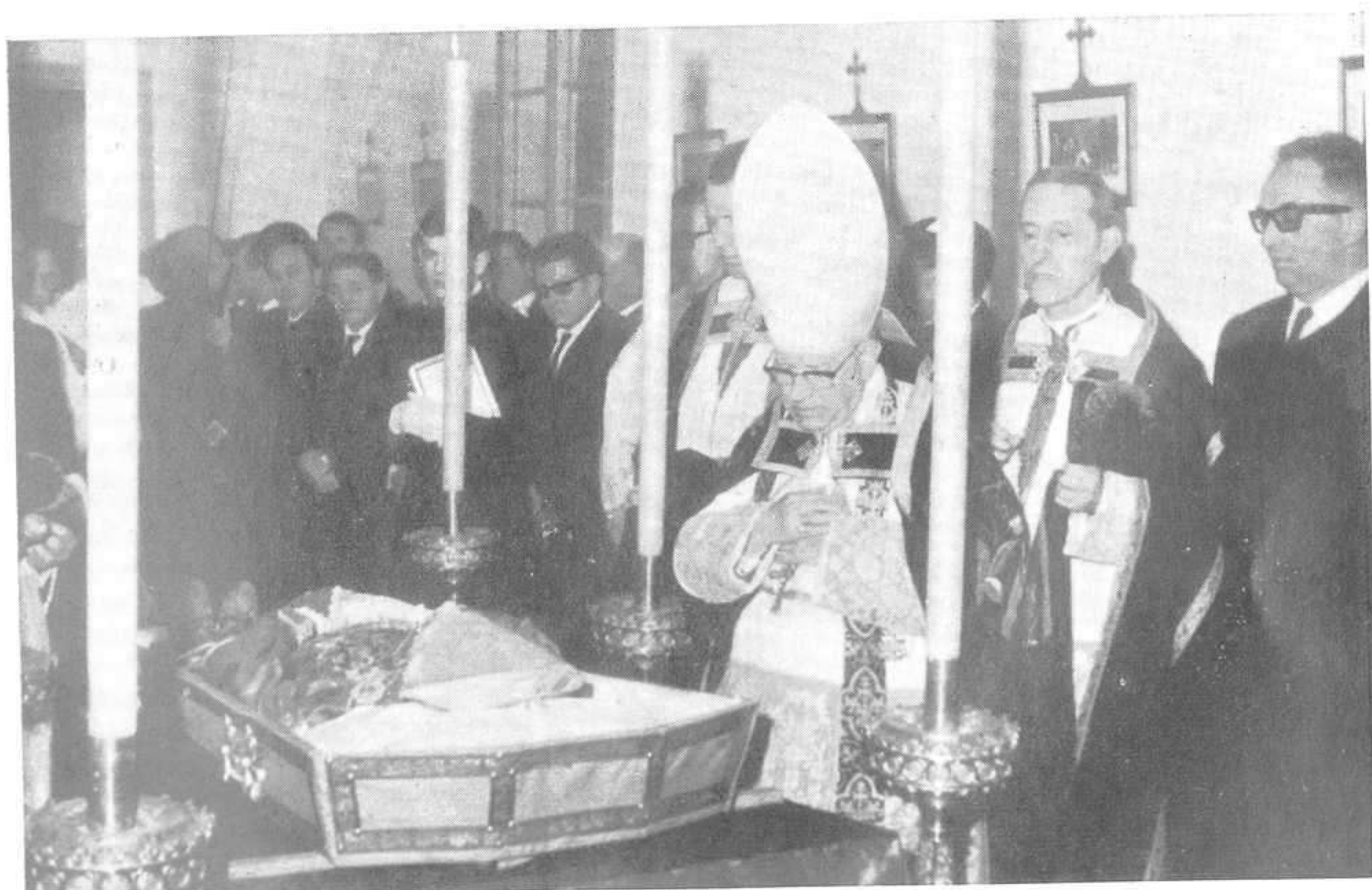
EL RDMO. SR. OBISPO ADMINISTRADOR APOSTÓLICO ANTE EL CADÁVER EN LA CAPILLA ARDIENTE