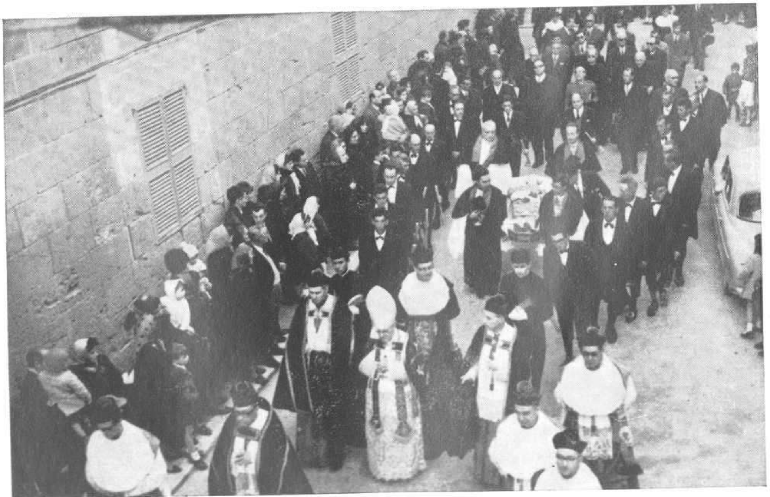
EL RDMO. SR. OBISPO ADMINISTRADOR APOSTÓLICO OFICIANDO DE PRESTE EN EL TRASLADO DEL CADÁVER A LA CATEDRAL BASILICA