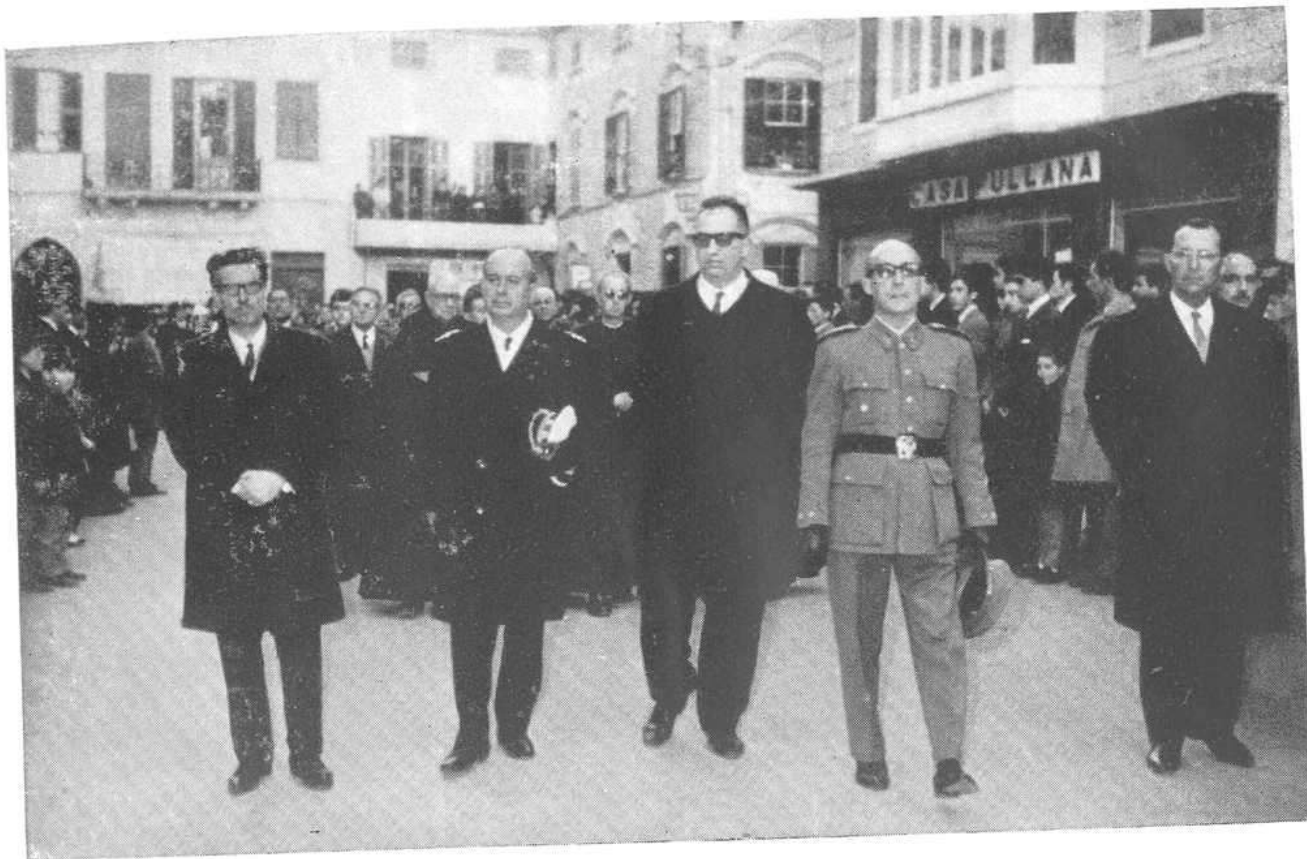
LAS AUTORIDADES PRESIDENDO EL CORTEJO FÚNEBRE