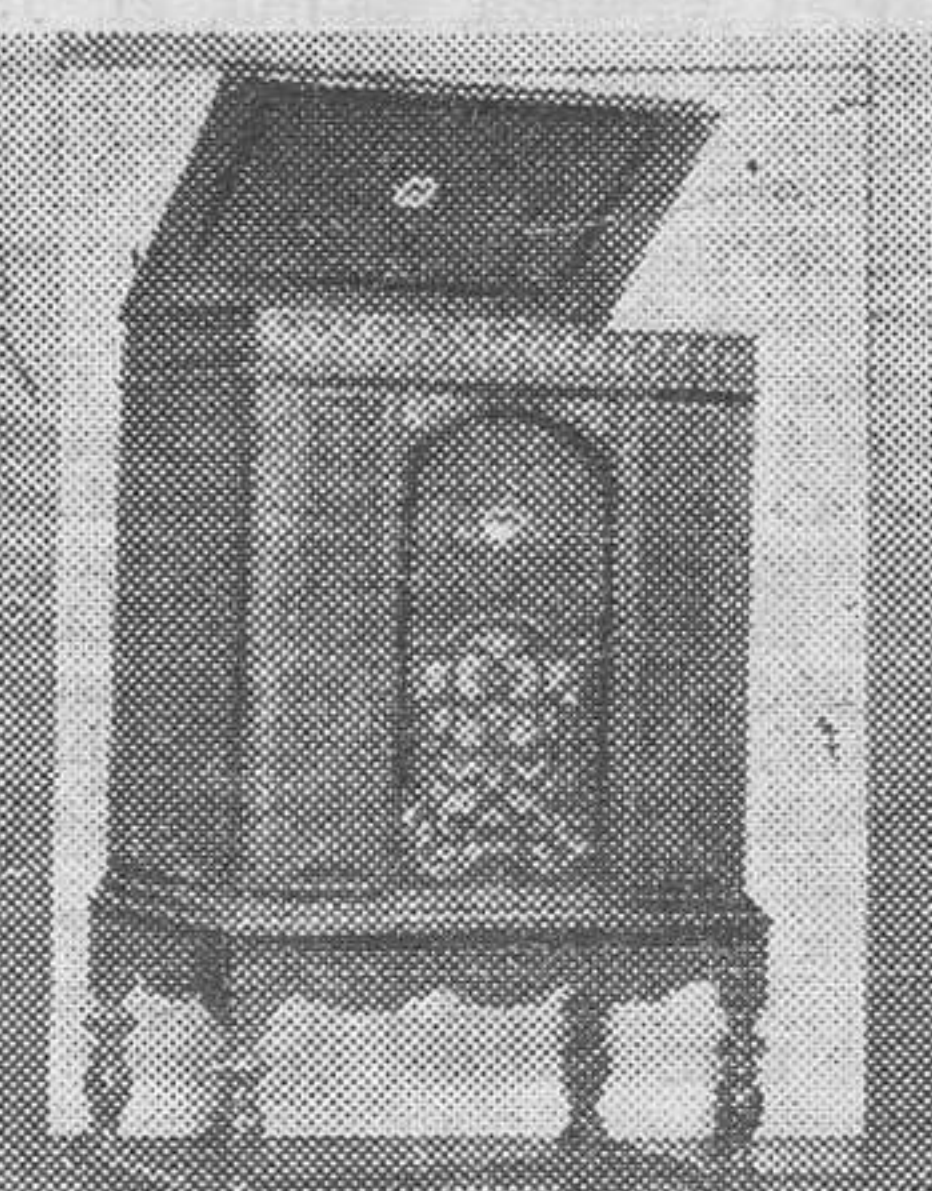
Radiófono "Aeolian", segundo premio del baile de la Asociación de la Prensa