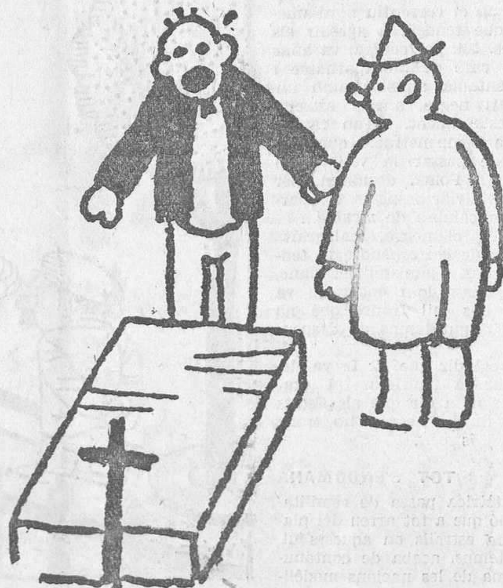
—Però, per què heu fet posar aquesta làpida tan pesant a la tomba de la vostra muller? —Es que no sabeu la força que tenia!