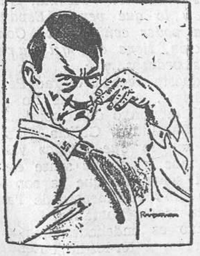
—Ja em tenen aquí, senyors!

La plutocràcia, orient-se insensatament invencible, apeña a tots els procediments per tal d'aixafar els justos moviments obreristes. El tancament de fàbriques per tal de fer més Catalunya, major eficàcia, ja que porta a les llars obreres, amb la fam, la claudicació, però aquesta arma, un dia o altre, ha de girar-se contra el que l'esgrimim. La necessitat de l'amo no és avui una cosa dogmàtica. La guerra marítima motivà 86.000 morts. Més de la meitat d'aquestes pertanyien a la marina britànica: 2.468 oficials i 30.895 mariners de la marina de guerra i 14.661 oficials i mariners de la marina mercant... Prou estadístiques. Tots aquests horrors no han estat su-