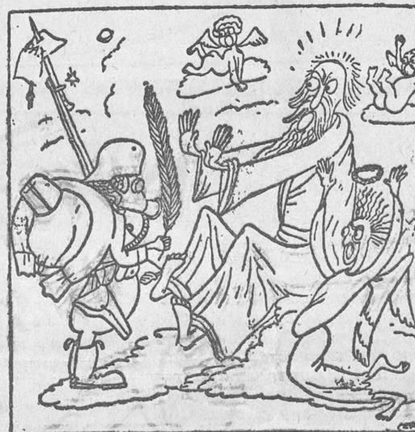
1934. — Mireu, Senyor! He trobat un altre «empleu».