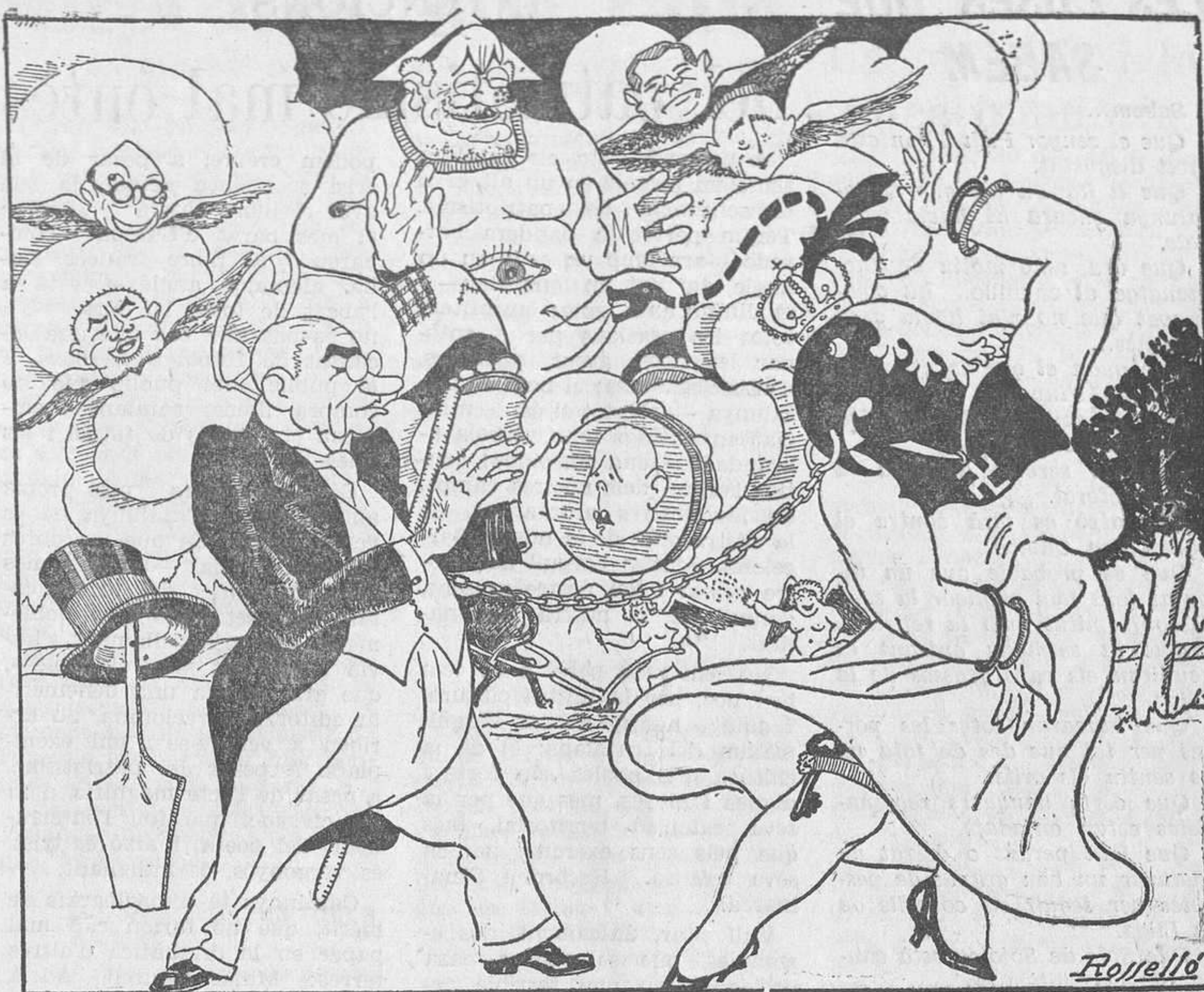
Les angúnies de la Lliga, o un Sant Isidre impertinent

Indubtablement, hi ha diferència entre aquests polítics nostres —nostres per força— i els d'altres nacions civilitzades. Cal pensar en quines haurien estat les activitats d'aquests polítics en nacions civilitzades. Segurament, amb tota seguretat, cap d'ells no tindria el relleu que aquí té. Segurament, amb tota seguretat, viurien una vida anònima i obscura, que és la que mereixen. I la que, en canvi, viuen a Espanya els homes que tenen una autèntica intel·ligència, una autèntica honradesa, una autèntica dignitat.