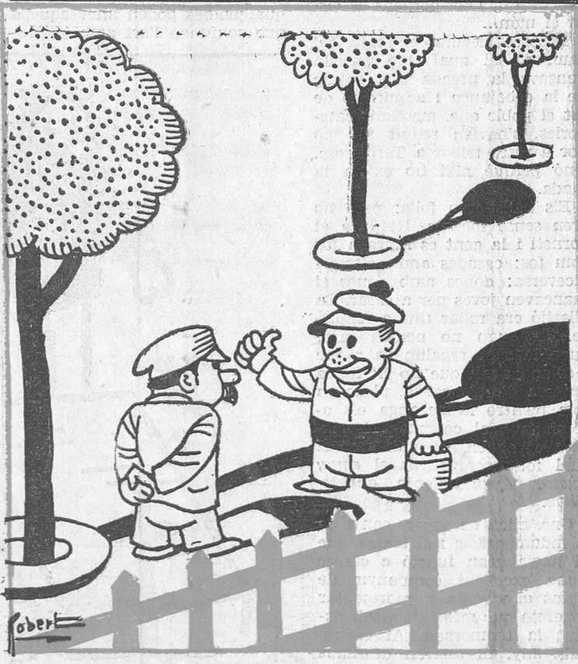
—M'he comprat un motor que fa mil revolucions per minut... —Calla, imprudent, que si et senten!

Si feu col·lecció de «tonterias» guardeu aquesta: «Las nuevas pesetas han sido muy bien acogidas por el público». Això ho ha dit, només, un ministre del Govern Samper. I es deu haver quedat tan descansat, el bon senyor. Ara que podria afegir que les pesetes velles no eren rebutxades per ningú... turalment, va desmentir l'especie circulaada. El repòrter, indignat, va dir-li: «Volen, mestre, que escrigui un article violent contra l'autor de l'ensarronada?» «Oh, no —féu Mark Twain —. Limiteu-vos a dir-li que ha exagerat una mica mica...» SCARAMOUCHE