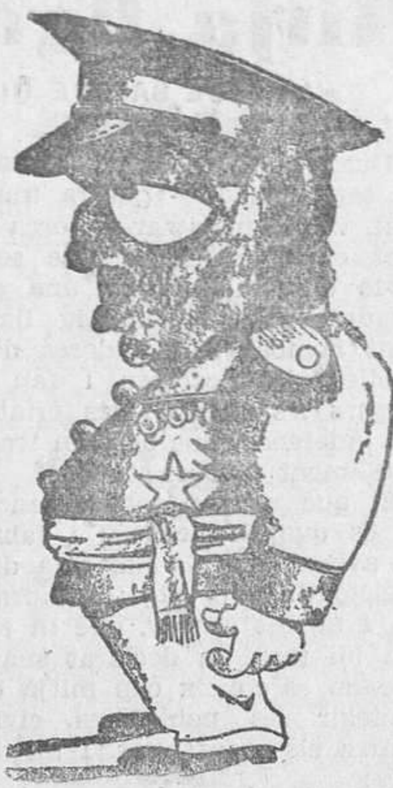
—El senyor que espera que el oridin...