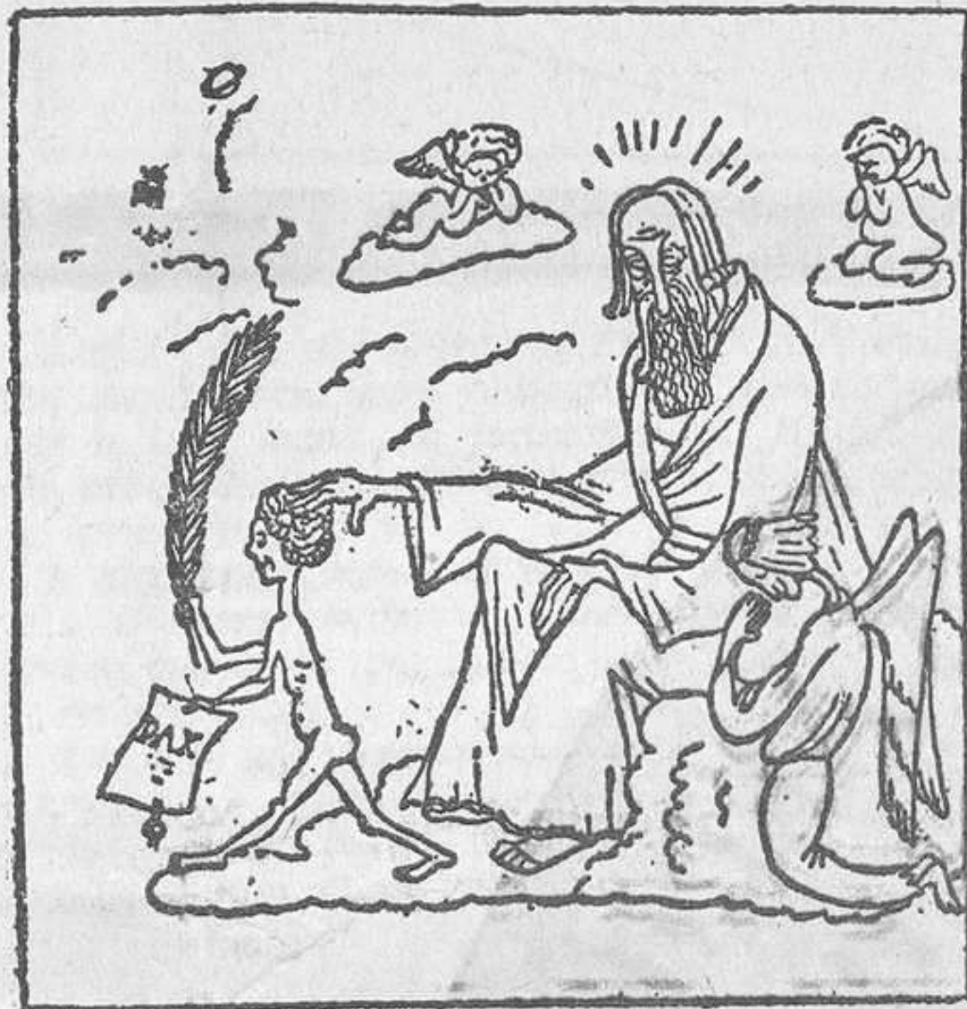
1918. — Vés! Porta la pau als homes!

I quan l'Església protesta a cor contra l'enderrocament d'unes creus de terme sense cap valor o bé perquè algú, en un moment d'expansió de la rebel·lia humaníssima que produeixen moltes coses d'aquest món, renega recargoladament, sentiu com una mena d'acostament a Déu en el sentit de plànyer-lo perquè té damunt la terra aquesta representació que el des-acredita. P. R.