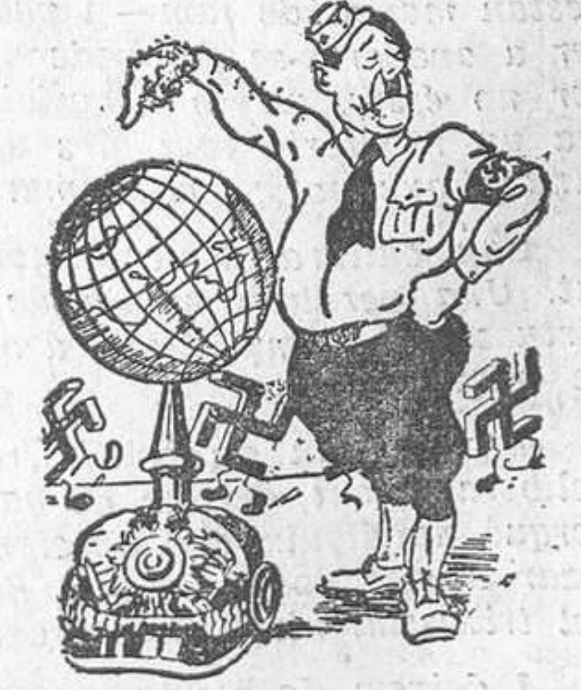
—Jo recoloraré el món sobre una base sòlida!