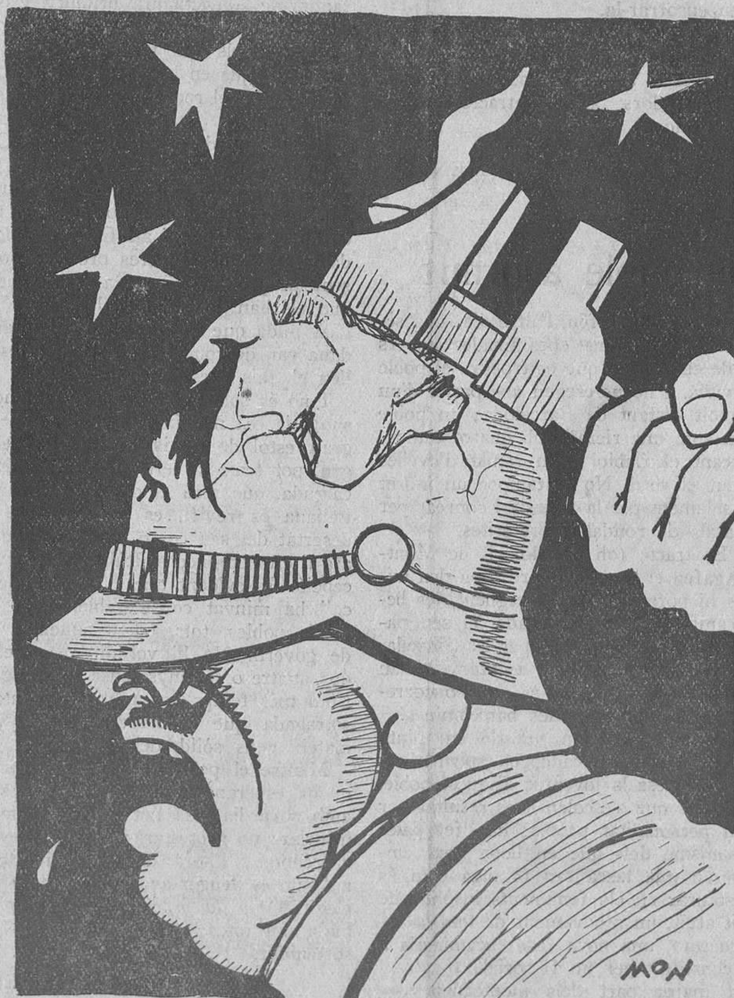
Les eleccions alemanyes