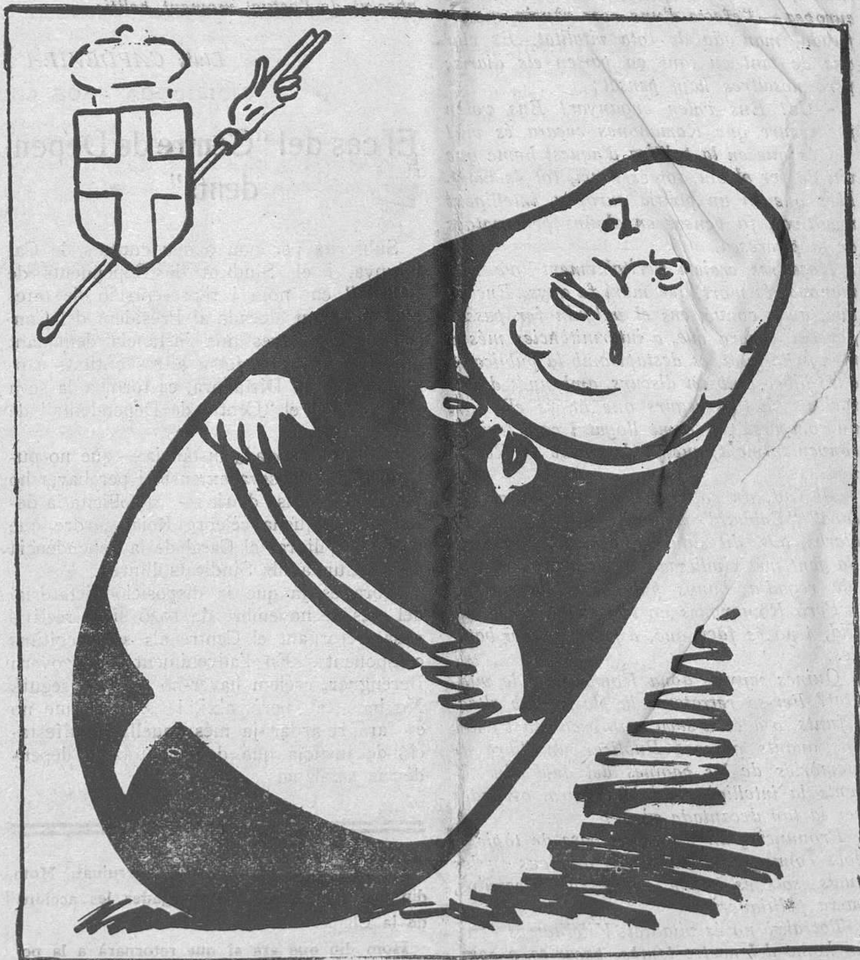
Un que ja comença a perdre l'equilibri.

I ara m'acut una pregunta: Haurien glorificat d'igual manera la memòria del difunt D. Antoni Maura, si el flamant duque hagués defensat un ideari polític més d'acord amb l'esperit de l'època, i s'hagués declarat republicà?