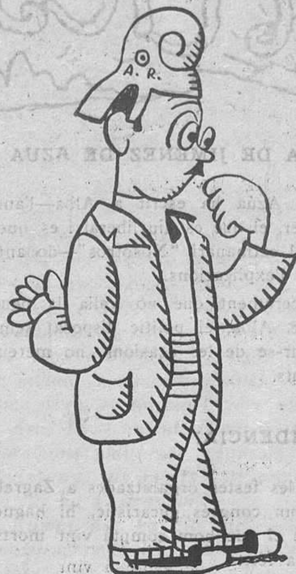
En Lerroix a l'aguait