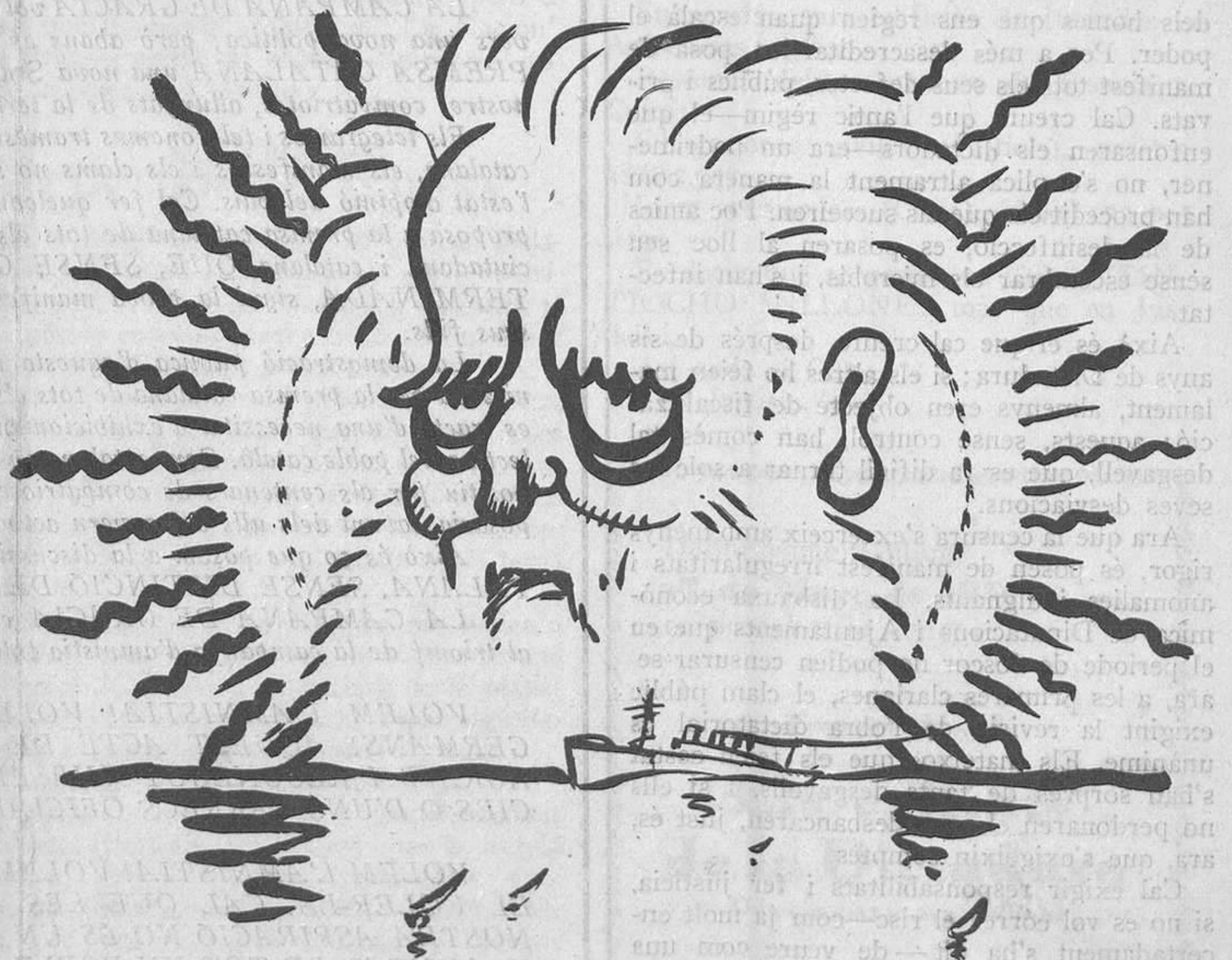
Un sol que ha fet néixer moltes esperances!

"Morta la cuca, mort el verí", diu el poble.