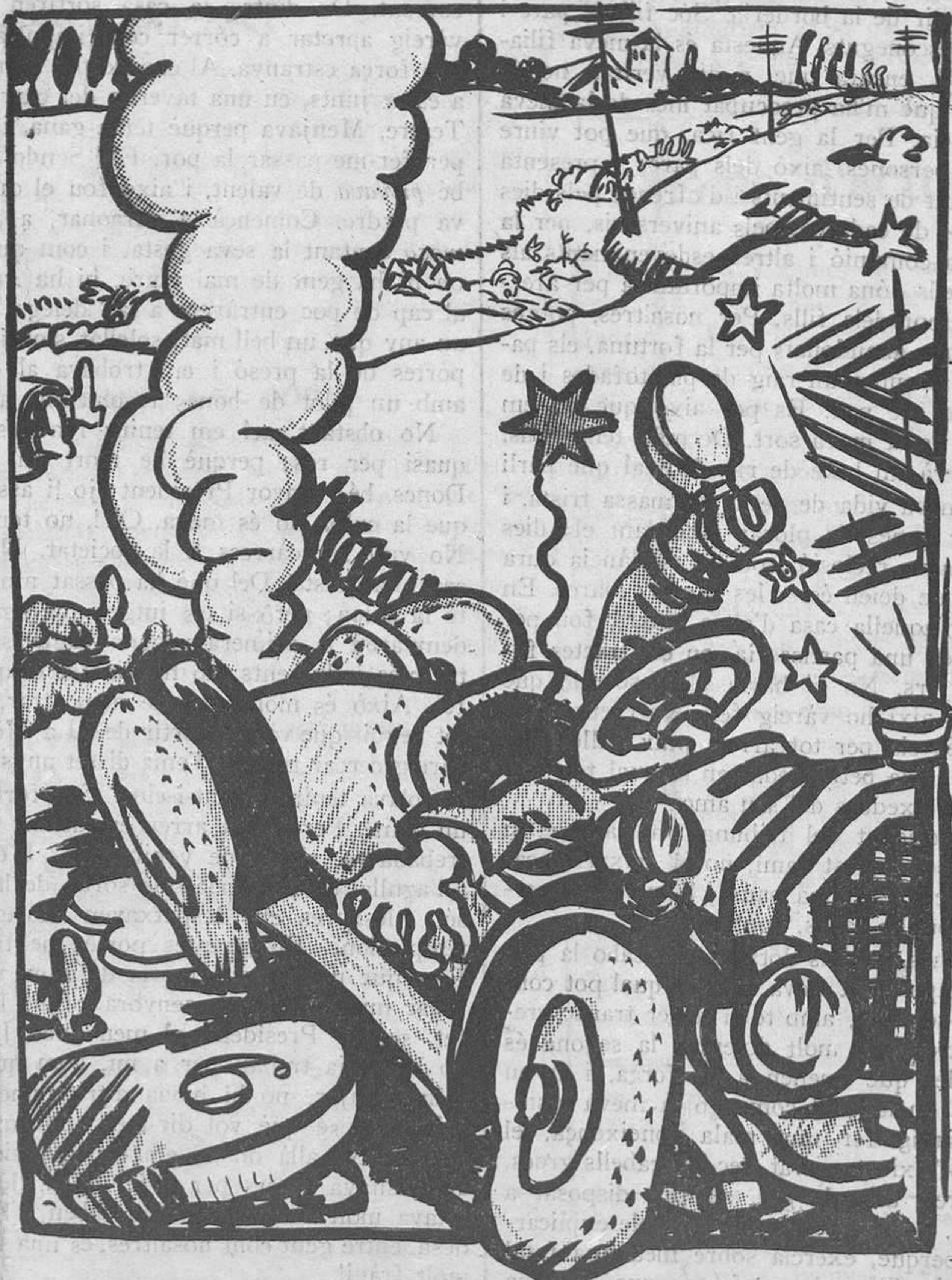
L'auto de la Dictadura

dica sigui restablerta d'un cop i del tot. Cal que, després de sis anys de règim excepcional, hom pugui dir l'escriure amb llibertat les coses que pensa i les que vol. ANGEL PESTAÑA AMICS DE "LA CAMPANA DE GRACIA" Tenim molta feina a fer. Ajudeu-nos. Què ha passat en el vostre poble en aquests darrers anys? Digueu-ho. Cal saber-ho tot. El que ha passat, no pot tornar mai més. Cal que ens expliqueu el què heu vist d'ofès, de desatès, de terrible, en aquest somni horrorós que acabem de passar. Parleu. LA CAMPANA DE GRACIA, avui, com ahir, vol ésser veu del poble.