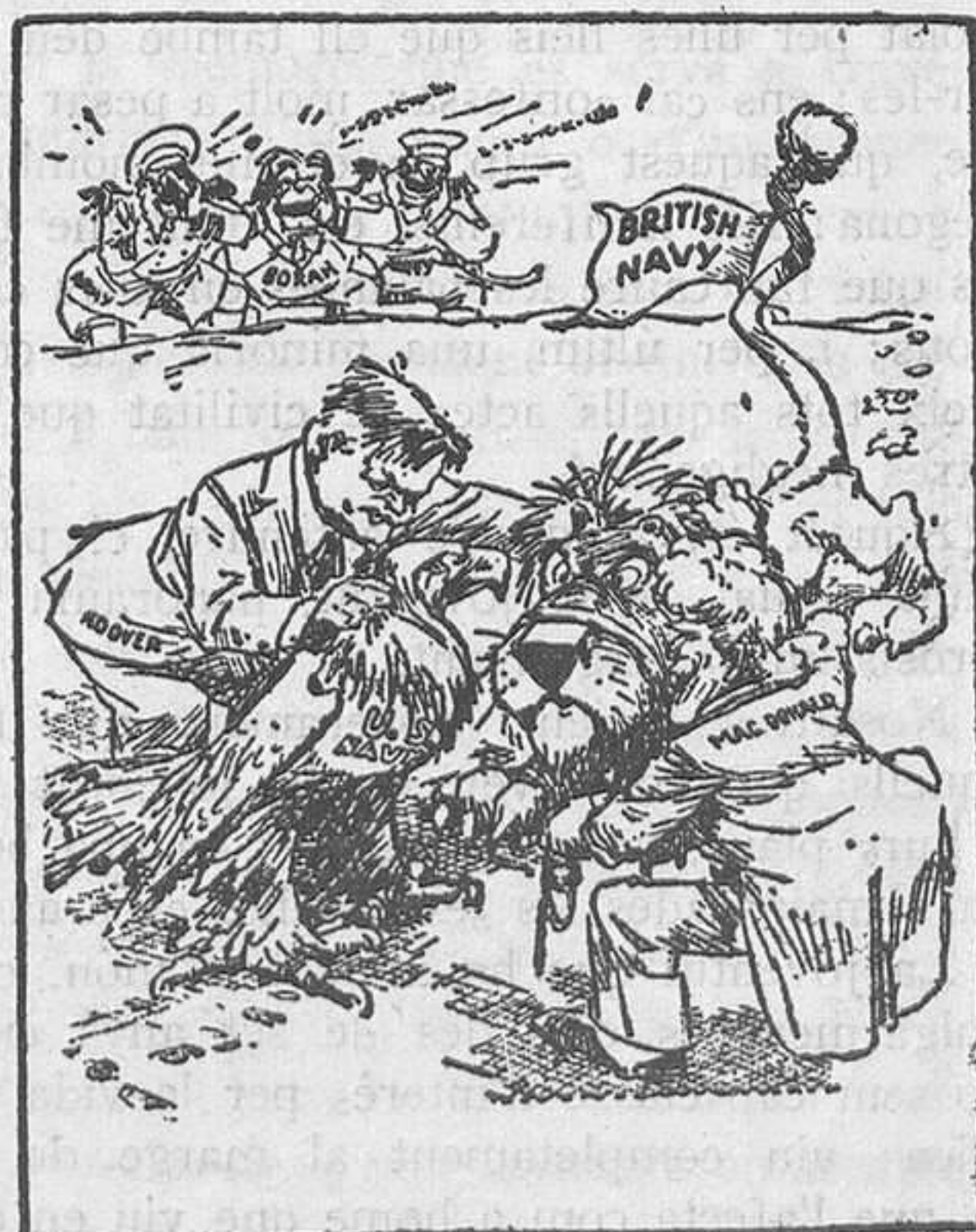
Hoover i MacDonald tenten l'aproximació entre l'àguila americana i el lleó britànic.