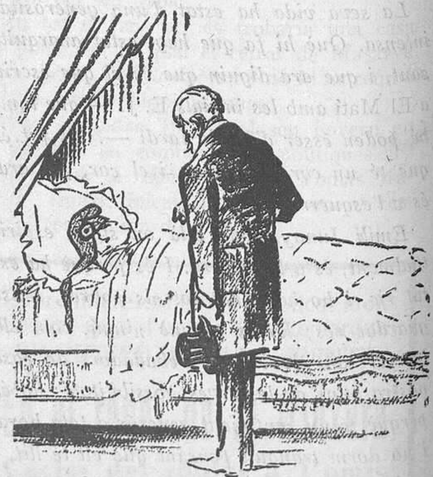
LA LLARGA CRISI

El Metge: —Pobre filla... Acabaran per matar-la.