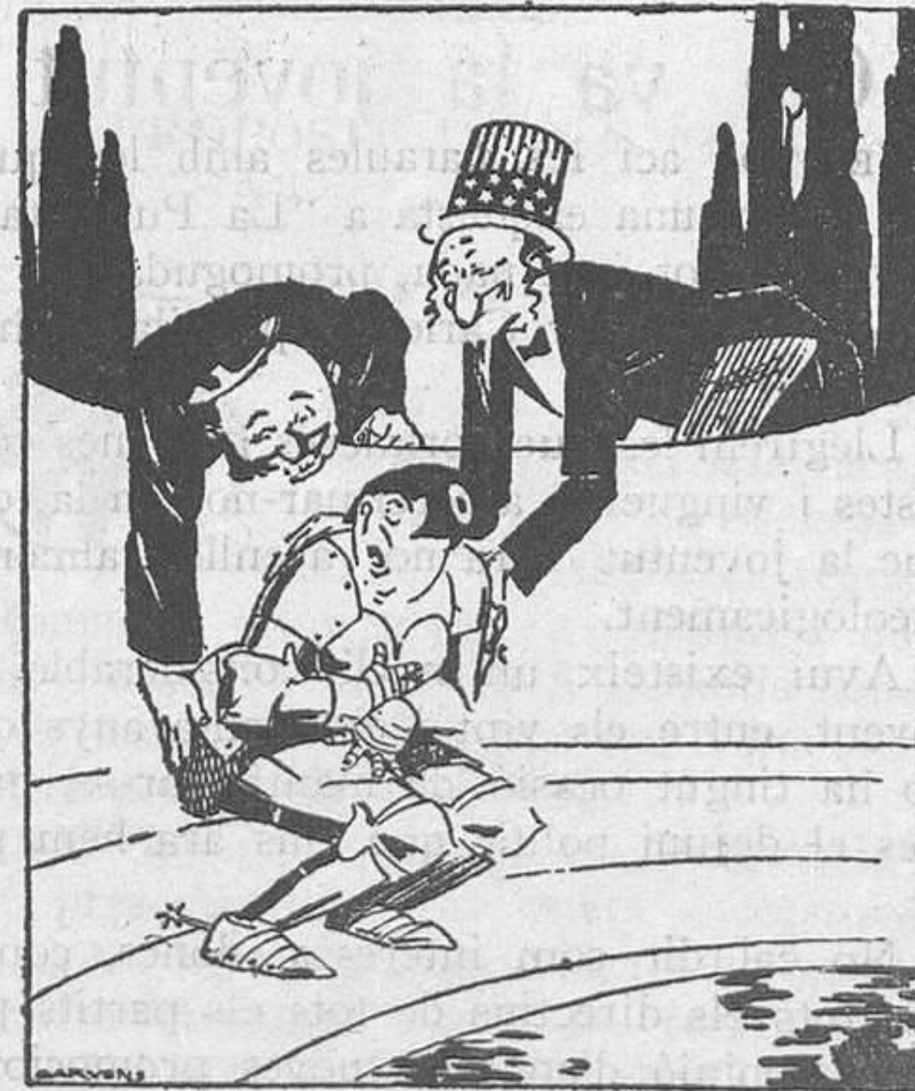
LA CASTA MARIANA I EL DESARMA-MENT