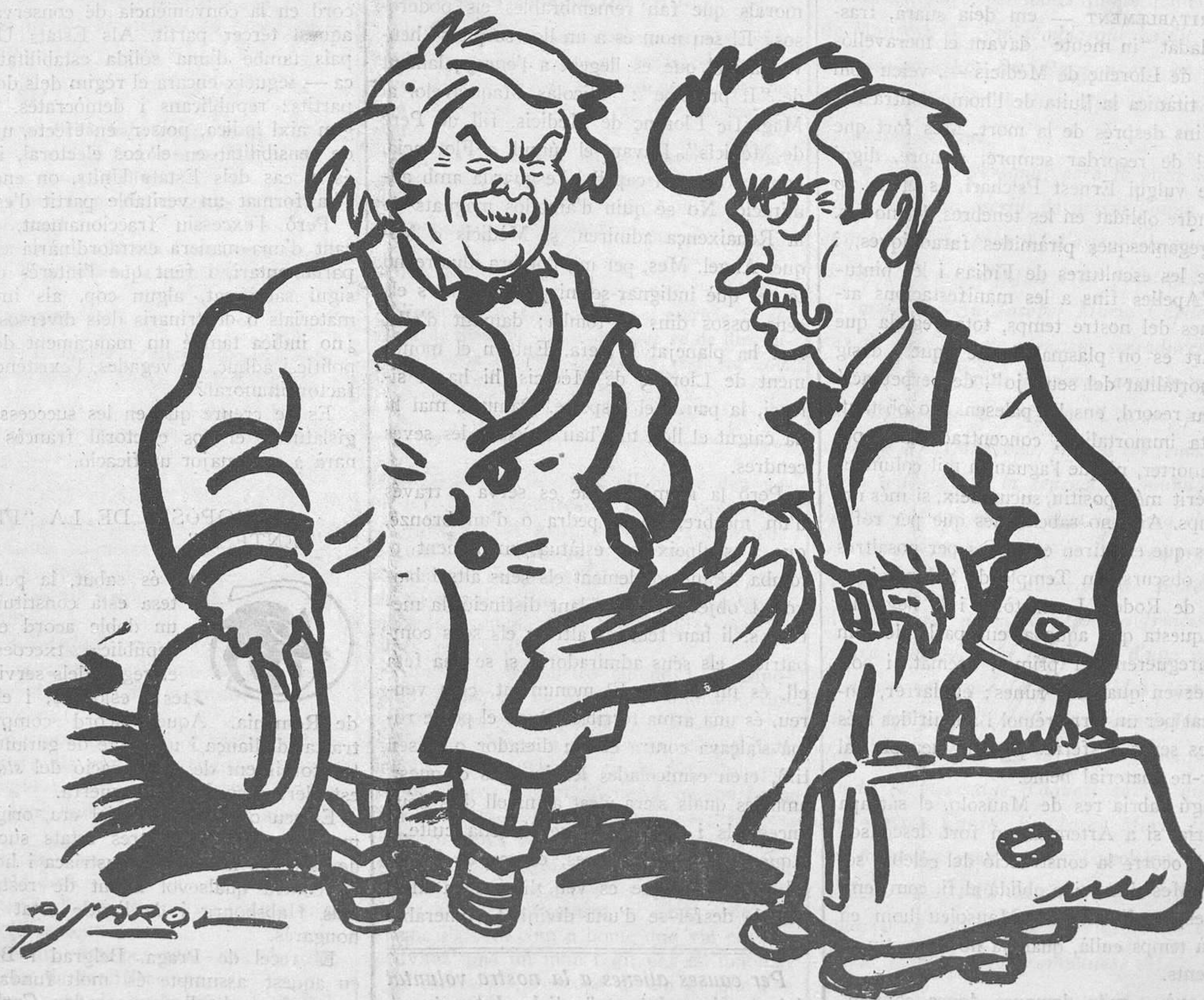
Lloyd George i MacDonald

Amb el submarí, els febles poden plantar cara als forts, i això, aquests, no ho poden consentir.