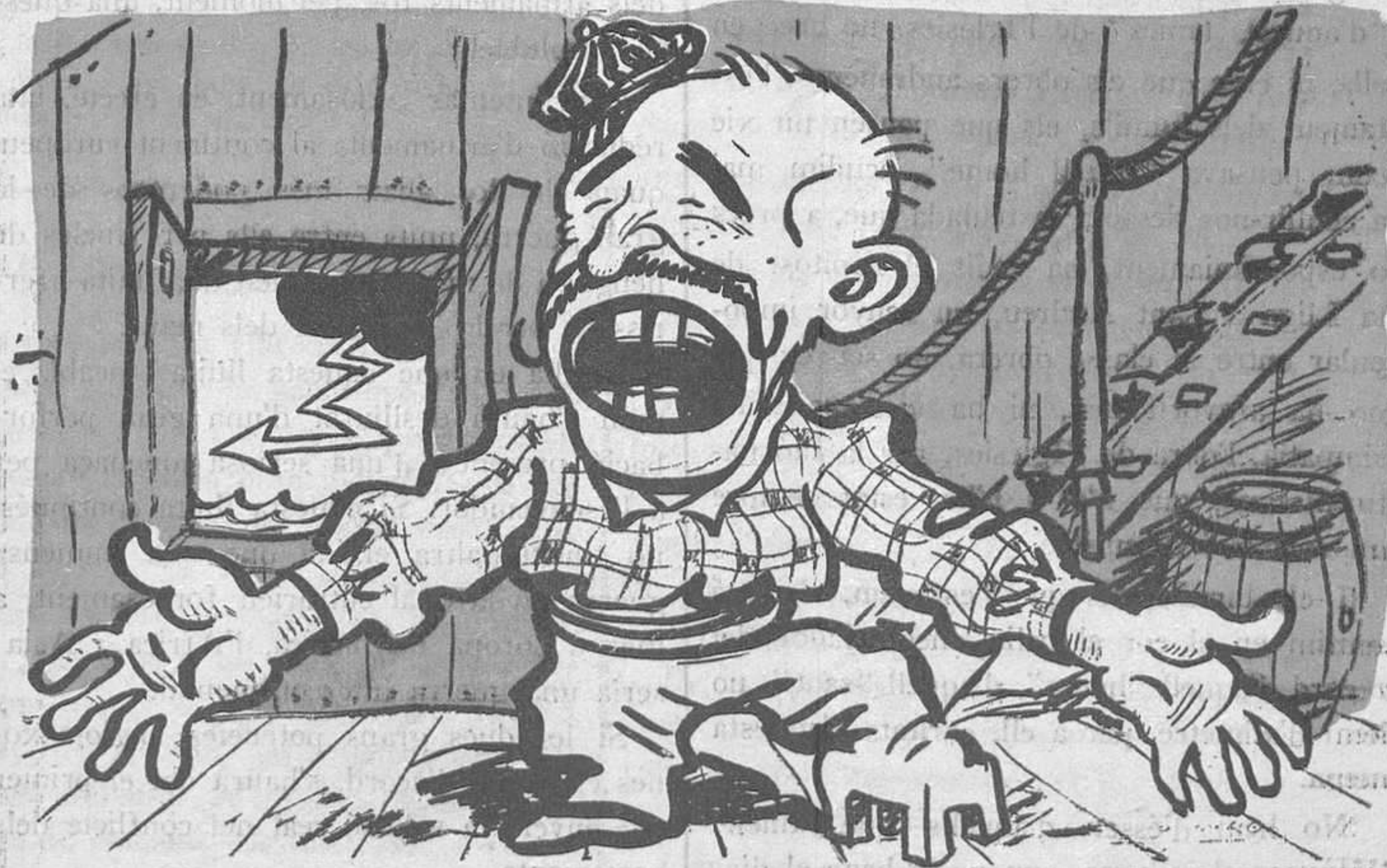
Romanones el divo

He dit anteriorment que aquests senyors que han "fet seva" aquesta tasca, "es diuen" amics de l'Iglésies, i dic que "se'n