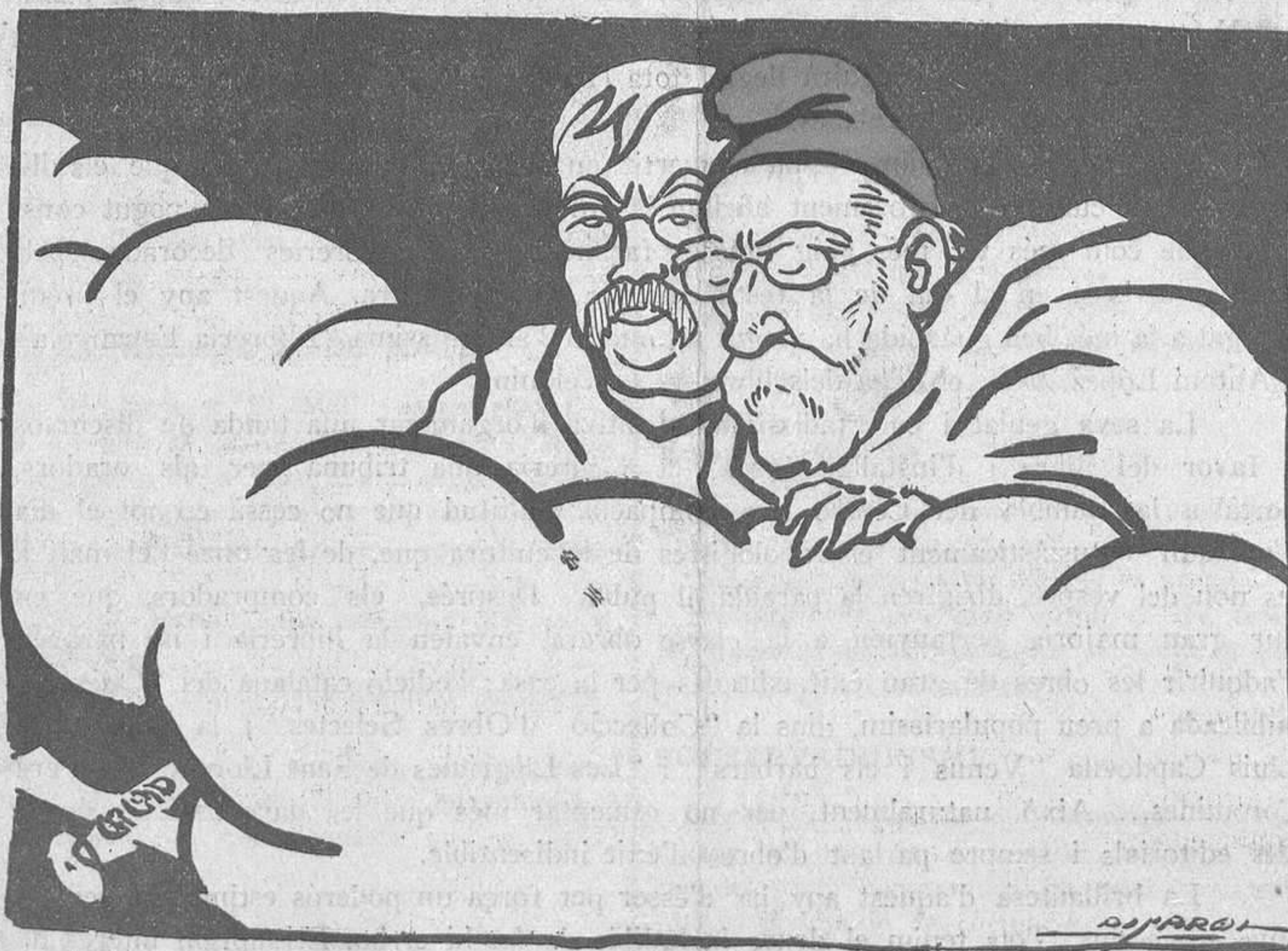
Contemplant la "Diada del Llibre"

A pesar de les estadístiques de «La Veu», el nostre esperit triomfa entre el poble.