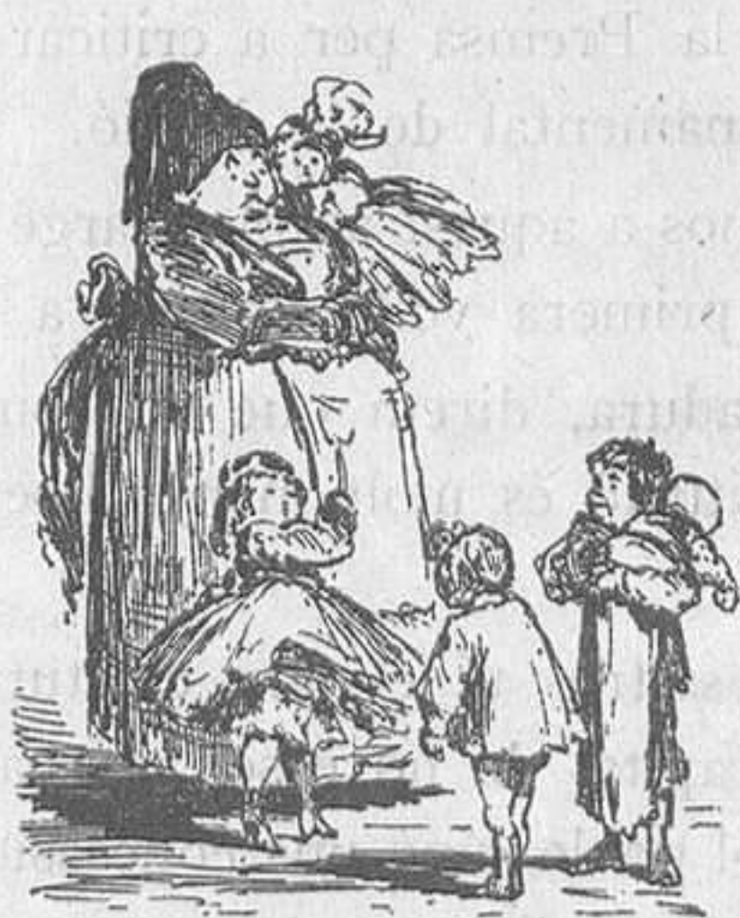
La primera disfressa