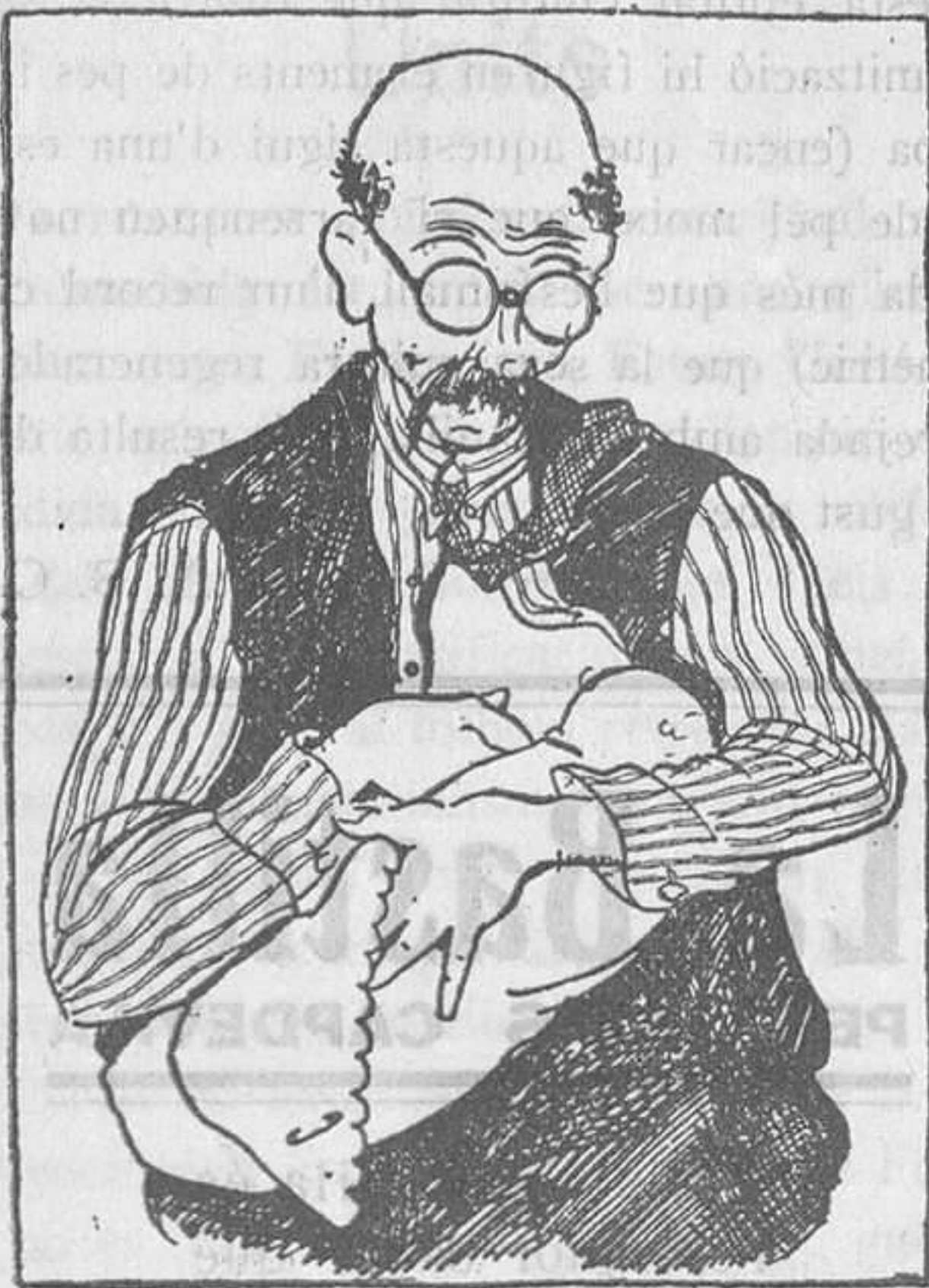
L'home de demà. "Nebelspalter", Suïssa.

A Nova York les modistes que s'havien declarat en vaga varen fer una manifestació. La policia que els sortí al pas va donar una batuda de la que en resultaren ferides 22 noies. El públic mira amb simpatia el moviment de les modistes i critica l'actitud de la policia. I nosaltres també.