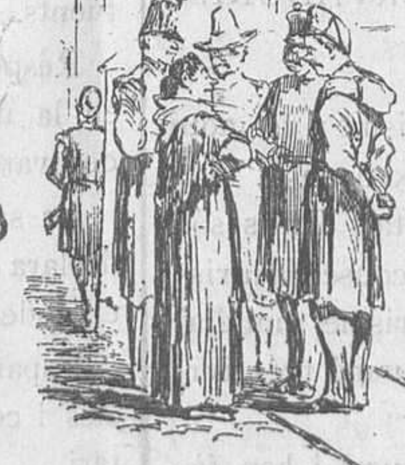
La de les golfes