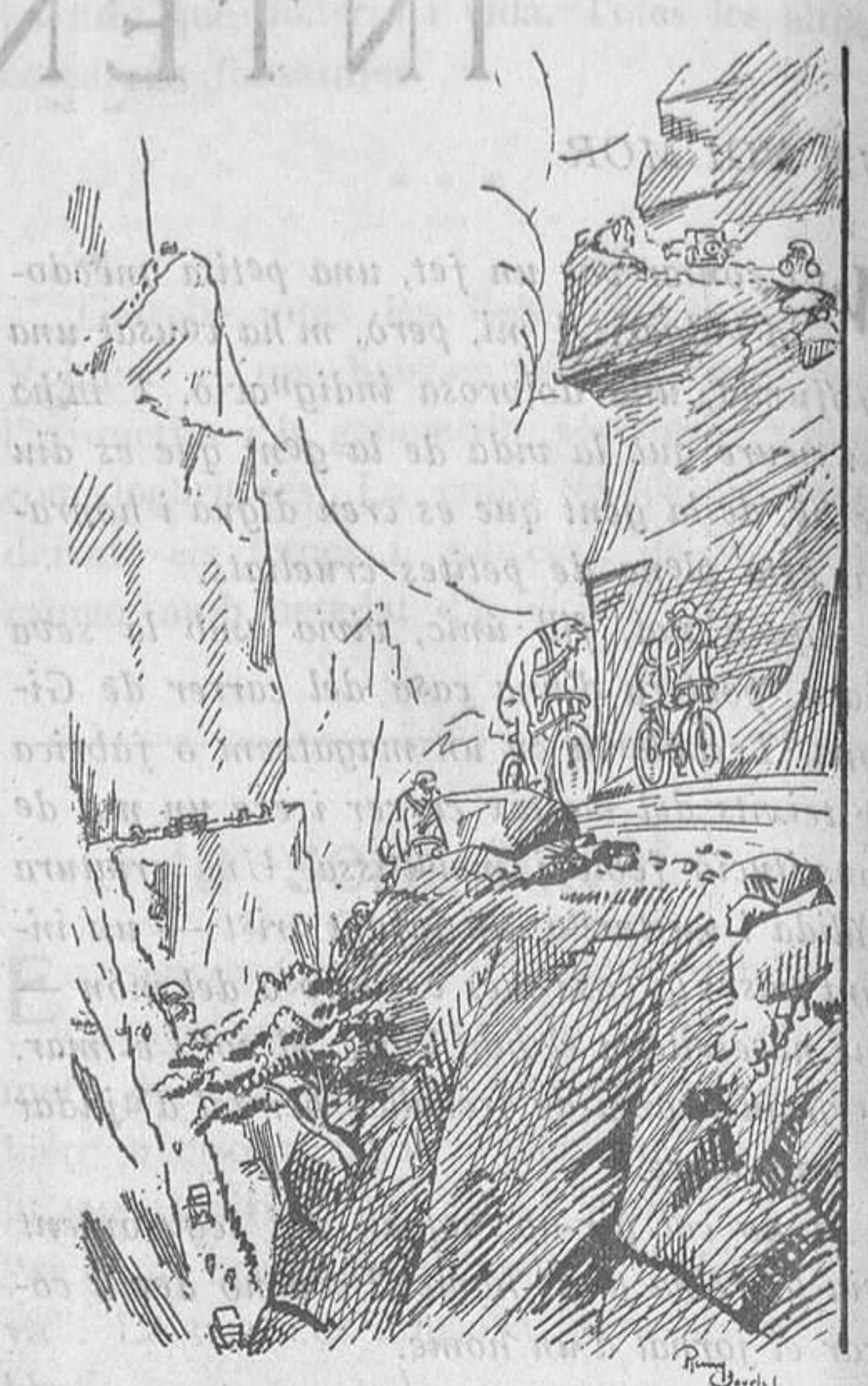
DURANT LA VOLTA A FRANÇA