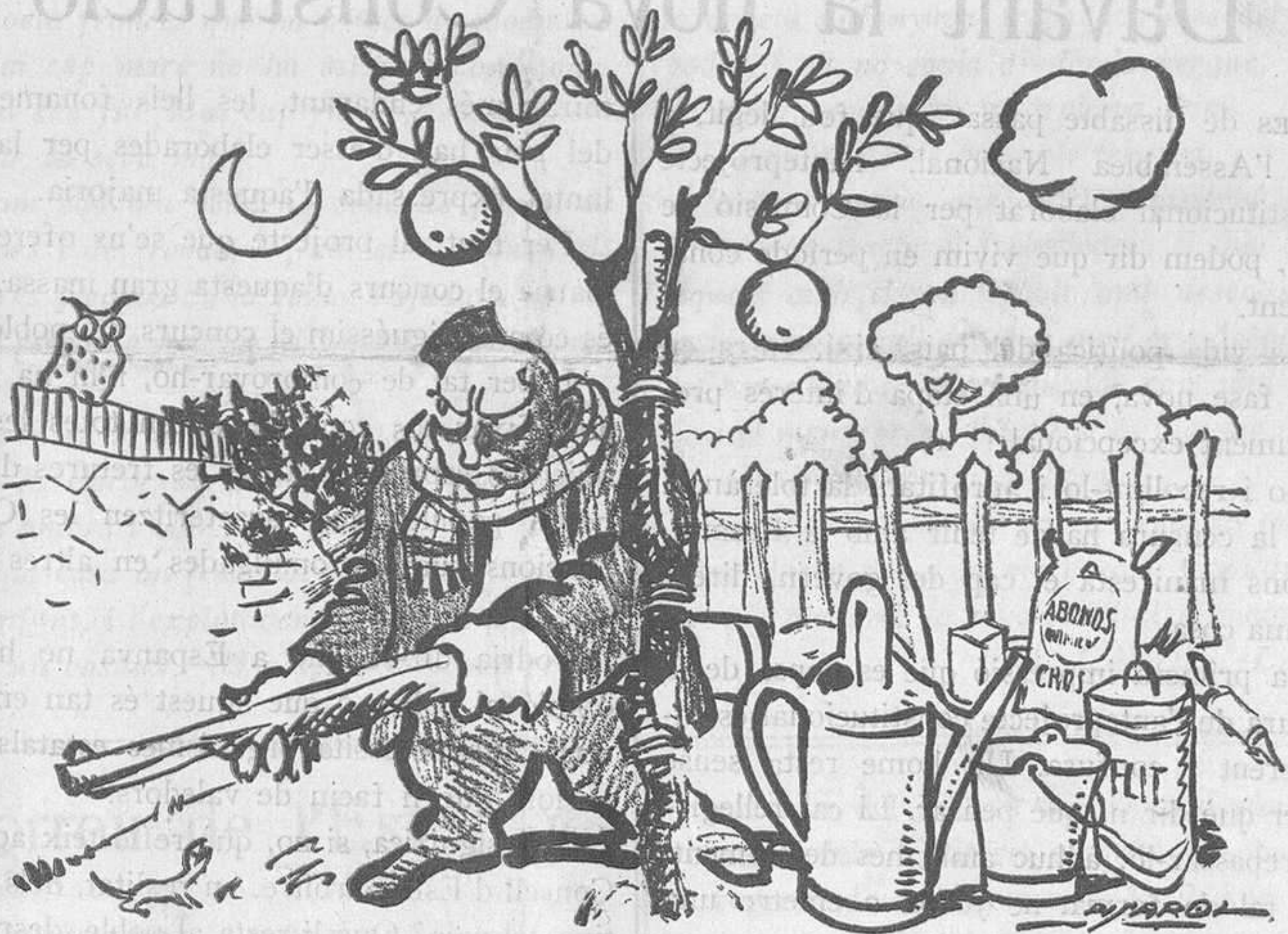
EL BURGÉS AL CAMP

PREUS DE SUBSCRIPCIÓ Fora de Barcelona cada trimestre: ESPANYA, pessetes 1,50.—ESTRANGER, 2,50 pessetes