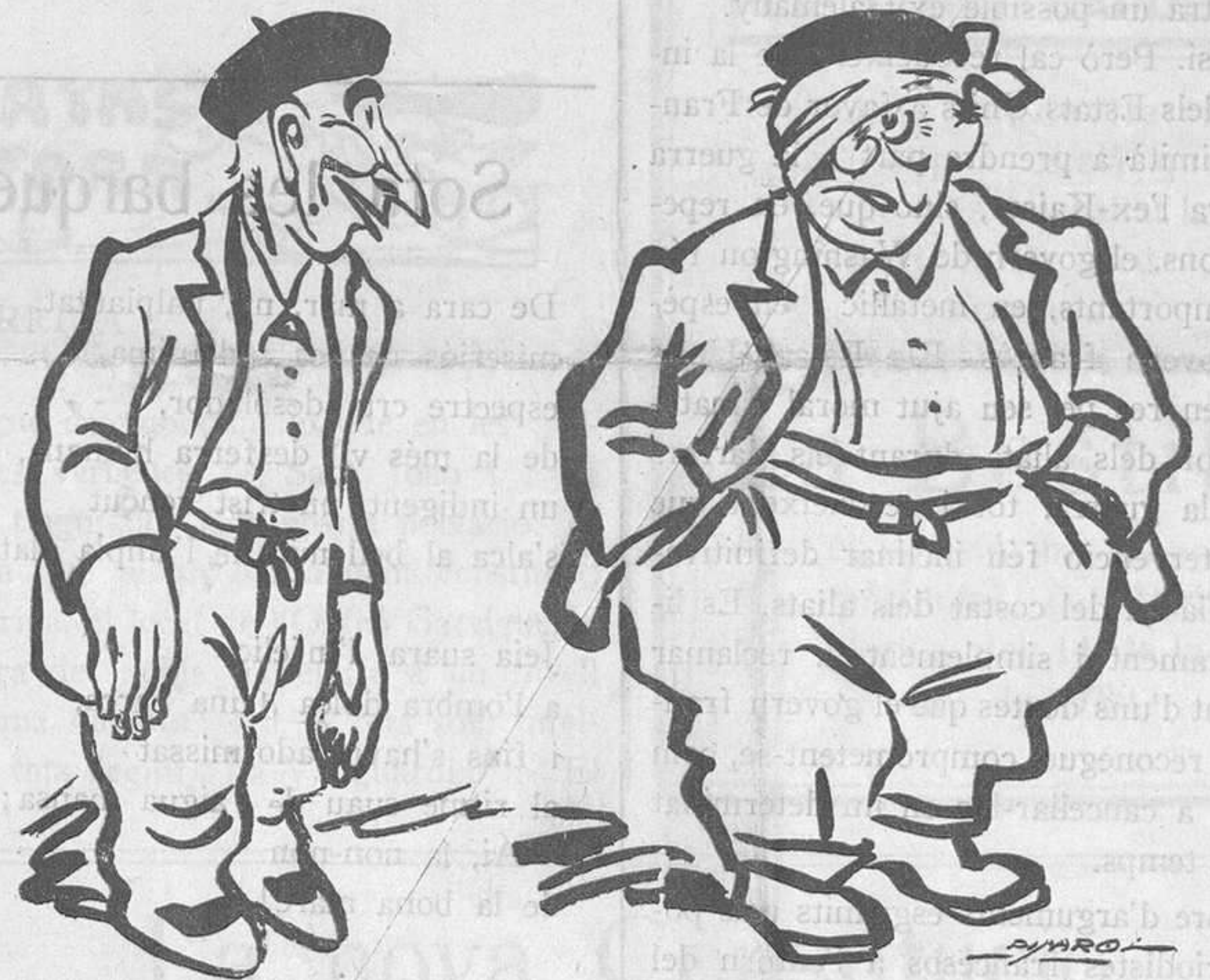
LO QUE POT L'AFICIO

—Aquest any, encara que no dormi en tot l'estiu, no em pendran les pomes.