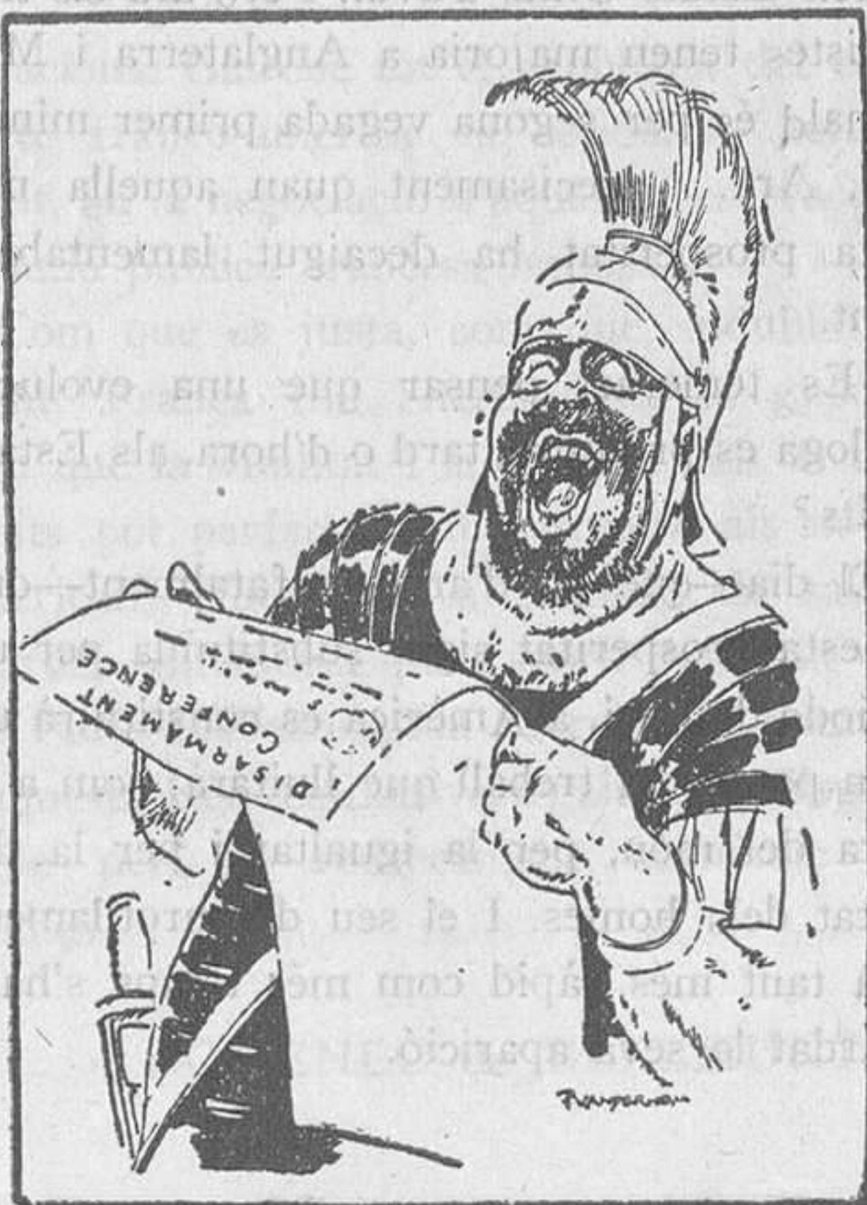
Març: —Els progressos del desarmament!... Quina bola! "Haagsche Post", La Haye.

Gràcies a Déu que no veurem més pares de la pàtria fruits de la mendicitat.