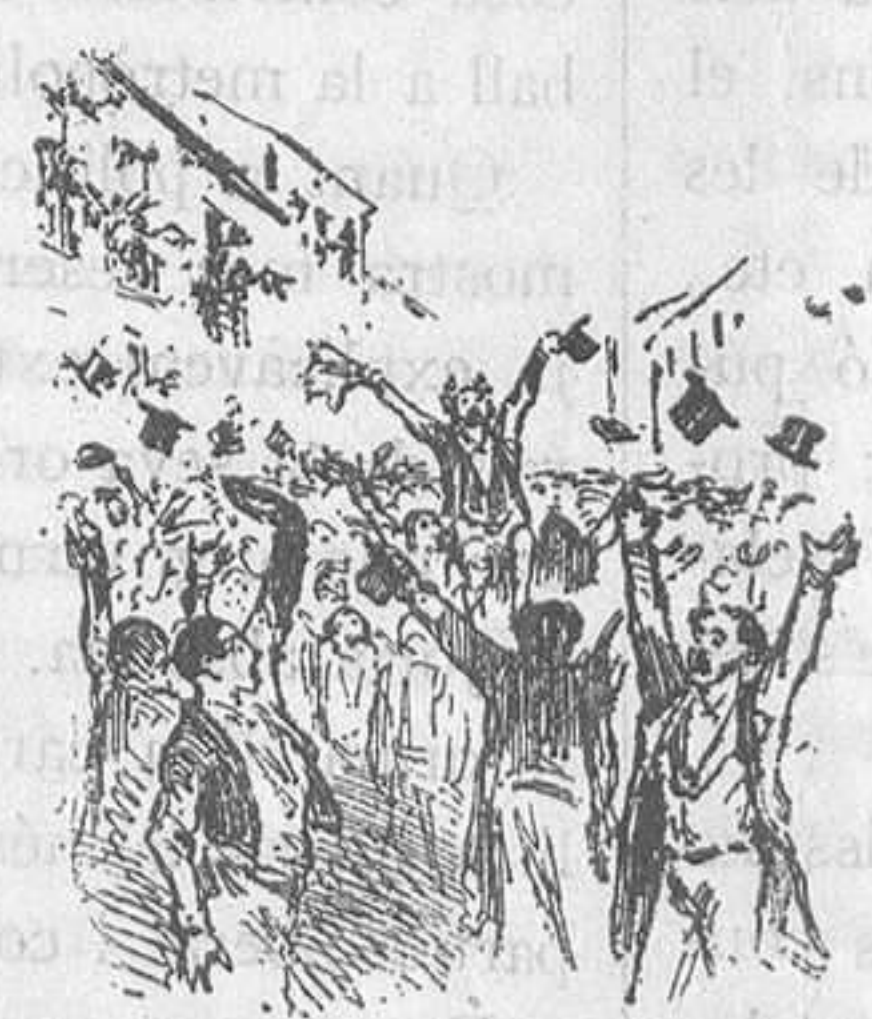
Els mateixos que ahir el vitorejaven.