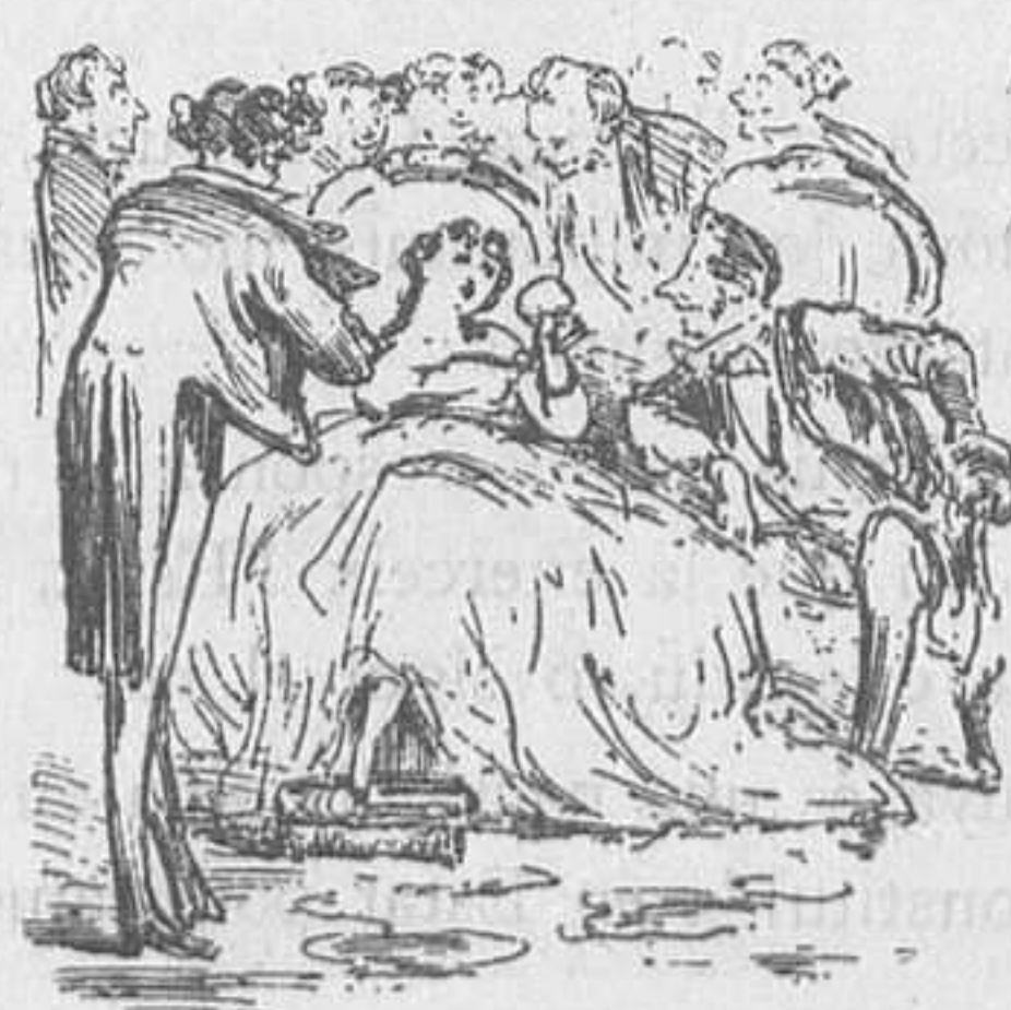
La del principal