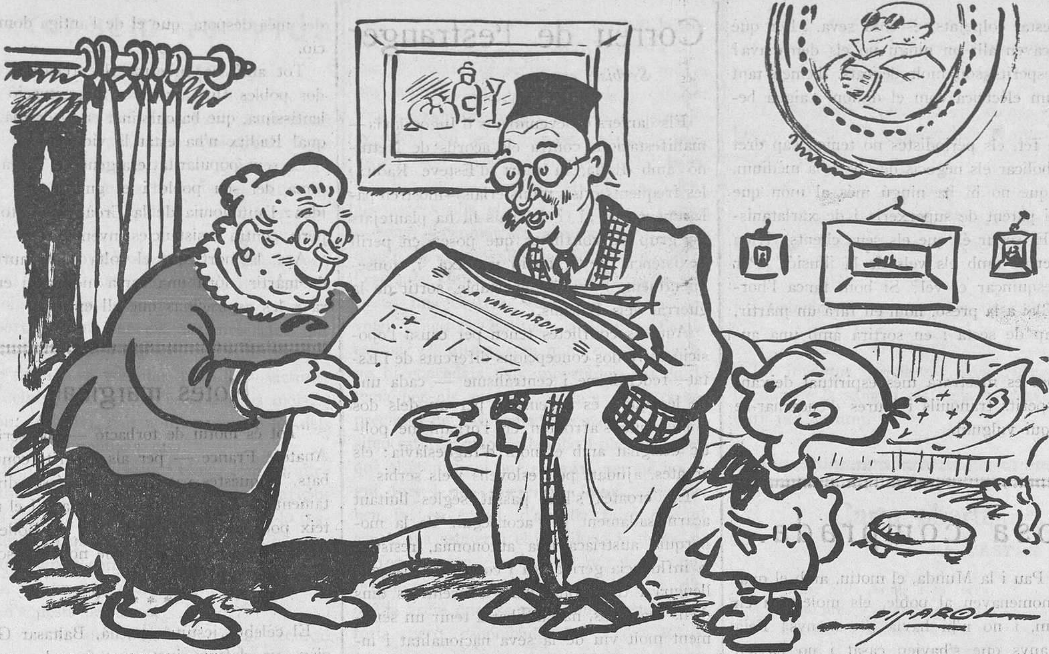
COMENTANT LA PREMSA

—A Gràcia hi han dos mil atacats de grip. Quina desgràcia!