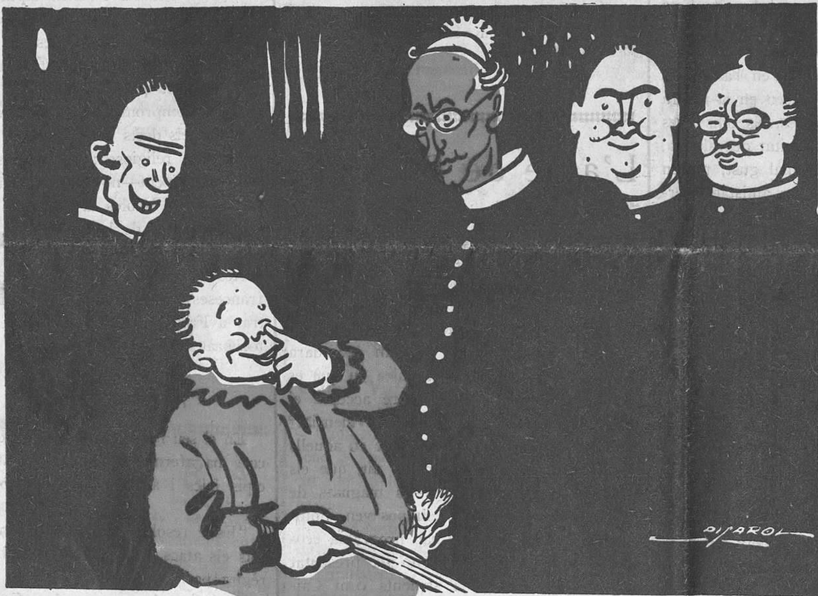
MASSA AL PEU DE LA LLEFRA

Fora de Barcelona cada trimestre: ESPANYA, pessetes 1'50. — ESTRANGER, 2'50