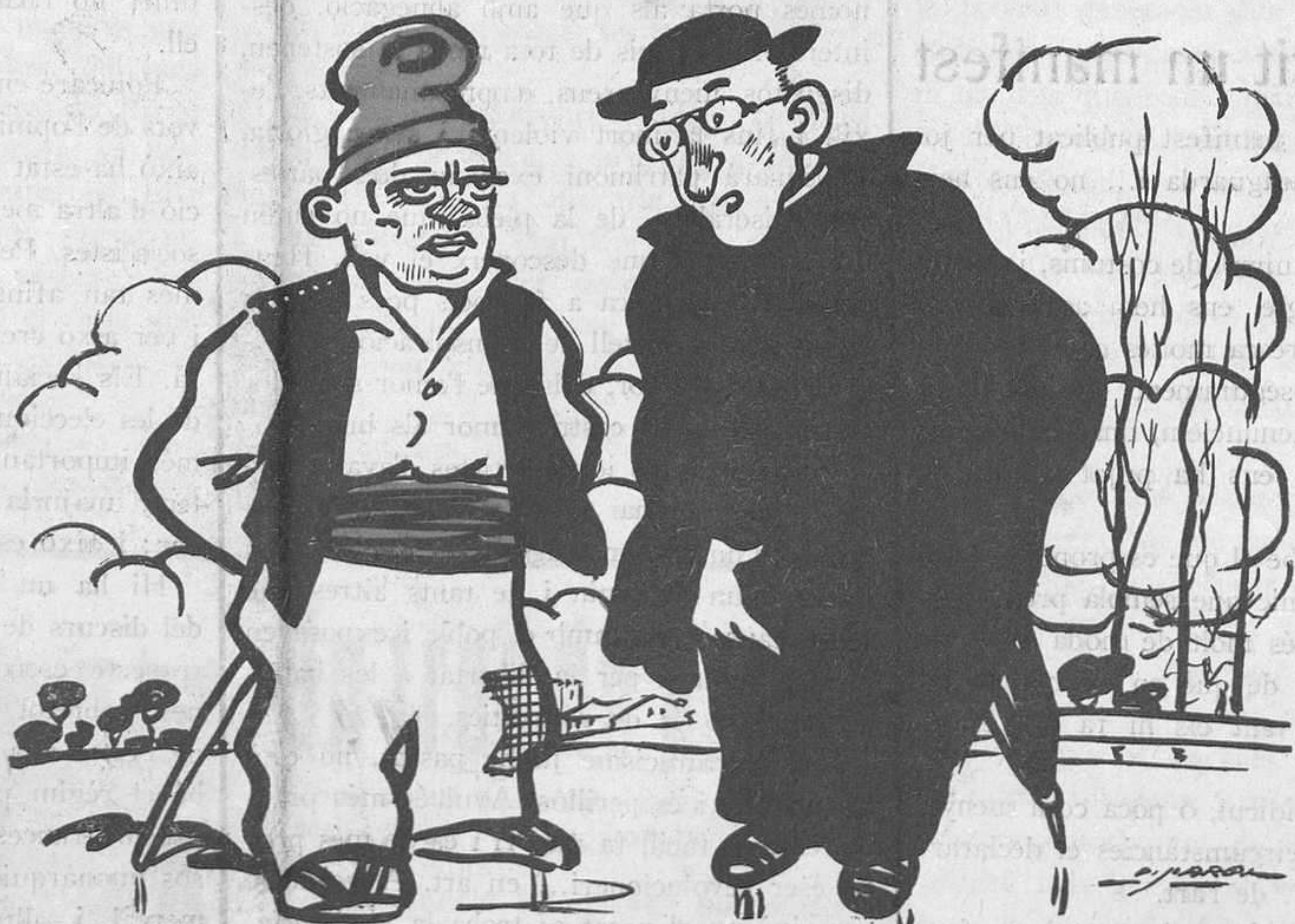
ELS QUE ES QUEIXEN AMB RAO

El senyor Strawinsky ha promogut una sèrie de disgustos entre les famílies afeccionades a la música. S'ha via dit que "Le sacré du printemps" era una cosa fàcil d'entendre, plena d'harmonies i de ritmes musicals senzills, etc... Tothom hi anà confiat en què el que anaven oír era una música sèria, pròpia d'un teatre tan romàntic com el Liceu, i que les innovacions musicals del senyor