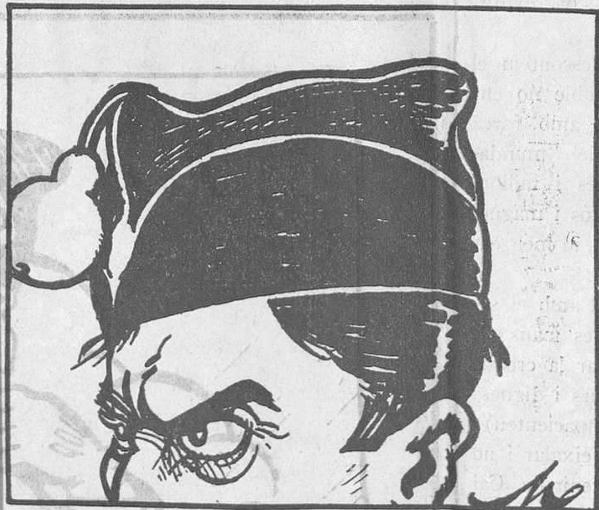
MODEL DE CASQUET PER A EXAMENS

Impremta La Campana i L'Esquella Olm 8, Barcelona