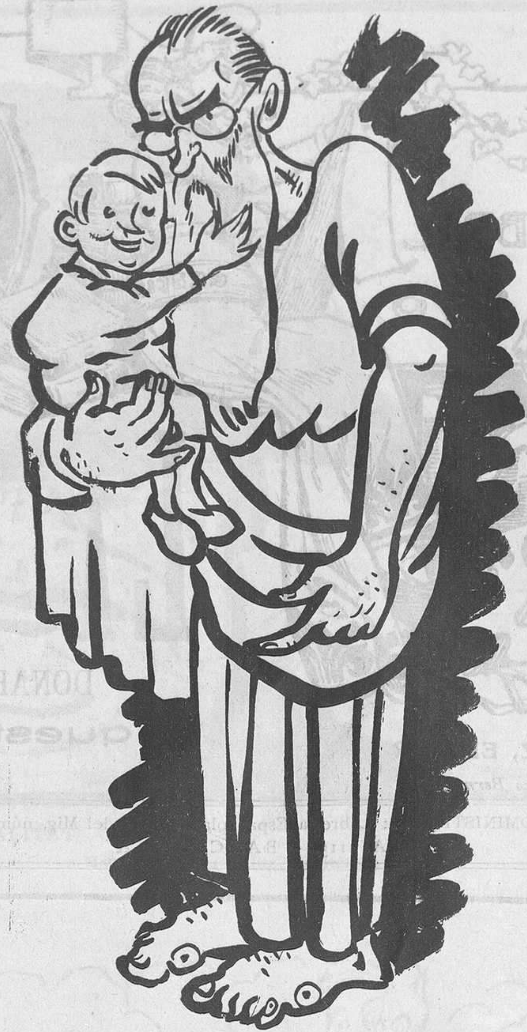
DE LA DIADA

—Ja veurà, senyor, sempre serà una boca menys a omplir. En tinc quatre més de més petits i sóc vídua, sense disposar ni d'un bocinet de terra meua. Em demanen pa i no sé com donar-los-hi.