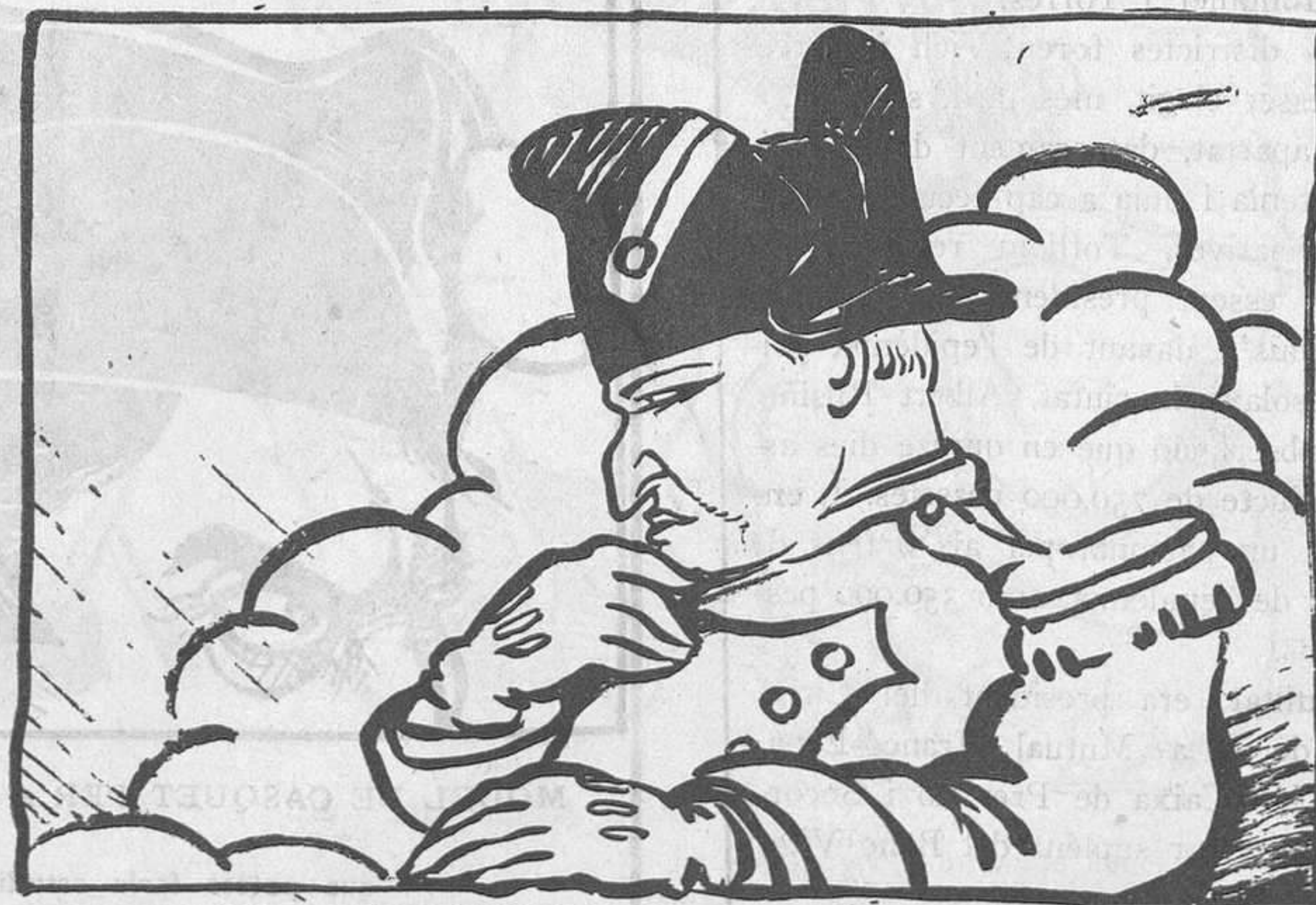
EL POBRE NAPOLEON

I sinó, que no hi possin tècnics; amb capatassos n'hi hauria prou.