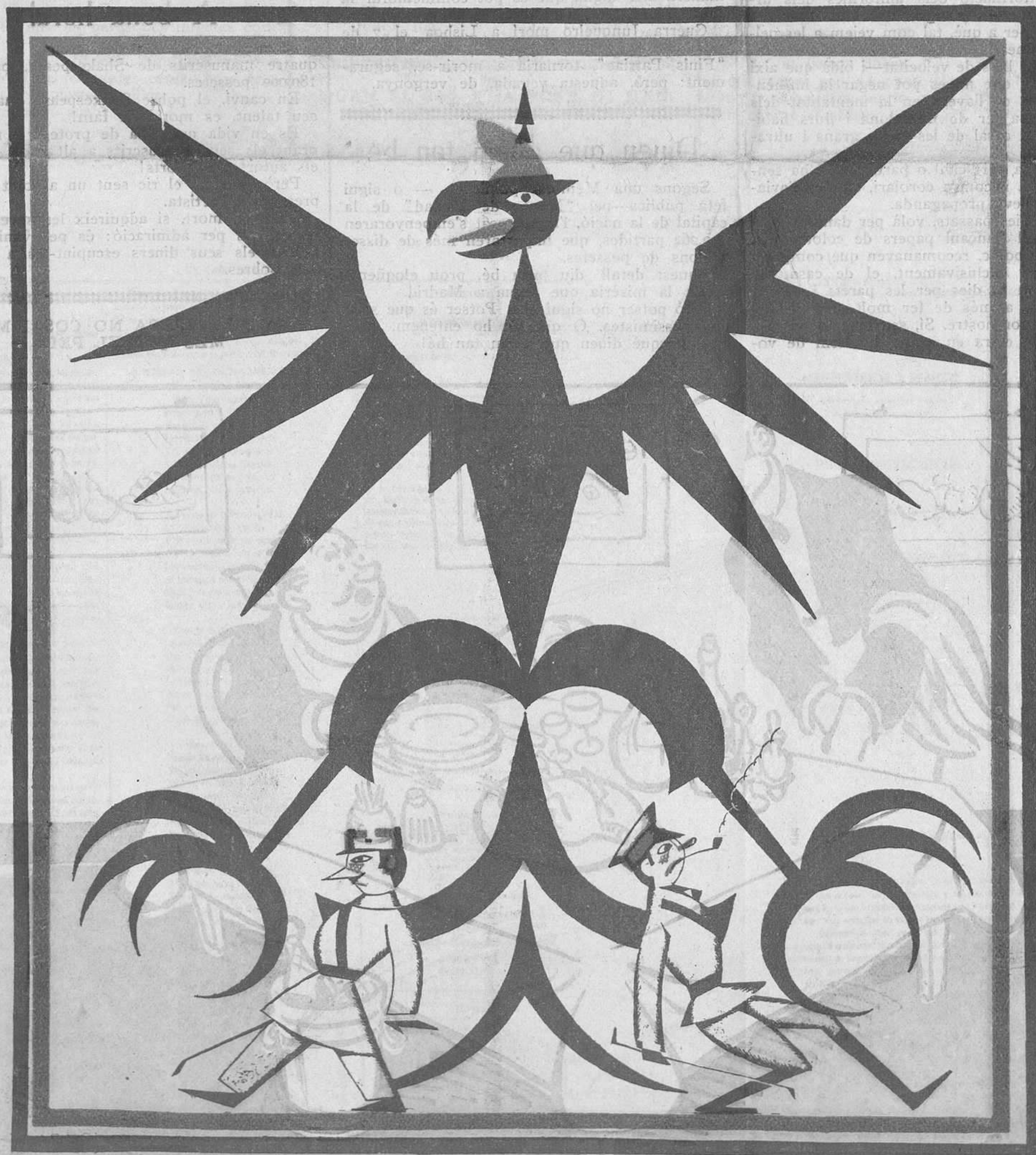
L'àguila alemanya torna a aixecar el cap.