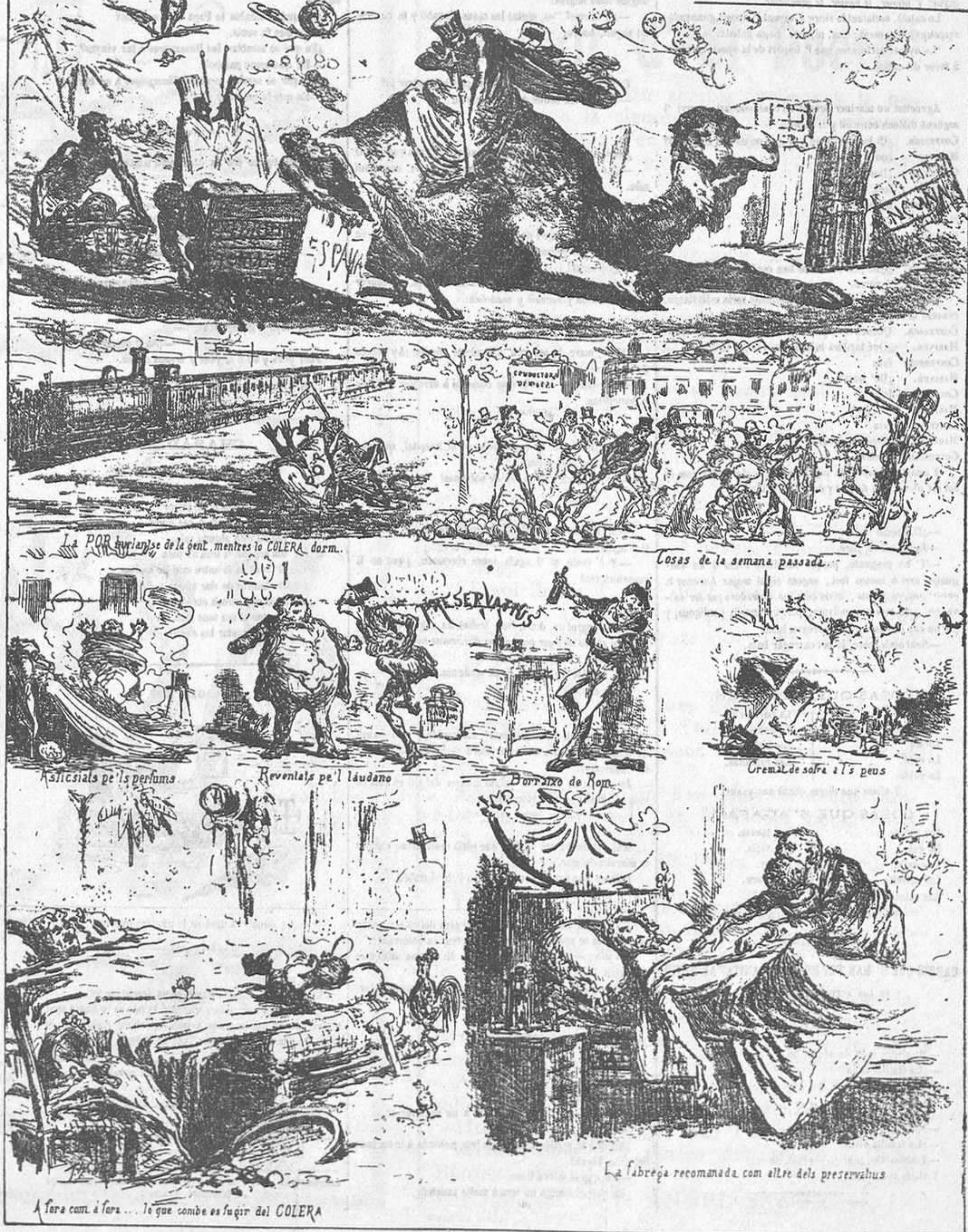
A fora cam a fora... lo que combe es faigir del COLERA