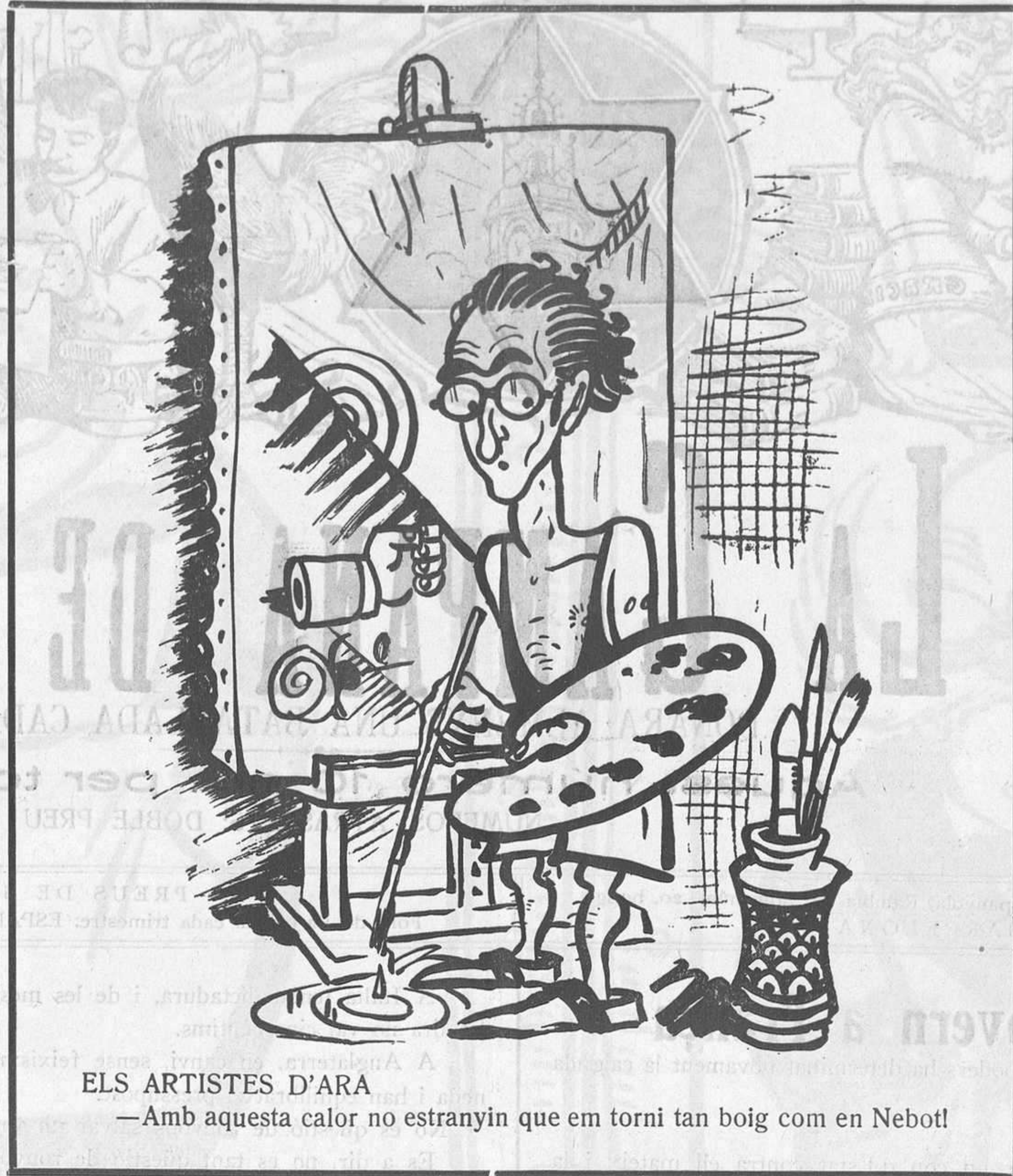
ELS ARTISTES D'ARA

Oh! Sagna el cor al veure com aquesta generació de joventut en mig de la seva magna depressió espiritual defuig d'interessar-se per les grans idees del segle, pels grans problemes latents que es plantegen continuament arreu i no