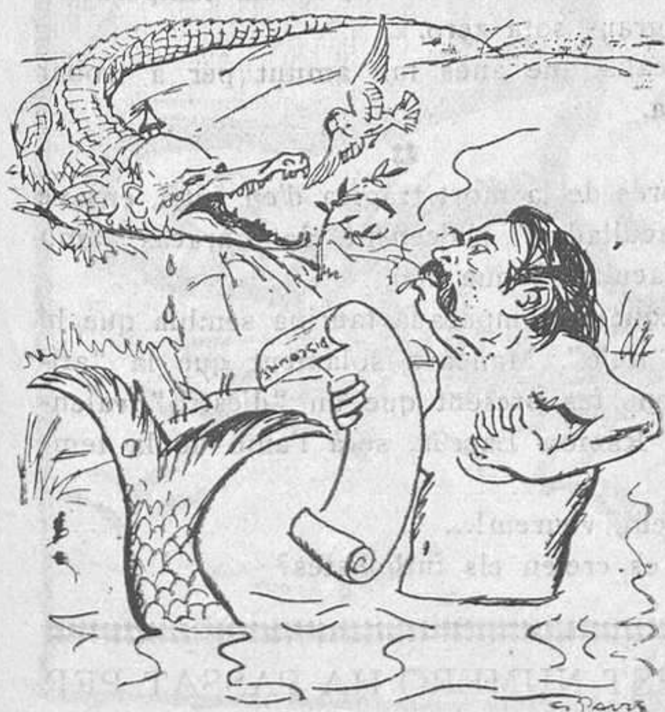
La sirena Briand i el drac Stressemann

Avui dia, si els moderns viatgers els imitaven, totes les esglésies semblarien basars, en què solament hi hauria autos de juguina. No critico ni aprovo la moda: sols ho faig constar.