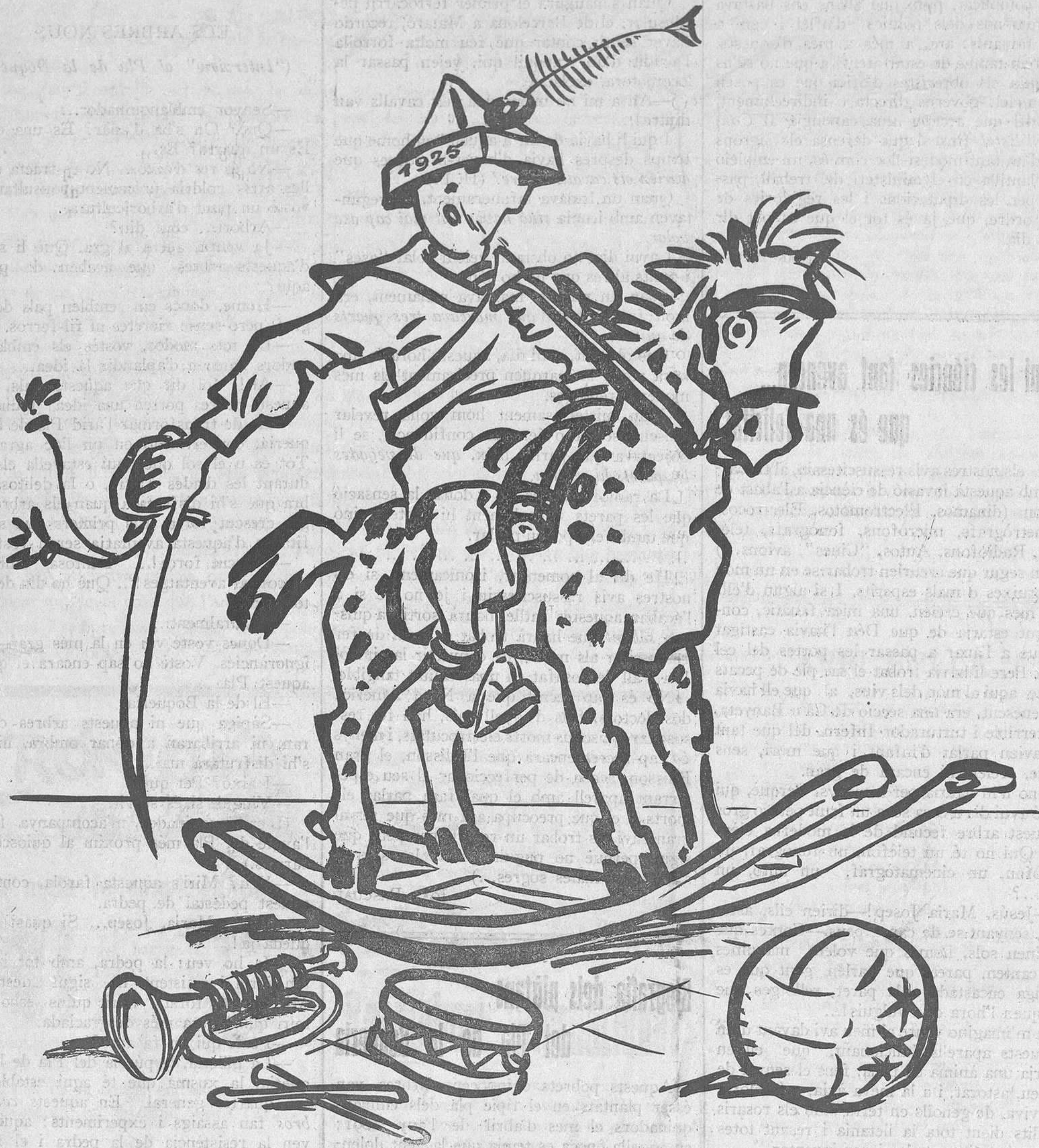
JOCS DE CRIATURES — I que és bonic jugar fent tant soroll!

Les obres anaven progressant, cada dia hi havien més valles, més homes bruts de terra vermella, més fang, més brutícia, més... poca-vergonya. Les Rambles, l'orgull de Catalunya i l'admiració dels forasters, les posaren intransitables, munts de terra per aquí, fustes per allí, i de rellicades i desgràcies no en volgueu més.