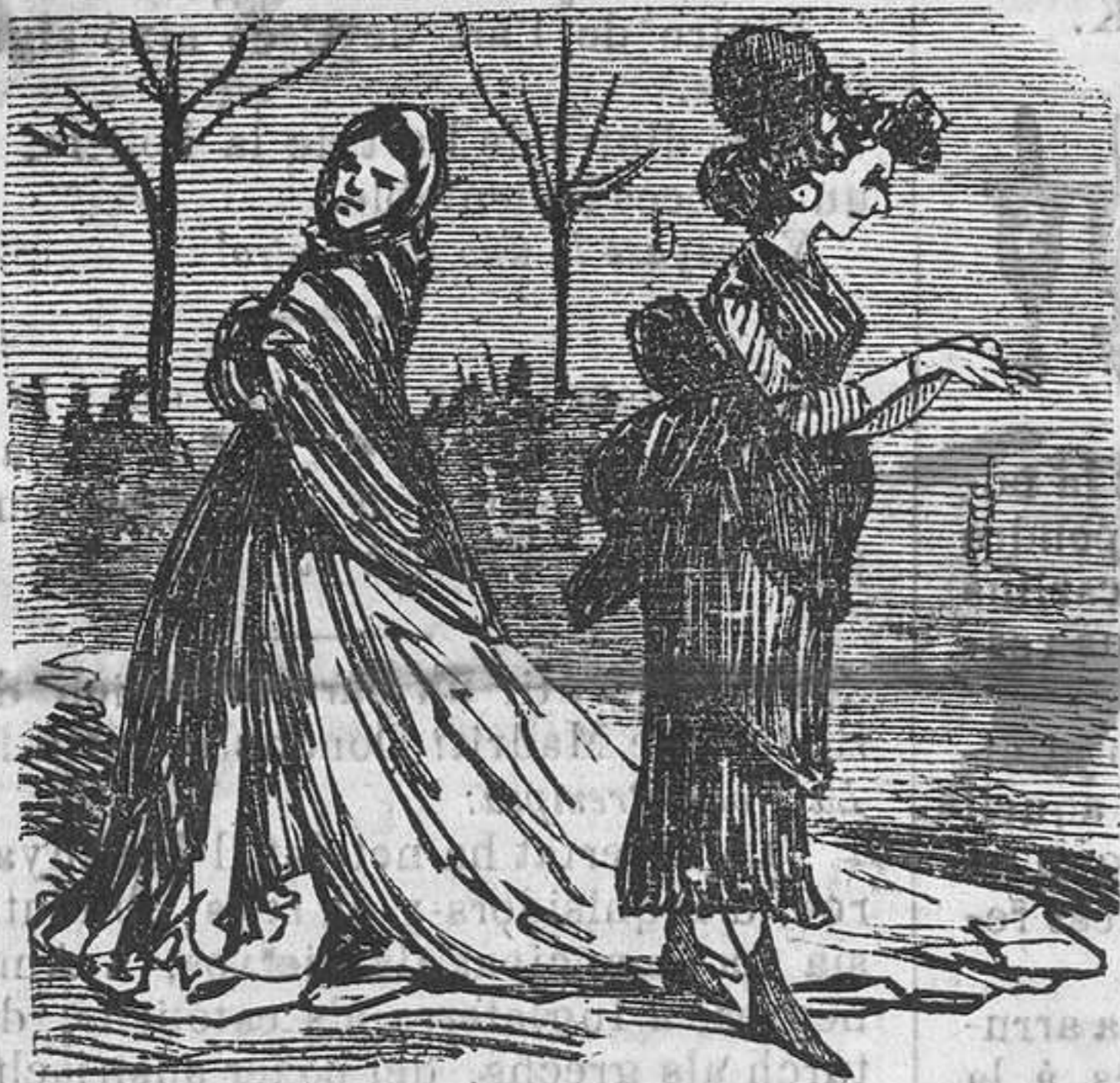
RAMBLA DE SANTA MUXICA.

La Rambla mes prop del mar, es molt bon punt per la fresca, sino que hi van á fer pesca las que vihen de pescar. Allí hi tiran l'art fatal pèl que se enreda en sa malla del Principal á muralla de muralla al Principal.