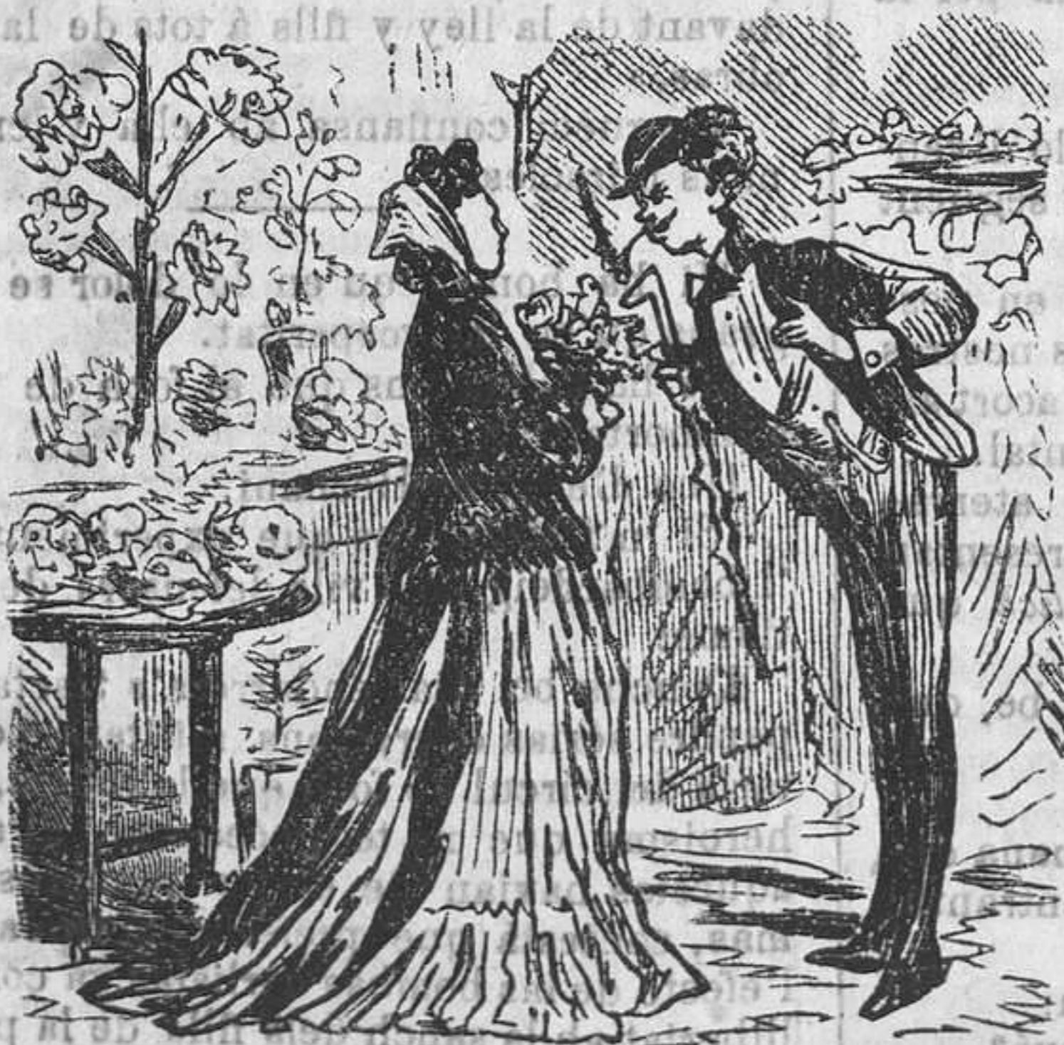
RAMBLA DE SANT JOSEPH.

La Rambla mes prop del mar, es molt bon punt per la fresca, sino que hi van á fer pesca las que vihen de pescar. Allí hi tiran l'art fatal pèl que se enreda en sa malla del Principal á muralla de muralla al Principal.