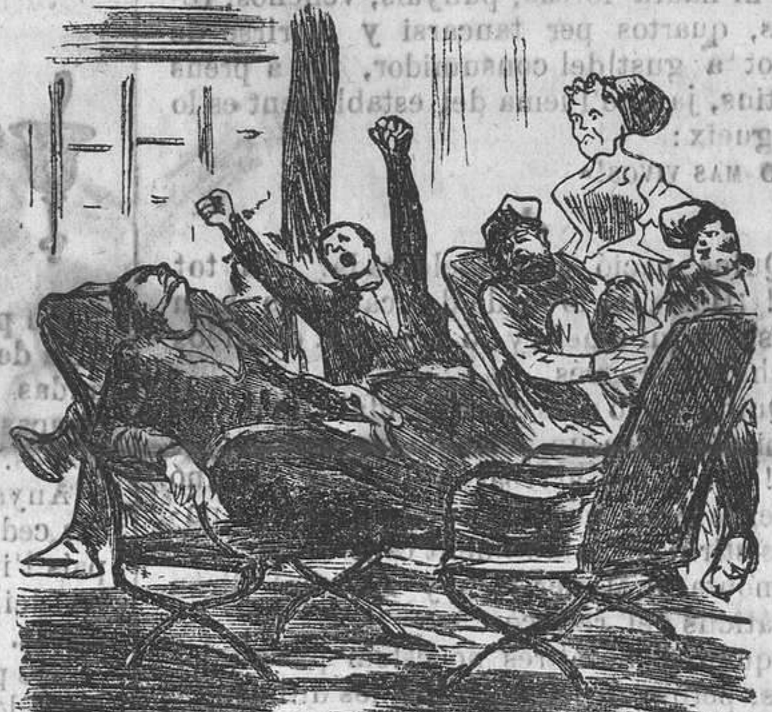
RAMBLA DELS CAPUTXINS.

Mientras de flors hi ha el mercat un contra adagi se so-té allí, no es lo sabate lo qui vá mes al cal; porque 'ls galantejadors que pèl mercat se regiran á qui flors y mes flors tiran es á las que venen flors.