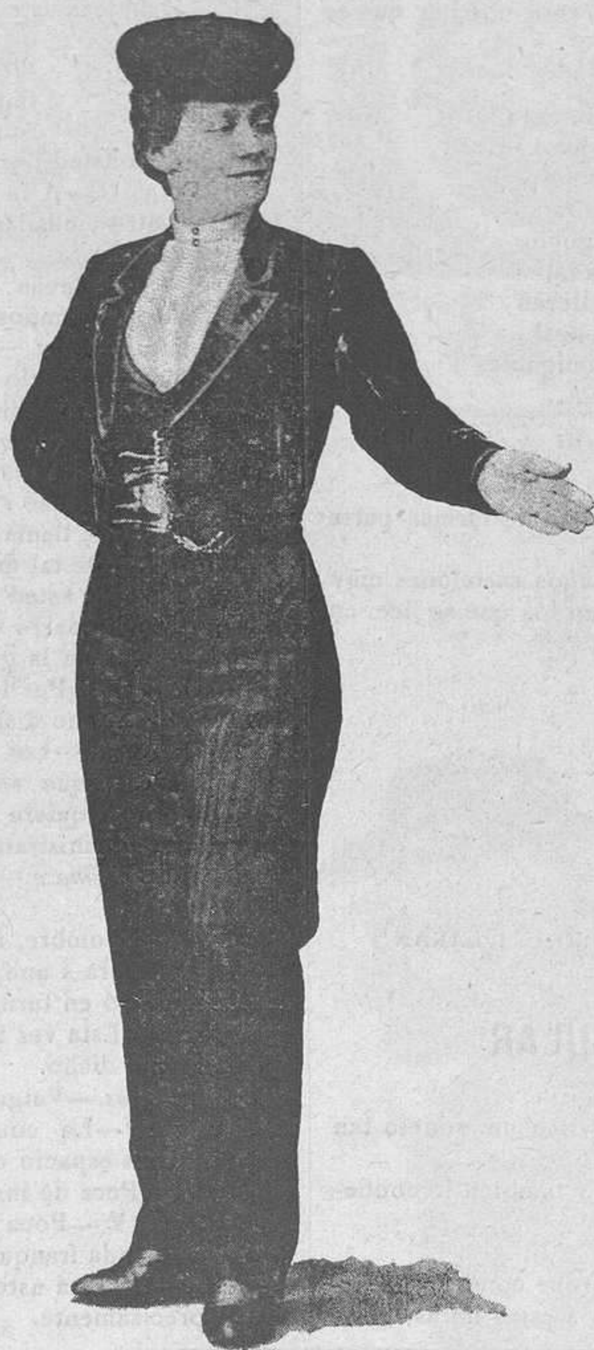
En la zarzuela Caramelo .

dece á una piadosa y antigua costumbre que recuerda hechos de Jesucristo.