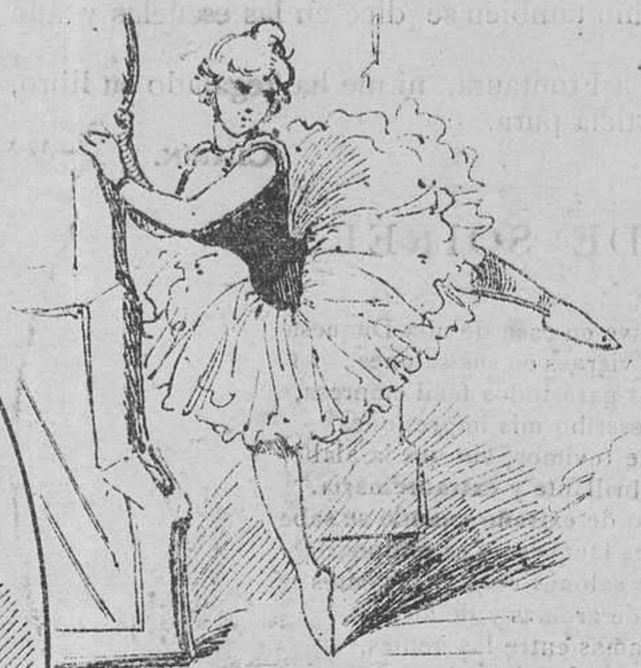
UNA SÍLFIDE DEL MONTÓN

—Nada, la canción eterna se me ha dormido esta pierna.