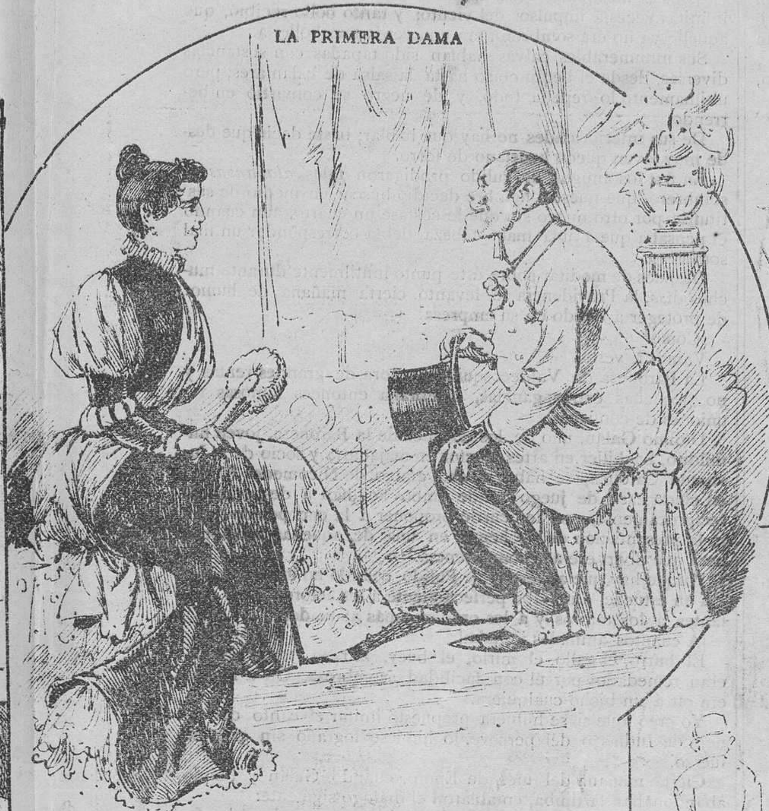
LA PRIMERA DAMA