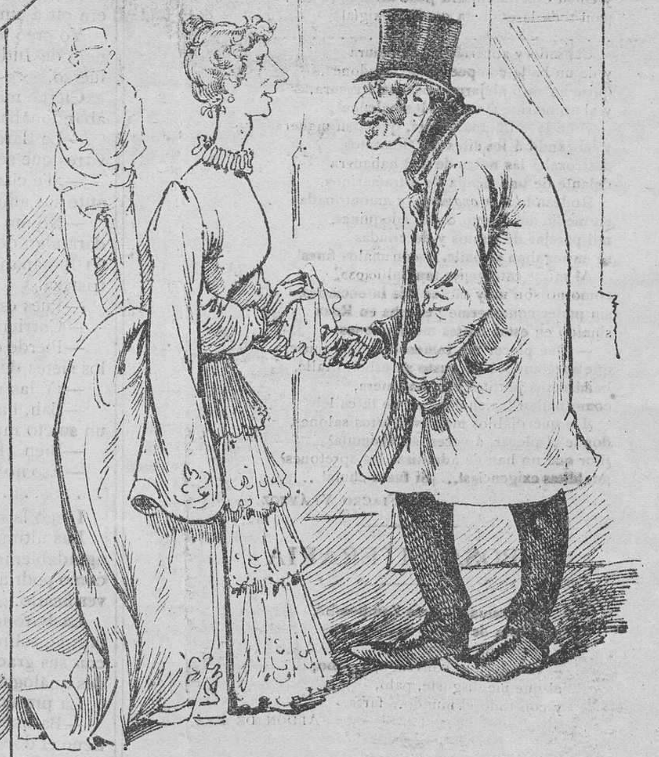
LA PRIMERA CARACTERÍSTICA

—Como aquí todas son unas... cualesquiera, las personas decentes tenemos que aguantarnos... ¡y gracias! —Descuide V., señora; usted tiene siempre buenos amigos y... ¡verá V. qué palo doy mañana á la empresa en La Voz del Contribuyente!