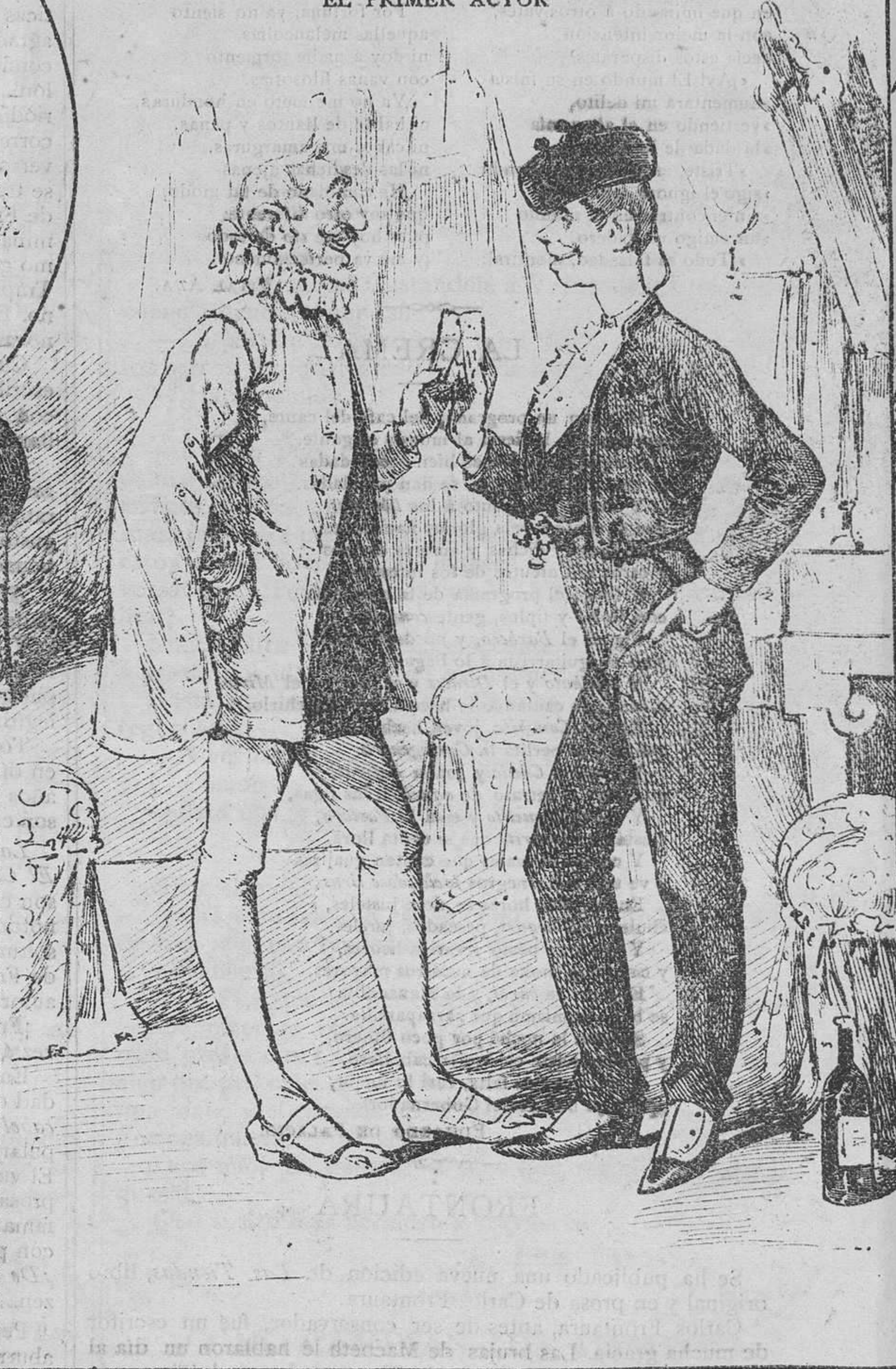
EL PRIMER ACTOR

—Va por tu salú , barbián. —¿Que vas á jaser ahora? —Dai dos pases al gaín y llevarme á su señora.