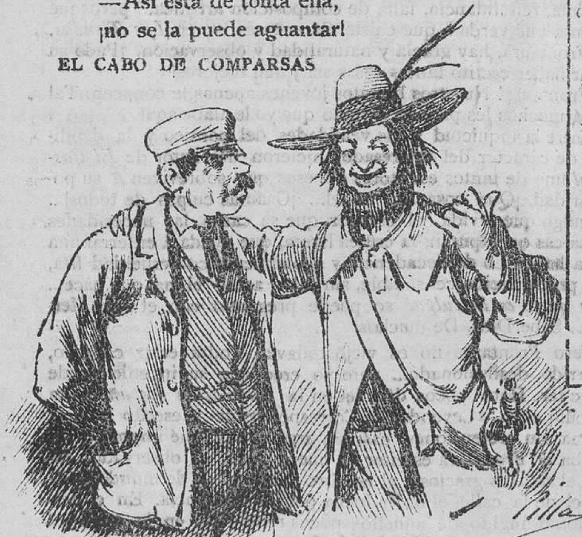
EL CABO DE COMPARSAS

—¿Que aquí nadie se propasa? ¿que tú eres buen celador? ¿que es muy decente la casa? ¡Pues anda á ver lo que pasa detrás de aquel bastidor!