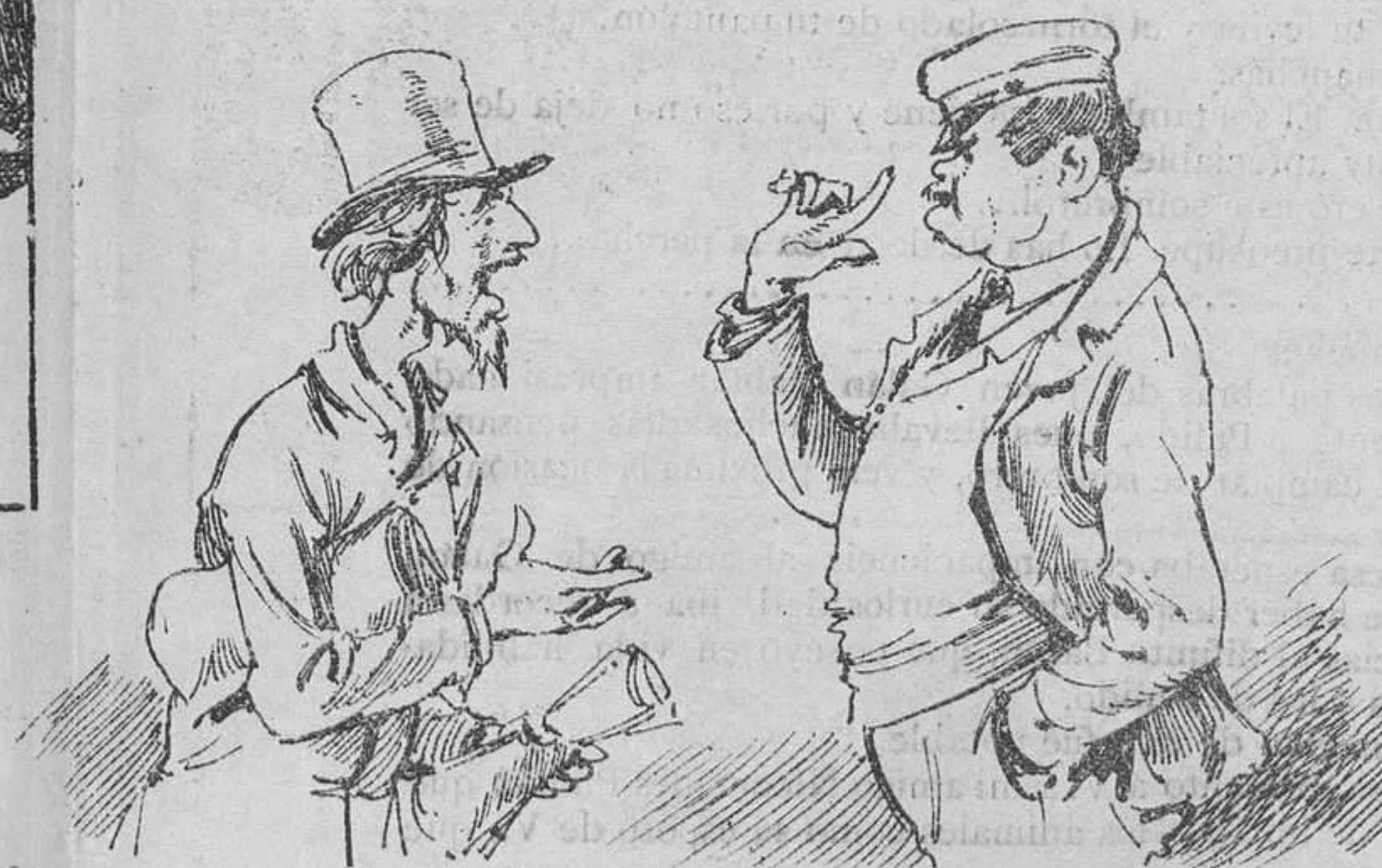
EL PRIMER PORTERO

—Que no se entra no señor. —Pero hombre, si soy autor y tengo ensayo mañana. Avise usted al director. —¿Pues no me da á mí la gana!