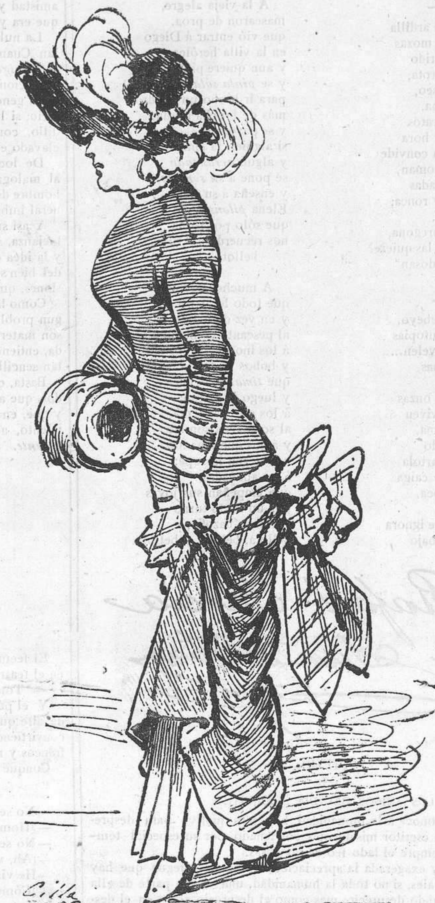
¡Esta moda la ha inventado el demonio! Está probado. ¿Y a esto lo llaman sombrero? ¡Si eso es llevar el alero de un tejado!

¡Digo si conocía a los flacos el vencedor de Pompeyo! Un hombre gordo puede ser valiente, con la impunidad de las ocho pulgadas de manteca que le sirven de coraza; dígame si no mister Sponer, á quien un judío en la feria de Atherston le clavó en la barriga cuatro pulgadas de puñal. Mister Sponer miró con desprecio á su asesino, y soltando una ruidosa carcajada, le dijo:—¡Animal, ahí me las des todas! ¡Cuatro pulgadas!... ¡Con dos me hubieran borrado á mí del gran libro de los vivos! Si esto no patentiza una gran ventaja sobre los flacos, que venga Dios y lo vea. Pues... ¿á dónde me dejan Vdes. el sueño de los gordos?... ¡Qué armonioso!... ¡Qué grandioso! ¡Qué magestoso!!! La garganta y las narices de un hombre gordo, cuando duerme, atesoran todas las estrepitosas melodías que acompañaron al Patriarca Noé durante su peregrinacion en el arca santa. Yo tengo un amigo, compañero de caza, que cuando duerme, tan pronto preludia el estridente silbido de la culebra, como el áspero bufido del gato. Unas veces brama como el toro, se lamenta como la vaca merina, muje como el leon y aulla como el lobo. Es una delicia tenderse en la cama inmediata á la que él ocupa; cuando cambia de postura, se oyen crujidos de terremoto. Una noche, él dormía y yo filosofaba; en el fondo oscuro de la alcoba, vi destacarse la pálida y descarnada imagen de la envidia. La at-