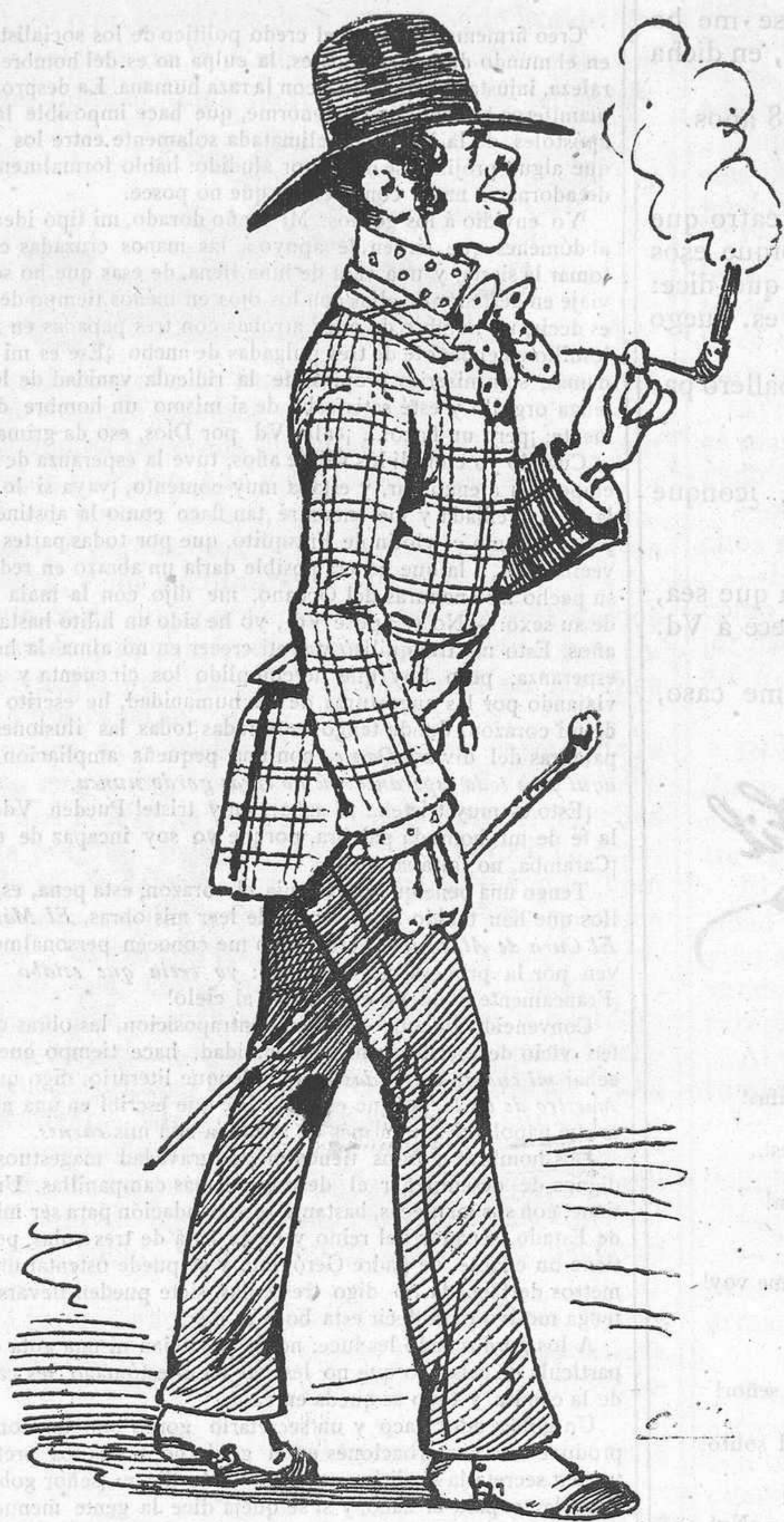
¡Qué modas y qué invenciones! Como la viera mi abuela, le echaba mil maldiciones. ¡Si esto es vestirse con tela de colchones!