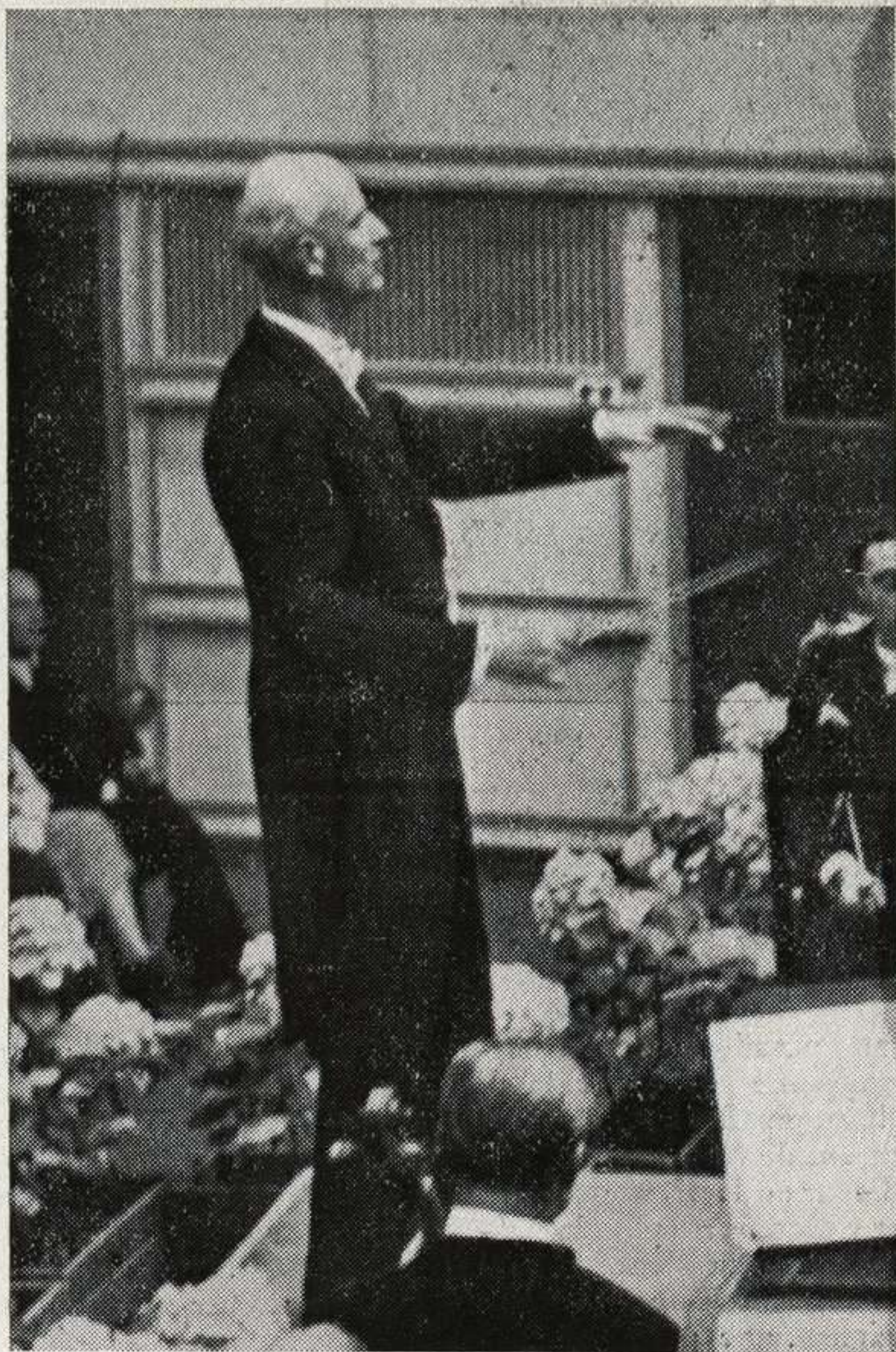
Furtwangler, dirigiendo uno de sus tradicionales conciertos a la Filarmónica de Berlín

Nada hay inexplicable, y cuando se ha hablado de ellos, cuando han hablado los literatos o los poetas—del director como del último mago o nigromante, han explotado, simplemente, los resultados de algo menos misterioso: la bondad de espíritu, la actitud de servicio, el ejercicio directo y sin ambiciones de una auténtica vocación. La función que puede parecer más misteriosa del intérprete, la adivinación de lo que los autores, impresionados por su «yo» y su ambiente quisieron expresar en los pentágramas, se ejerce, la ejercieron los