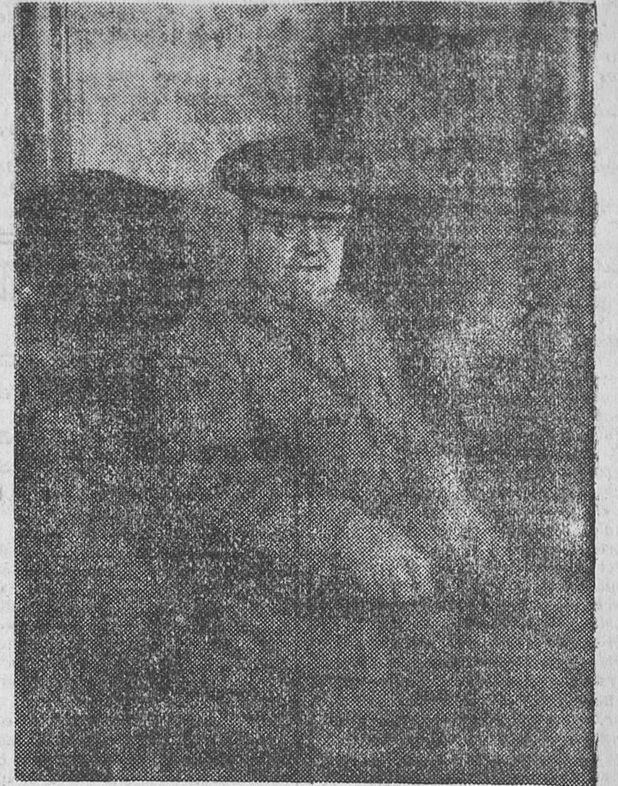
Al diario madrileño LA LIBERTAD, con motivo de cumplirse el aniversario de la destrucción de su casa por la aviación fasciosa.—El general José Miaja.—Madrid, 16-11-1937