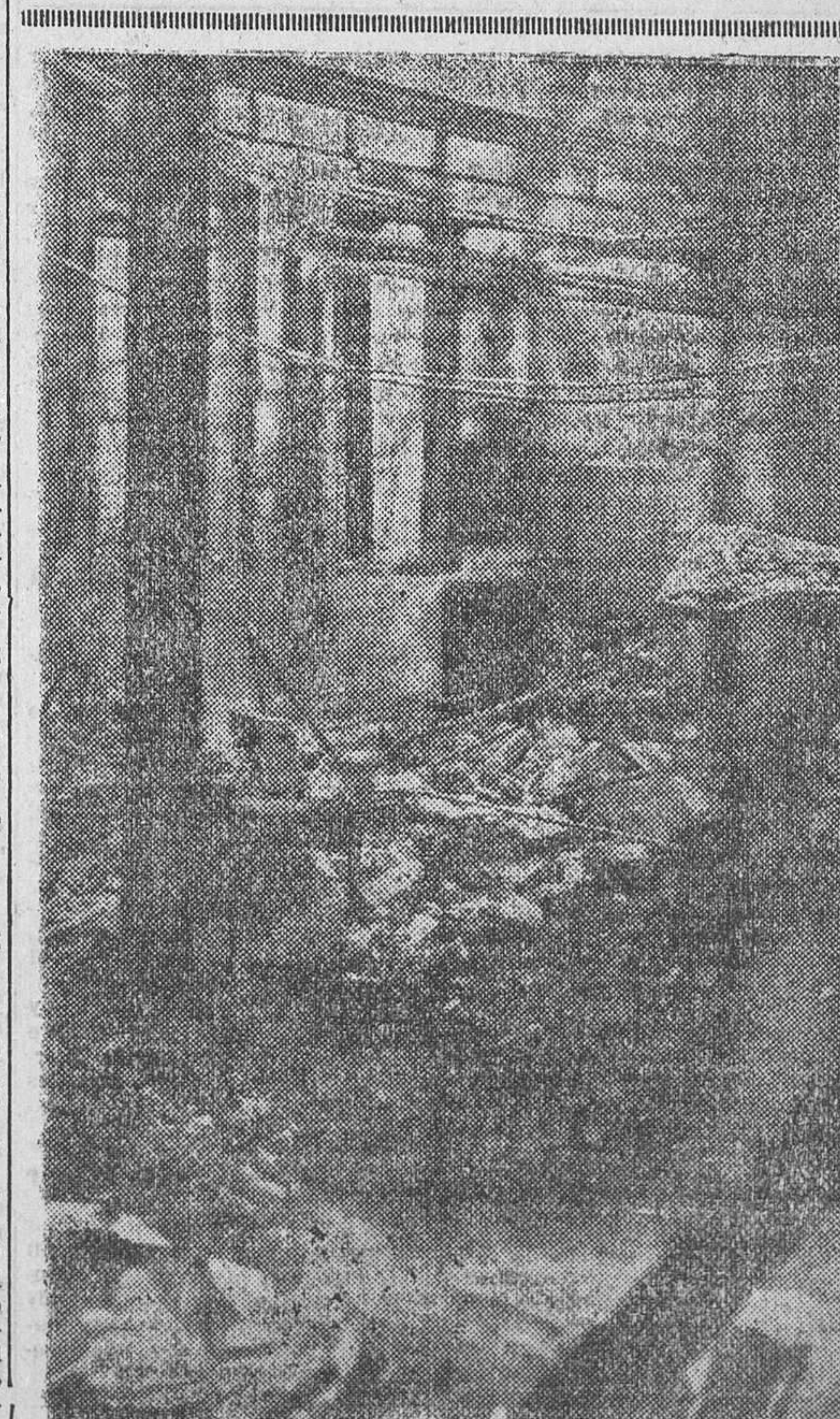
Aquí—sala de máquinas—quedaba impreso el pensamiento, que luego se convertía en bandera de combate al clamor matinal de los voceadores. Pero el pensamiento y la libertad triunfan de la guerra y de la muerte

Azalla, 17.—Unos soldados de artillería evadidos del campo faccio-