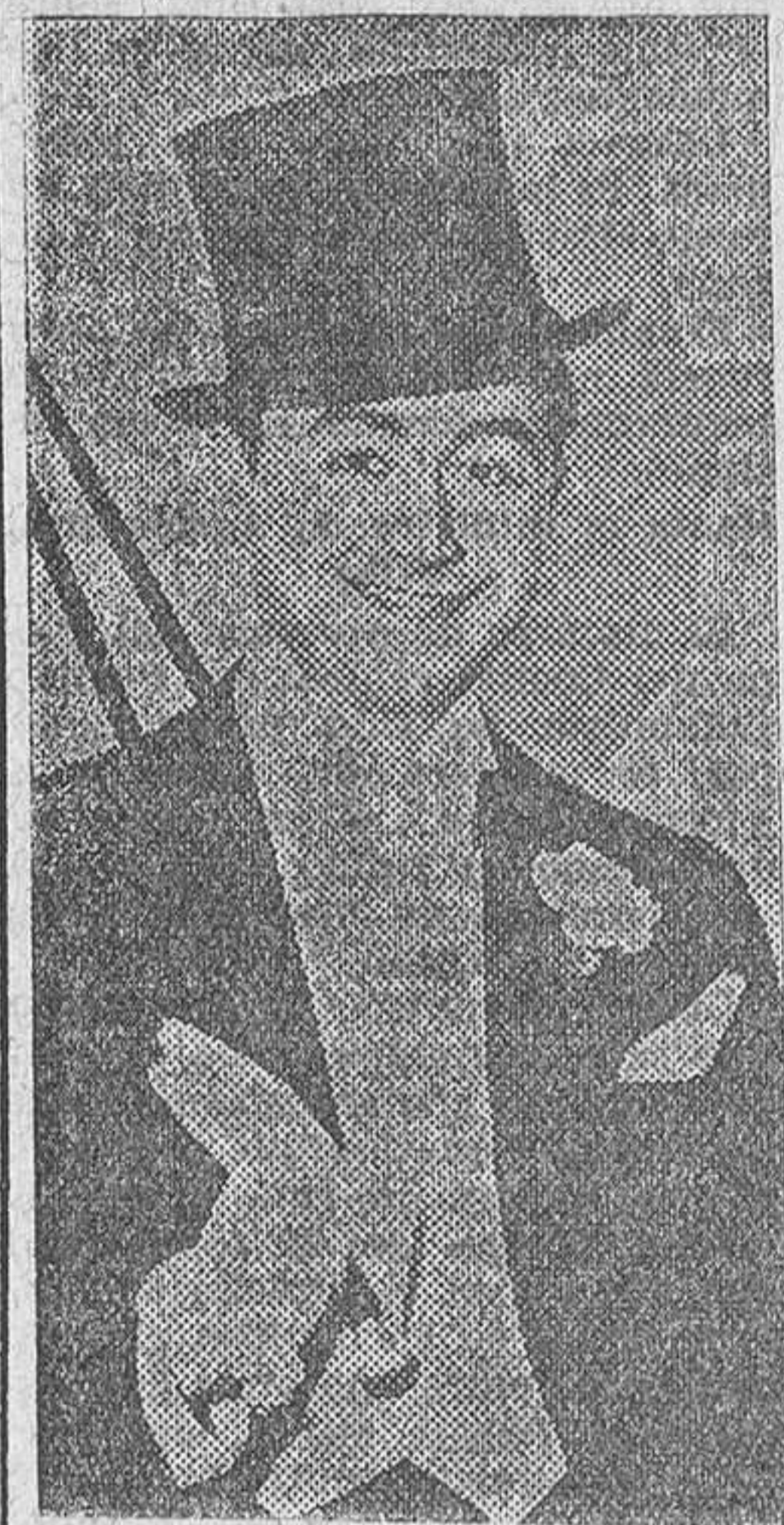
Robert Young, popular artista de la M. G. M., intérprete, con Jessie Matthews, del gran film Gaumont British «Es el amor», que el lunes se estrenará en Madrid-Paris

AVENIDA. —4 y 6, El rey de los condenados. BARCELO. —3,30 y 5,45, Dos espías. BELLAS ARTES. —De 11 a 4 y 4 y 6, El que todo lo fué. BENAVENTE. —4 y 6, Bolero. BILBAO. —4 y 6, Una noche en la Opera (tercera semana). GALATRAVAS. —De 11 a 3 y 4 y 6, Barrios bajos. GALLAO. —A las 3,30 y 6, programa doble, Estaba escrito y Hombrés sin nombre. CAPITOL. —4 y 6, La vida futura (segunda semana). Intermedios por la Orquesta Cases. CARRETAS. —De 11 a 3 y 4 y 6, Una noche en la Opera. CHAMBERI. —4 y 6, Esta noche es nuestra.