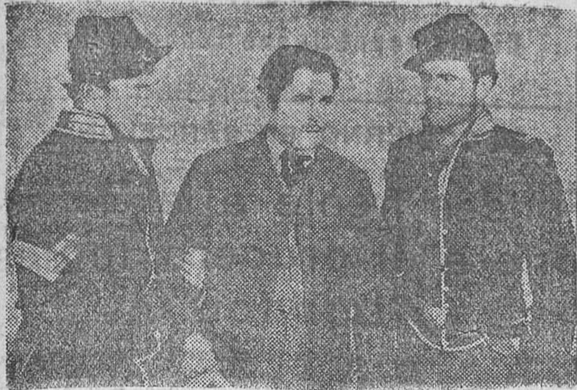
Warner Baxter en «Prisionero del odio», film que mañana lunes se estrenará en el Capitol